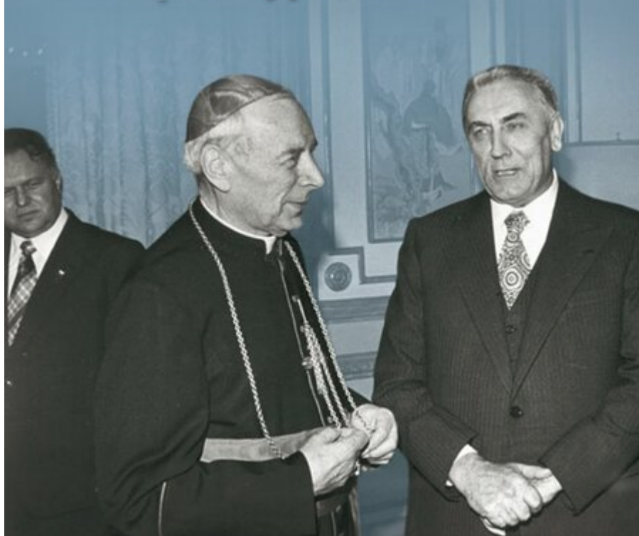
Kościół katolicki w Polsce rządzonej przez komunistów