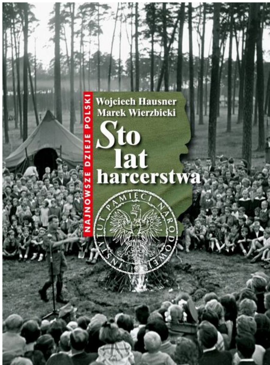
e-Book Sto lat harcerstwa