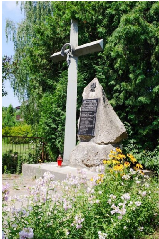
Urzędów