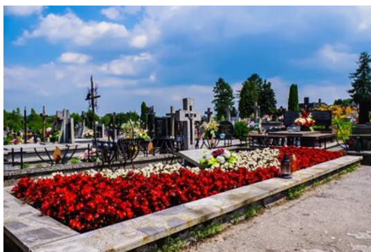
Janów Lubelski