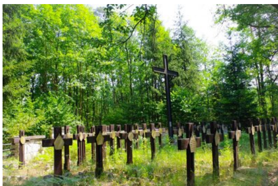
Chruśtanki Józefowskie