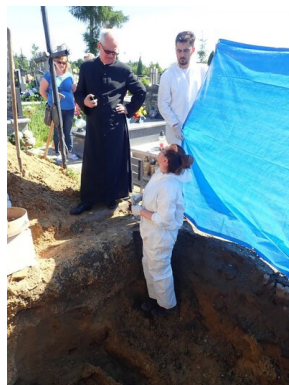
Prace ekshumacyjne w Zwoleniu