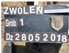
Prace ekshumacyjne w Zwoleniu

Pogrzeb szczątków w nowej mogile na cmentarzu parafialnym w Zwoleniu odbędzie się 8 czerwca 2018 roku o godz. 10.