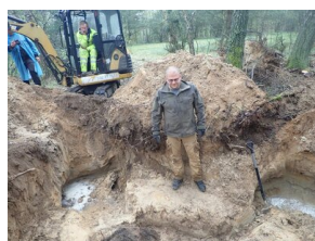
Prace ekshumacyjne w gminie Turośń Kościelna.