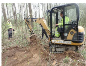
Prace ekshumacyjne w gminie Turośń Kościelna.