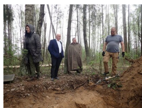
Prace ekshumacyjne w gminie Turośń Kościelna.