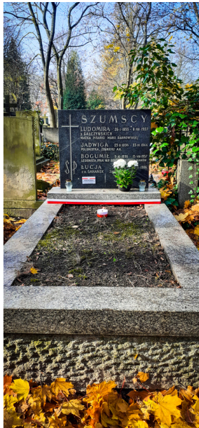
"Zapal znicz na grobie Weterana" 2022