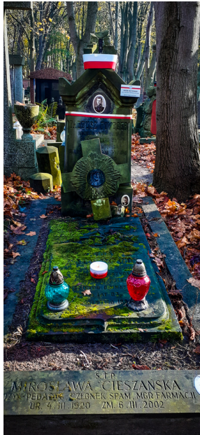
"Zapal znicz na grobie Weterana" 2022