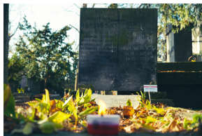
"Zapal znicz na grobie Weterana" 2022