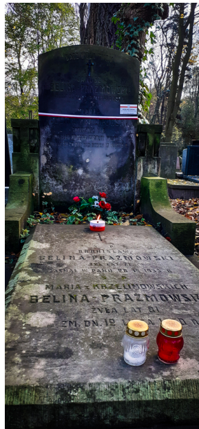
"Zapal znicz na grobie Weterana" 2022