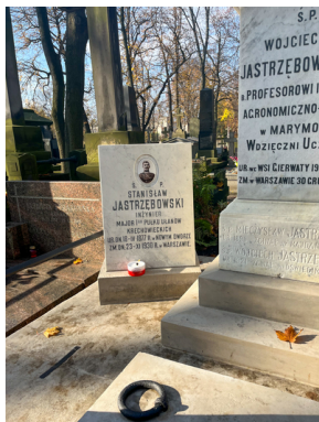
"Zapał znicz na grobie Weterana" 2022