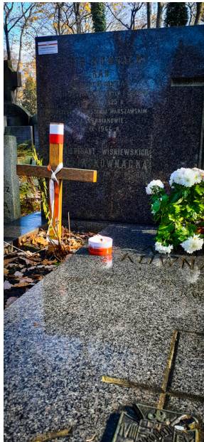
"Zapal znicz na grobie Weterana" 2022