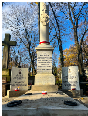
"Zapał znicz na grobie Weterana" 2022

Jeżeli ktokolwiek ma wiedzę o zaniedbanym grobie bohatera, powinien się do nas zgłaszać.