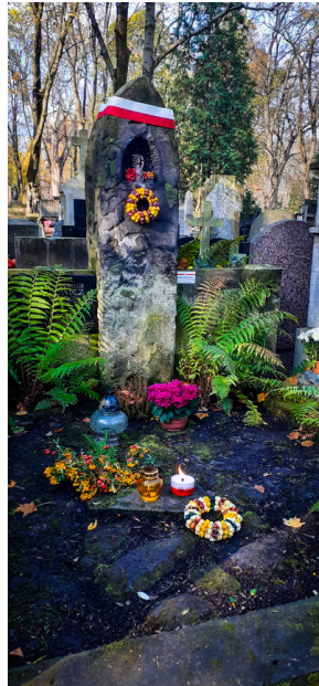
"Zapal znicz na grobie Weterana" 2022