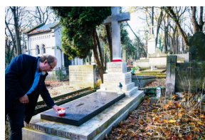
„Zapal znicz na grobie Weterana” 2022