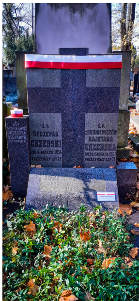
"Zapał znicz na grobie Weterana" 2022

Biuro Upamiętniania Walk i Męczeństwa IPN zaangażowane jest w kultywowanie pamięci o tych, którzy walczyli i cierpieli za niepodległą i suwerenną Polskę, a po wojnach wrócili do cywilnego życia, choć często na emigracji, z dala od najbliższych i umiłowanej Ojczyzny. Co roku udzielane są dotacje celowe oraz przyznawane świadczenia pieniężne na pokrycie kosztów sprawowania opieki nad grobami weteranów w myśl ustawy z dnia 22 listopada 2018 r. o grobach weteranów walk o wolność i niepodległość Polski.