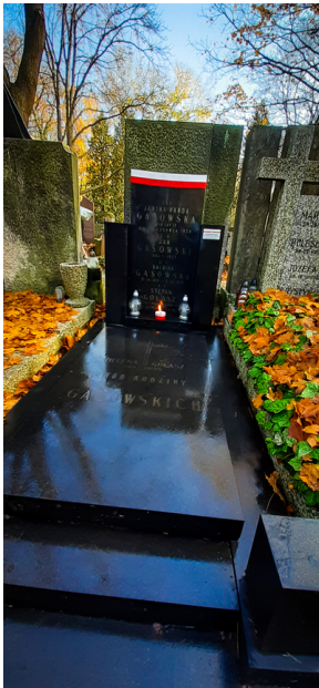
"Zapal znicz na grobie Weterana" 2022