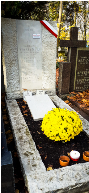
"Zapal znicz na grobie Weterana" 2022