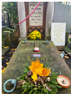
"Zapał znicz na grobie Weterana" 2022