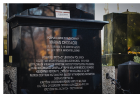
„Zapal znicz na grobie Weterana” 2022