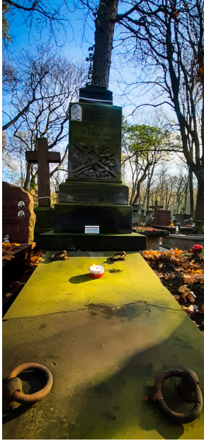
"Zapal znicz na grobie Weterana" 2022