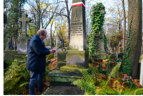
"Zapal znicz na grobie Weterana" 2022