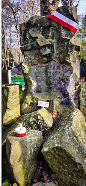
"Zapal znicz na grobie Weterana" 2022