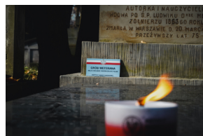
„Zapal znicz na grobie Weterana” 2022