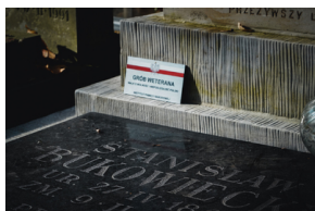
„Zapal znicz na grobie Weterana” 2022