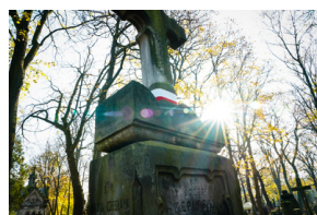
„Zapal znicz na grobie Weterana” 2022