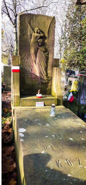
"Zapal znicz na grobie Weterana" 2022