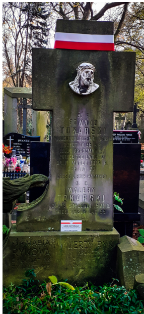
"Zapal znicz na grobie Weterana" 2022