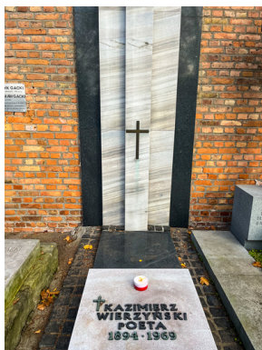
"Zapał znicz na grobie Weterana" 2022