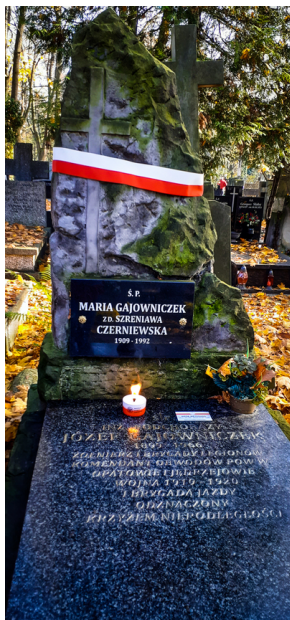
"Zapał znicz na grobie Weterana" 2022