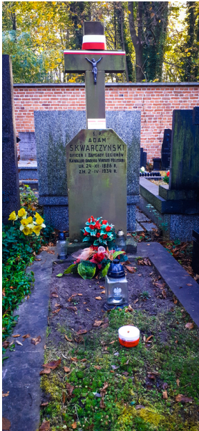
"Zapal znicz na grobie Weterana" 2022

szczególnym okresie, na groby Weteranów tych, którzy część swojego życia poświęcili walce o niepodległość Ojczyzny.