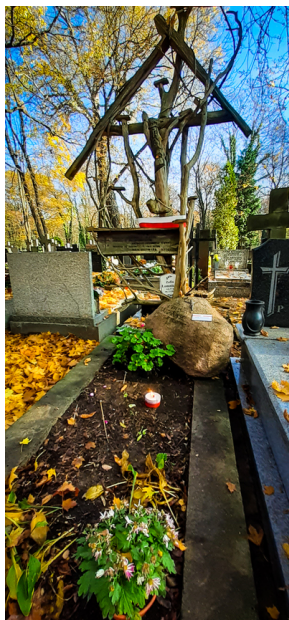
"Zapał znicz na grobie Weterana" 2022