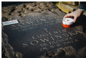
"Zapal znicz na grobie Weterana" 2022