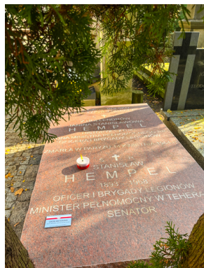
"Zapał znicz na grobie Weterana" 2022