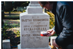
"Zapal znicz na grobie Weterana" 2022