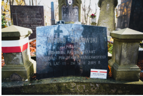
"Zapal znicz na grobie Weterana" 2022