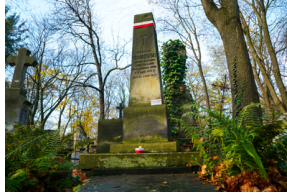
"Zapal znicz na grobie Weterana" 2022