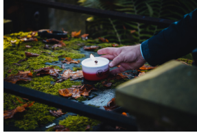
"Zapal znicz na grobie Weterana" 2022