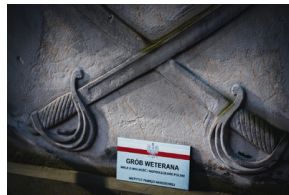
"Zapal znicz na grobie Weterana" 2022