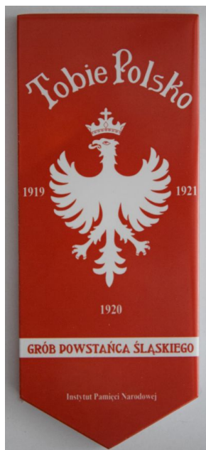
Znak pamięci Tobie Polsko