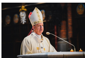
Upamiętniliśmy Ofiary zbrodni totalitarnych