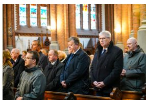
Upamiętniliśmy Ofiary zbrodni totalitarnych reżimów