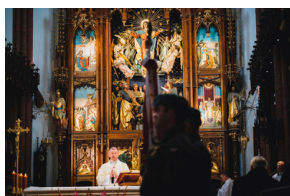
Upamiętniliśmy Ofiary zbrodni totalitarnych reżimów