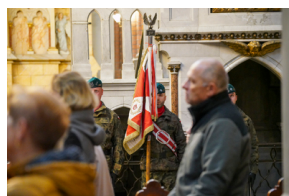
Upamiętniliśmy Ofiary zbrodni totalitarnych reżimów