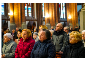
Upamiętniliśmy Ofiary zbrodni totalitarnych