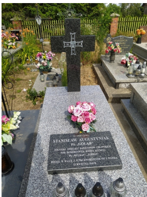
Ostrówek-Kolonia, gm. Ostrówek pow. lubartowski, grób wojenny po remoncie

Prace zostały sfinansowane z budżetu OBUWiM IPN w Lublinie.