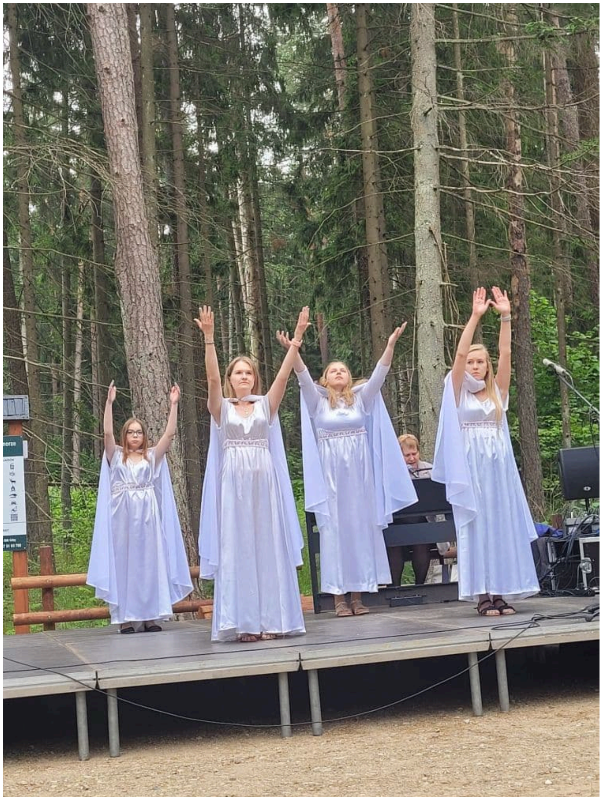
Obchody 77. rocznicy Obławy Augustowskiej - Giby, 9 i 10 lipca 2022