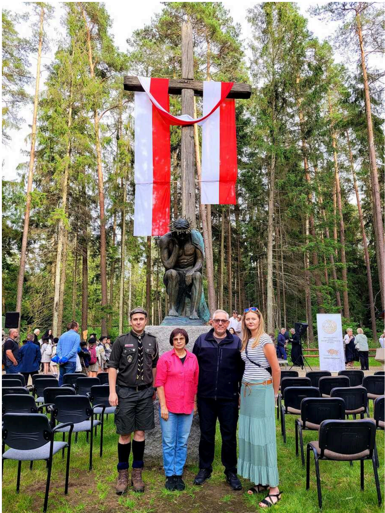
Obchody 77. rocznicy Obławy Augustowskiej - Giby, 9 i 10 lipca 2022