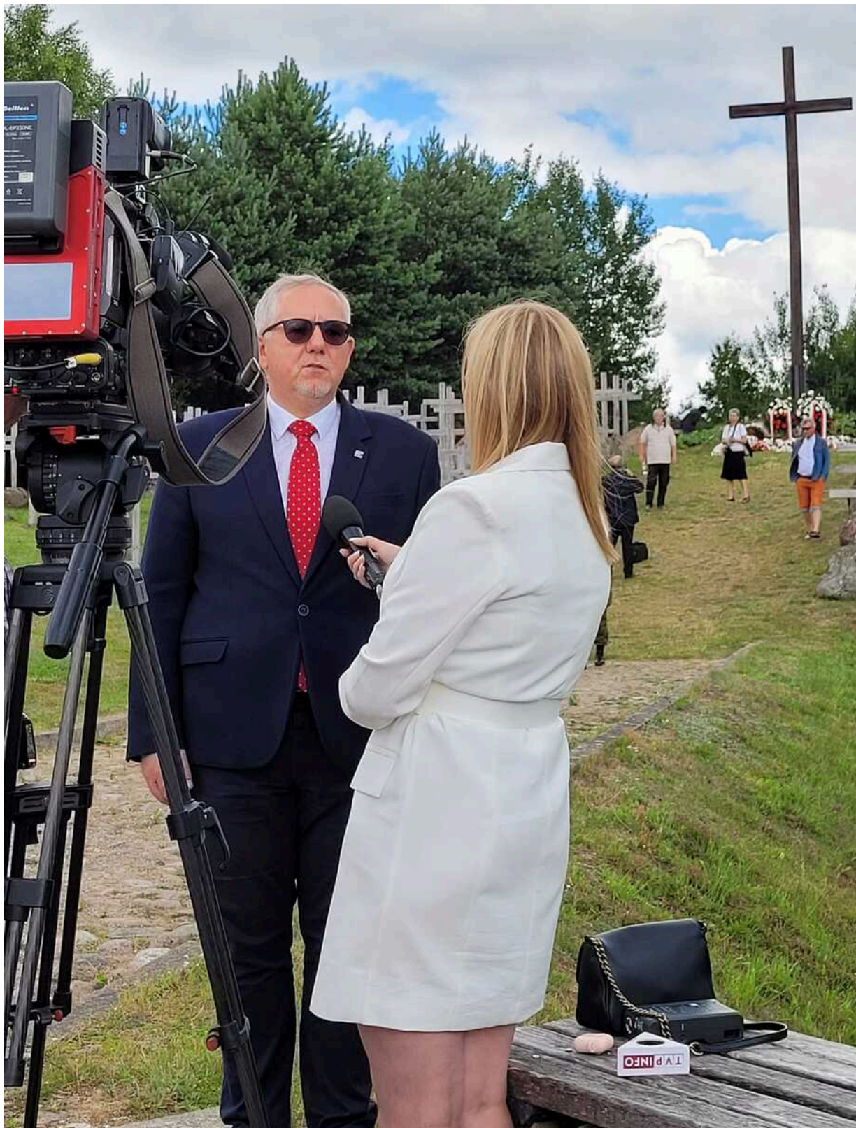
Obchody 77. rocznicy Obławy Augustowskiej - Giby, 9 i 10 lipca 2022