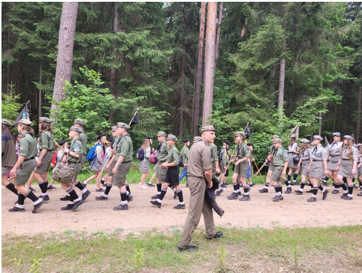
Obchody 77. rocznicy Obławy Augustowskiej - Giby, 9 i 10 lipca 2022