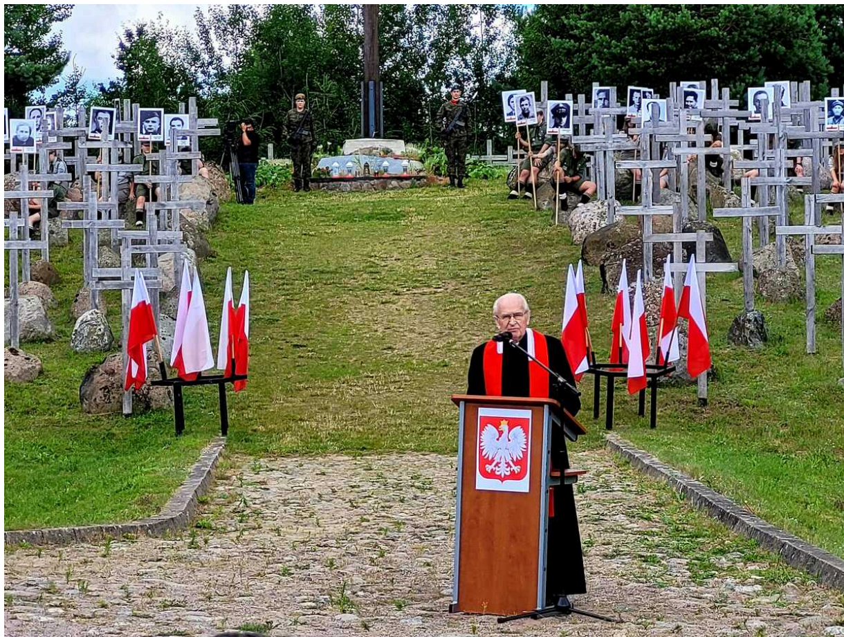
Obchody 77. rocznicy Obławy Augustowskiej - Giby, 9 i 10 lipca 2022

Na dzisiejszych uroczystościach obecny był premier Polski Mateusz Morawiecki, W swoim przemówieniu podkreślał tragizm tamtych wydarzeń i potrzebę odnalezienia grobów ofiar: "Ten mord jest niezagojoną polską raną, która woła o wyjaśnienie. Komunistyczni zbrodniarze chcieli zamordować naszych bohaterów dwa razy - po pierwsze pozbawiając ich życia, po drugie - pozbawiając pamięci o nich".