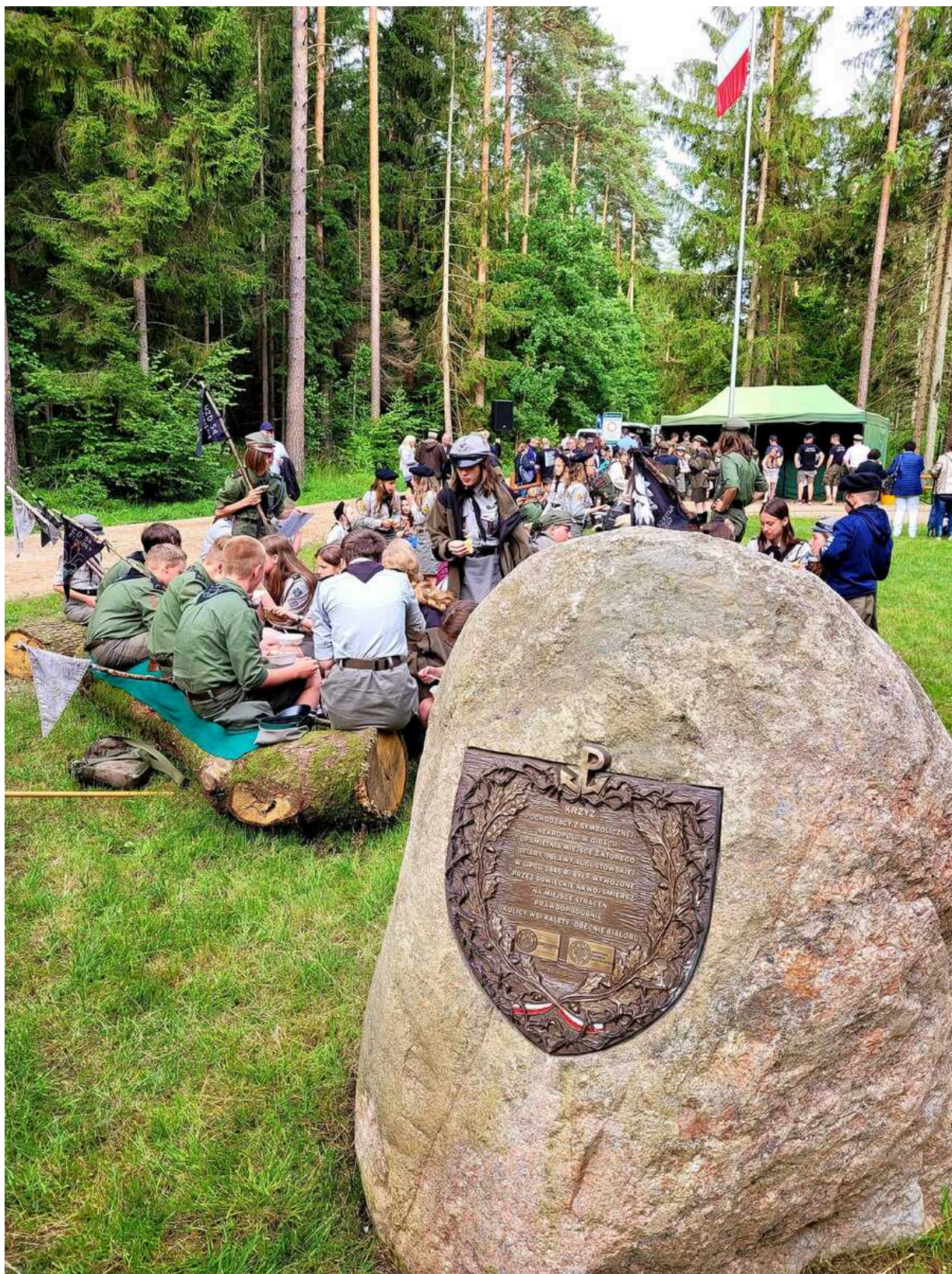
Obchody 77. rocznicy Obławy Augustowskiej - Giby, 9 i 10 lipca 2022