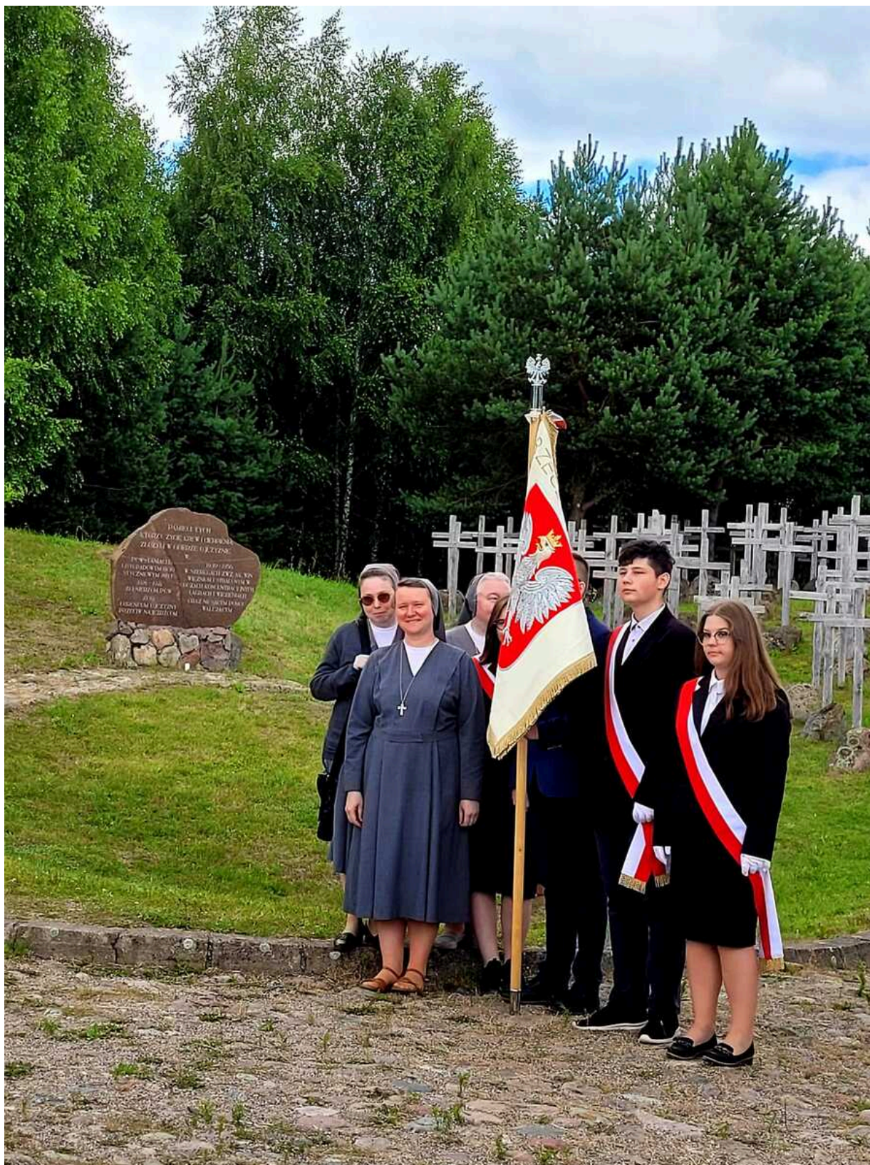
Obchody 77. rocznicy Obławy Augustowskiej - Giby, 9 i 10 lipca 2022