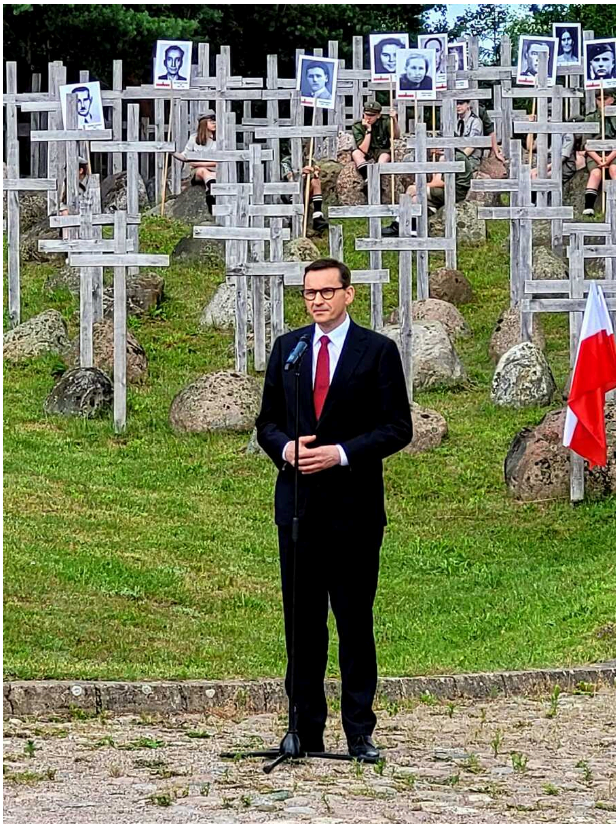
Obchody 77. rocznicy Obławy Augustowskiej - Giby, 9 i 10 lipca 2022