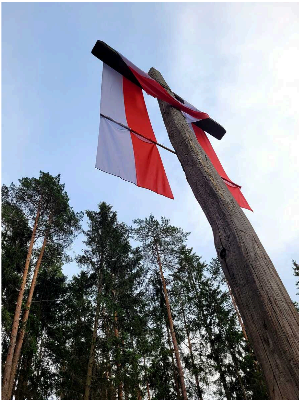
Obchody 77. rocznicy Obławy Augustowskiej - Giby, 9 i 10 lipca 2022