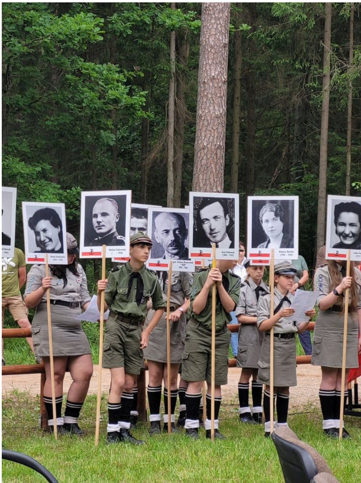
Obchody 77. rocznicy Obławy Augustowskiej - Giby, 9 i 10 lipca 2022