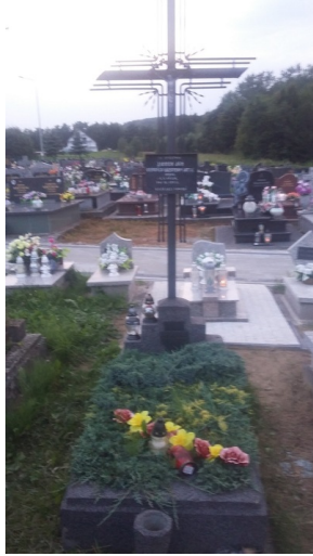
Grób sierż. Jana Ziomka przed remontem