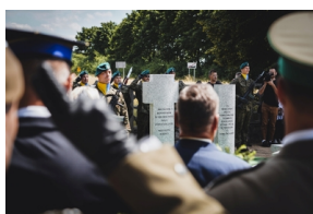
Ceremonia pogrzebowa Powstańców Śląskich