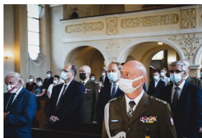
Ceremonia pogrzebowa Powstańców Śląskich