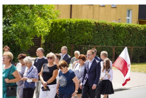
Ceremonia pogrzebowa Powstańców Śląskich