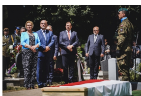
Ceremonia pogrzebowa Powstańców Śląskich