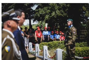
Ceremonia pogrzebowa Powstańców Śląskich