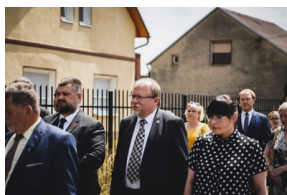
Ceremonia pogrzebowa Powstańców Śląskich