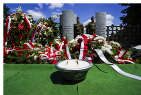
Ceremonia pogrzebowa Powstańców Śląskich – fot. MN/BUWiM