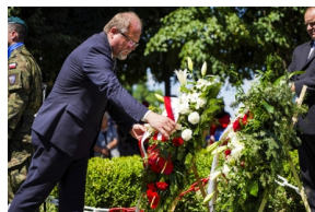
Ceremonia pogrzebowa Powstańców Śląskich – fot. MN/BUWiM