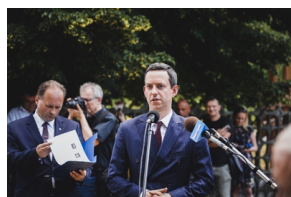
Ceremonia pogrzebowa Powstańców Śląskich