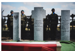
Ceremonia pogrzebowa Powstańców Śląskich