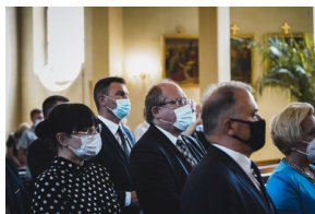
Ceremonia pogrzebowa Powstańców Śląskich