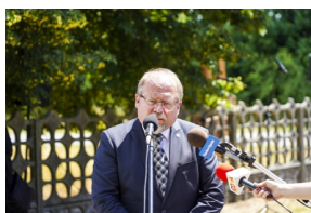
Ceremonia pogrzebowa Powstańców Śląskich