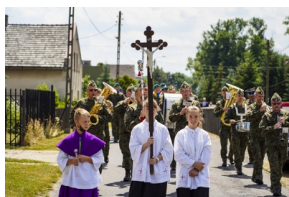
Ceremonia pogrzebowa Powstańców Śląskich