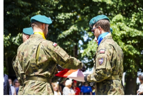
Ceremonia pogrzebowa Powstańców Śląskich