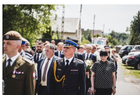
Ceremonia pogrzebowa Powstańców Śląskich