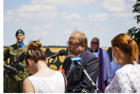
Ceremonia pogrzebowa Powstańców Śląskich