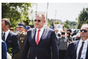
Ceremonia pogrzebowa Powstańców Śląskich