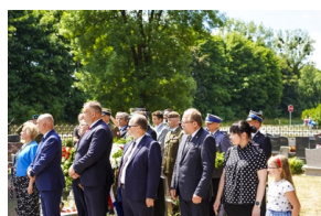
Ceremonia pogrzebowa Powstańców Śląskich