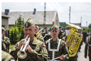
Ceremonia pogrzebowa Powstańców Śląskich

Po mszy pięć trumien ze szczątkami poległych Powstańców, nakrytych flagą państwową, w asyście wojskowej oraz przy wtórze bicia kościelnych dzwonów, wyprowadzono z świątyni. Następnie uczestnicy uroczystości udali się do miejscowości Kalinów (gm. Strzelce Opolskie), gdzie przy kościele pw. Narodzenia NMP utworzono kondukt pogrzebowy prowadzony przez kompanię oraz orkiestrę Wojska Polskiego.