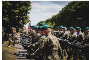
Ceremonia pogrzebowa Powstańców Śląskich