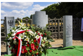
Ceremonia pogrzebowa Powstańców Śląskich

Uroczystość zakończyło złożenie kwiatów i zapalenie zniczy.