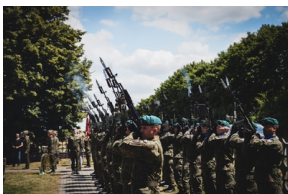
Ceremonia pogrzebowa Powstańców Śląskich