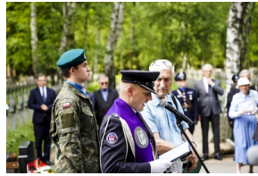
Odsłonięcie i poświęcenie Symbolicznej Mogiły Sybirackiej - Warszawa, 23 czerwca 2021.