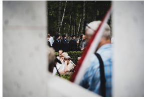
Odsłonięcie i poświęcenie Symbolicznej Mogiły Sybirackiej - Warszawa, 23 czerwca 2021.