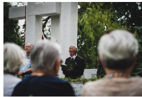
Odsłonięcie i poświęcenie Symbolicznej Mogiły Sybirackiej - Warszawa, 23 czerwca 2021.