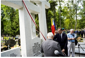
Odsłonięcie i poświęcenie Symbolicznej Mogiły Sybirackiej - Warszawa, 23 czerwca 2021.