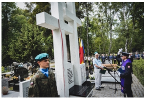
Odsłonięcie i poświęcenie Symbolicznej Mogiły Sybirackiej - Warszawa, 23 czerwca 2021.