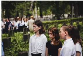
Odsłonięcie i poświęcenie Symbolicznej Mogiły Sybirackiej - Warszawa, 23 czerwca 2021.