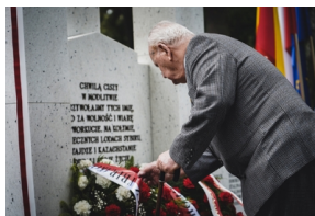
Odsłonięcie i poświęcenie Symbolicznej Mogiły Sybirackiej - Warszawa, 23 czerwca 2021.