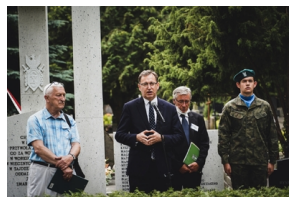
Odsłonięcie i poświęcenie Symbolicznej Mogiły Sybirackiej - Warszawa, 23 czerwca 2021.