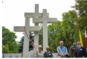
Odsłonięcie i poświęcenie Symbolicznej Mogiły Sybirackiej - Warszawa, 23 czerwca 2021.