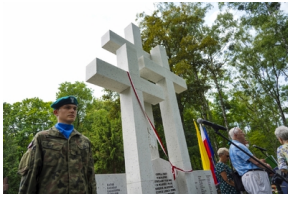
Odsłonięcie i poświęcenie Symbolicznej Mogiły Sybirackiej - Warszawa, 23 czerwca 2021.