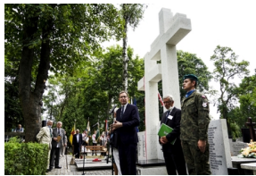
Odsłonięcie i poświęcenie Symbolicznej Mogiły Sybirackiej - Warszawa, 23 czerwca 2021.