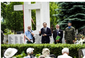
Odsłonięcie i poświęcenie Symbolicznej Mogiły Sybirackiej - Warszawa, 23 czerwca 2021.