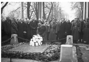
Odsłonięcie tablicy pamiątkowej w Ogrodzie Saskim w Warszawie, upamiętniającej miejsce, w którym przemawiał marszałek Józef Piłsudski

12 listopada 1938 r. gen. broni Kazimierza Sosnkowskiego w obecności prezydenta Warszawy Stefana Starzyńskiego odsłonił tablicę upamiętniającą ten dzień.