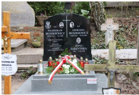
Złożenie kwiatów na odnowionym przez IPN grobie Władysława Buszkiewicza i jego rodziny #7