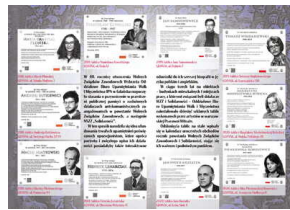
Folder OBUWiM IPN Gdańsk prezentujący tablice działaczy WZZ