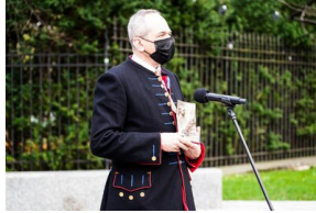
148. rocznica urodzin Wojciecha Korfańtego – Warszawa, 20 kwietnia 2021