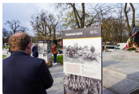
148. rocznica urodzin Wojciecha Korfańtego – Warszawa, 20 kwietnia 2021

Na zakończenie uroczystości dyrektorzy w imieniu prezesa IPN oddali hołd wybitnemu Polakowi, składając wieniec przed warszawskim pomnikiem.