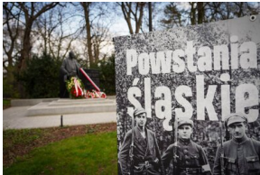
148. rocznica urodzin Wojciecha Korfańtego – Warszawa, 20 kwietnia 2021