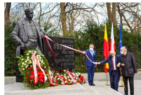
148. rocznica urodzin Wojciecha Korfanteo – Warszawa, 20 kwietnia 2021

Następnie została wręczona Nagroda Związku Górnośląskiego im. Wojciecha Korfanteo, w tym roku laureatem zostało Miasto stołeczne Warszawa. Statuetkę w imieniu prezydenta m.st. Warszawy odebrał Michał Olszewski - zastępca prezydenta.