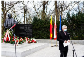
148. rocznica urodzin Wojciecha Korfańtego – Warszawa, 20 kwietnia 2021