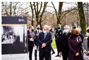
148. rocznica urodzin Wojciecha Korfańtego – Warszawa, 20 kwietnia 2021