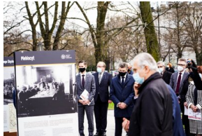
148. rocznica urodzin Wojciecha Korfańtego – Warszawa, 20 kwietnia 2021