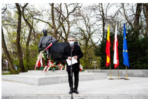
148. rocznica urodzin Wojciecha Korfańtego – Warszawa, 20 kwietnia 2021