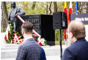
148. rocznica urodzin Wojciecha Korfanteo – Warszawa, 20 kwietnia 2021