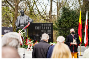
148. rocznica urodzin Wojciecha Korfańtego – Warszawa, 20 kwietnia 2021