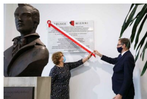
Odsłonięcie tablicy upamiętniającej antykomunistyczną organizację młodzieżową „Wolna Młodzież” w Pruszkowie - 1 marca 2021.