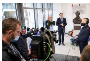
Odsłonięcie tablicy upamiętniającej antykomunistyczną organizację młodzieżową „Wolna Młodzież” w Pruszkowie - 1 marca 2021.