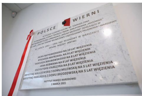
Tablica upamiętniająca antykomunistyczną organizację młodzieżową „Wolna Młodzież” w Pruszkowie.