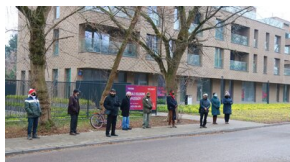
Członowie Warszawskiego Towarzystwa Cyklistów - upamiętnieni