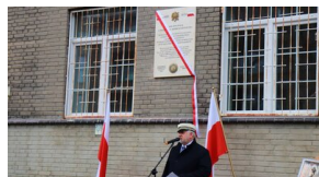
Członowie Warszawskiego Towarzystwa Cyklistów - upamiętnieni