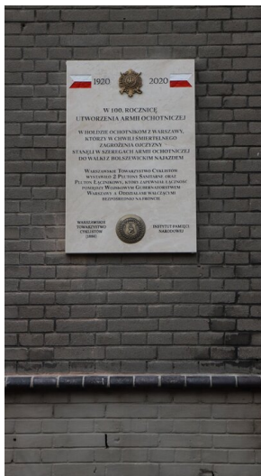
Członowie Warszawskiego Towarzystwa Cyklistów - upamiętnieni

Podczas przemówienia, dyrektor BUWiM zwrócił uwagę na rolę organizacji społecznych w boju o Polskę. Ich rola była nieodzownym elementem walk o niepodległość. Upamiętnienie zostało dofinansowane ze środków Oddziałowego Biura Upamiętniania Walk i Męczeństwa IPN w Warszawie.