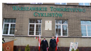
Członowie Warszawskiego Towarzystwa Cyklistów - upamiętnieni