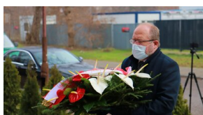
Członowie Warszawskiego Towarzystwa Cyklistów - upamiętnieni

Podczas przemówienia, dyrektor BUWiM zwrócił uwagę na rolę organizacji społecznych w boju o Polskę. Ich rola była nieodzownym elementem walk o niepodległość. Upamiętnienie zostało dofinansowane ze środków Oddziałowego Biura Upamiętniania Walk i Męczeństwa IPN w Warszawie.