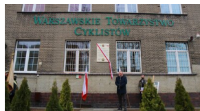
Członowie Warszawskiego Towarzystwa Cyklistów - upamiętnieni