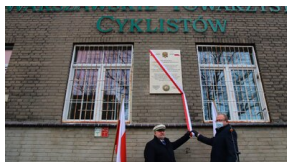
Członowie Warszawskiego Towarzystwa Cyklistów - upamiętnieni