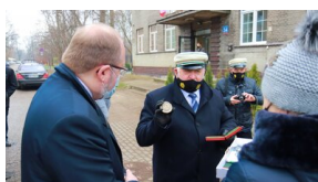
Członowie Warszawskiego Towarzystwa Cyklistów - upamiętnieni