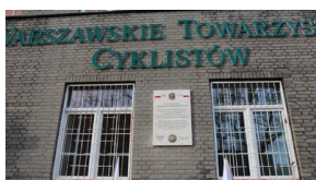
Członowie Warszawskiego Towarzystwa Cyklistów - upamiętnieni