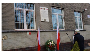
Członowie Warszawskiego Towarzystwa Cyklistów - upamiętnieni