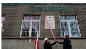
Członowie Warszawskiego Towarzystwa Cyklistów - upamiętnieni