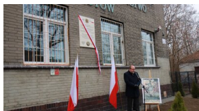
Członowie Warszawskiego Towarzystwa Cyklistów - upamiętnieni