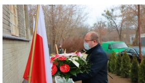
Członowie Warszawskiego Towarzystwa Cyklistów - upamiętnieni