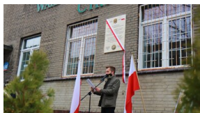
Członowie Warszawskiego Towarzystwa Cyklistów - upamiętnieni