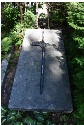
Grób Feliksa Ciechomskiego przed

Feliks Ciechomski pochowany jest w kwaterze 20A, rząd 7 grób nr 4.