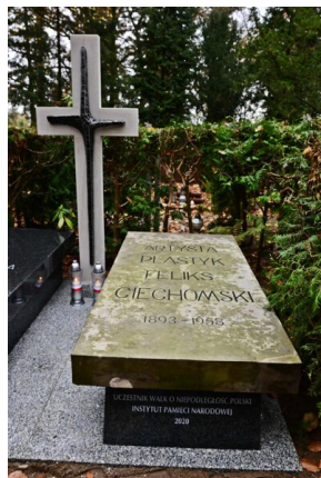
Grób Feliksa Ciechomskiego po