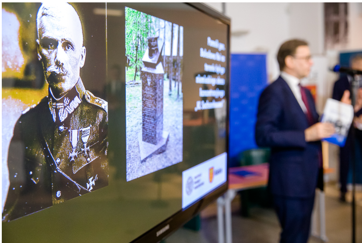
Konferencja prasowa dotycząca upamiętnienia gen. Bolesława Roja na terenie byłego niemieckiego obozu koncentracyjnego KL Sachsenhausen – Warszawa, 27 maja 2020.