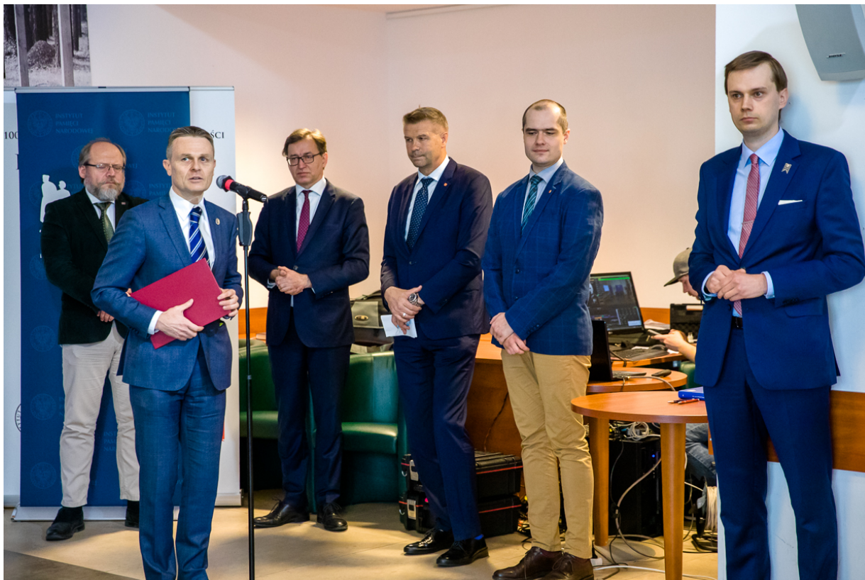
Konferencja prasowa dotycząca upamiętnienia gen. Bolesława Roi na terenie byłego niemieckiego obozu koncentracyjnego KL Sachsenhausen - Warszawa, 27 maja 2020.