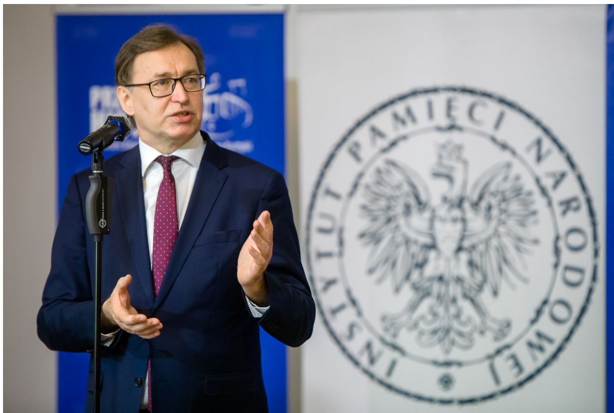
Spotykamy się w 80. rocznicę śmierci gen. Roi, by pokazać Państwu kolejne upamiętnienie zrealizowane przez IPN – mówił podczas konferencji prezes IPN Jarosław Szarek – Warszawa, 27 maja 2020.