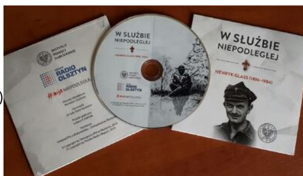
CD: W służbie Niepodległej. Henryk Glass (1896–1984)