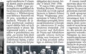
W tym czasie w Szczecinie znajdowało się około 10 tysięcy Niemców. Władzę w mieście objął sowiecki komendant wojenny ppłk Aleksander Fiedosin.