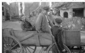
W tym czasie w Szczecinie znajdowało się około 10 tysięcy Niemców. Władzę w mieście objął sowiecki komendant wojenny ppłk Aleksander Fiedosin.