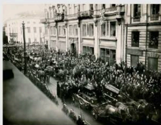
A Warszawa, 19 października 1923 r. Pogrom 28 ofiar wybuchu prochowni w Cytadeli warszawskiej, do którego doszło 13 października w wyniku zamachu KPP. Fot. W. W.

Zobacz: Złoty Północ , s. 104-105, A. Sarczak, Warszawa 1988