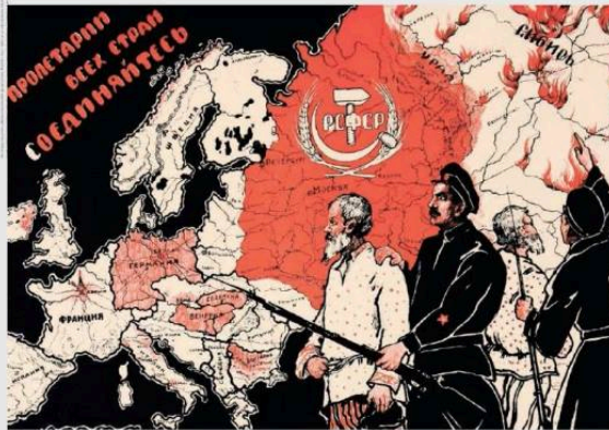
A. Plakat bolszewicki z 1919 r. „Próletariatze wszystkich krajów łączycie się!”

Pomimo obowiązywania do 1926 r. tzw. Nowej Polityki Ekonomicznej, dopuszczającej w skróconym zakresie elementy gospodarki rynkowej, a także pewnego pluralizmu w kulturze, ZSRR stał się państwem totalitarnym. Decydujący krok w tym kierunku nastąpił w 1924 r., gdy po śmierci Lenina z walki o sukcesję po nim zwycięsko wyszedł Józef Stalin. W 1928 r. podjął on decyzję o kolektywizacji rolnictwa i likwidacji klasy chłopów-possiadaczy, czemu towarzyszyły masowe przymusowe wysiedlenia i wywózki do obozów, a konsekwencją stała się kolejna głód w Rosji, Powolziu i Kaukazie. W wyniku tego w latach 1932–1933 zmarło około 7 mln ludzi. Najwięcej ofiar Wielki Głód (głodolomom) pochłonął na Ukrainie – wywołany sztucznie na