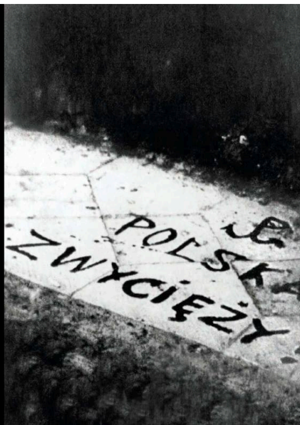
► Warszawa, 1939–1944. Ręko pisane w rannak akcji sabotażowych.

Państwo podziemne formułowało zasady postępowania Polaków pod okupacją, prowadziło wojnę propagandową z okupantem – miały sabaoty. Stworzono także rozbudowaną sieć kolportażu prasy podziemnej, w tym głównego pisma – „Biuletynu Informacyjnego”. Przygotowywano również struktury do przejścia kontroli nad krajem po zakończeniu wojny.