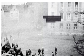
Strona z albumu „Gdański Grudzień '70. Rekonstrukcja - dokumentacja - walka z

Gdański Grudzień '70. Rekonstr ukcja - dokumen tacja - walka z pamięcią