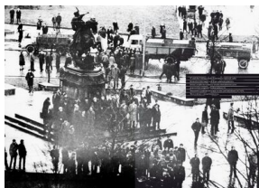
Strona z albumu „Gdański Grudzień '70. Rekonstrukcja - dokumentacja - walka z