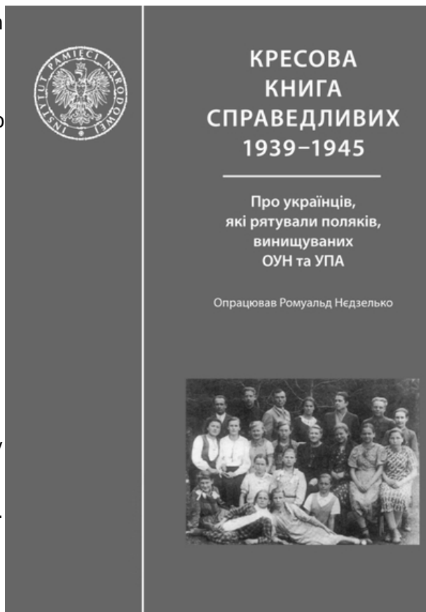
KRESOWA KNIHA SPRAVEDLIVIH 1939-1945

KRESOWA KSIĘGA SPRAWIEDLIWYCH 1939-1945 (epub) (epub, 911.17 KB) 03.11.2022 12:00 KRESOWA KSIĘGA SPRAWIEDLIWYCH 1939-1945 (mobi) (mobi, 811.54 KB) 03.11.2022 12:00 КРЕСОВА КНИГА СПРАВЕДЛИВИХ 1939-1945, ISBN 978-83-7629-465-0 (epub) (epub, 960.02 KB) 03.11.2022 12:00 КРЕСОВА КНИГА СПРАВЕДЛИВИХ 1939-1945, ISBN 978-83-7629-466-7 (mobi) (mobi, 1.01 MB) 03.11.2022 12:00 THE BOOK OF THE RIGHTEOUS OF THE EASTERN BORDERLANDS 1939-1945, ISBN 978-83-7629-462-9 (epub) (epub, 915.66 KB) 03.11.2022 12:00 THE BOOK OF THE RIGHTEOUS OF THE EASTERN BORDERLANDS 1939-1945, ISBN 978-83-7629-463-6 (mobi) (mobi, 800.28 KB) 03.11.2022 12:00