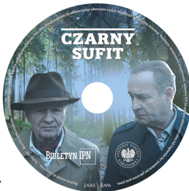
DVD z filmem Czarny sufit