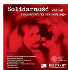
Biuletyn IPN nr 7-8/2020 - płyta CD