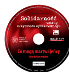
Biuletyn IPN nr 7-8/2020 - płyta CD