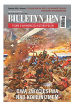
Biuletyn IPN nr 7-8/2020

Dwa wielkie zwycięstwa nad komunizmem są głównym tematem najnowszego „Biuletynu IPN”. Często nie uświadamiamy sobie, że w XX wieku, my Polacy, dwukrotnie przyczyniliśmy się do pokonania komunizmu. Raz w wojnie 1920 r., kiedy za cenę wielu ofiar powstrzymaliśmy nawałę bolszewicką - tym samym ocalając całą Europę. Drugi raz, kiedy w 1980 r. robotnicy polscy metodą non violence , przez strajki przybliżyli koniec komunizmu.