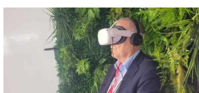
Strefa Nowych Technologii Biura IPN na Podkarpackim Kongresie Pamięci Narodowej 2023.