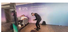
Strefa Nowych Technologii Biura IPN na Podkarpackim Kongresie Pamięci Narodowej 2023.