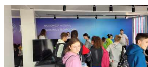
Strefa Nowych Technologii Biura IPN na Podkarpackim Kongresie Pamięci Narodowej 2023.