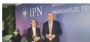
Strefa Nowych Technologii Biura IPN na Podkarpackim Kongresie Pamięci Narodowej 2023.

Dzięki zaangażowaniu Biura Nowych Technologii IPN, historia Polski staje się bardziej dostępna, zrozumiała i fascynująca dla wszystkich pokoleń, w szczególności dla młodzieży. To inwestycja w edukację przyszłości, dzięki której będziemy mogli bez barier i przeszkód czerpać naukę i inspirację z dorobku i doświadczeń przeszłości.