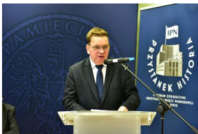
Pierwszy dzień konferencji.