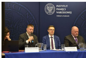
Ostatni dzień konferencji.