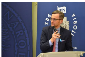
Ostatni dzień konferencji.