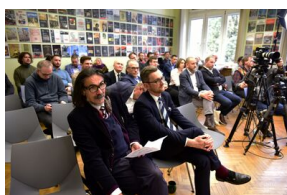
Pierwszy dzień konferencji.