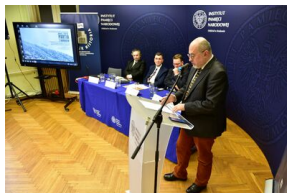
Pierwszy dzień konferencji.