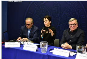
Pierwszy dzień konferencji.