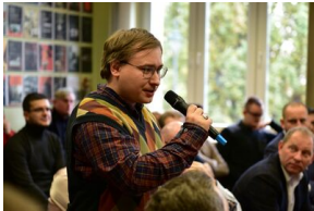
Pierwszy dzień konferencji.