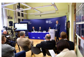
Pierwszy dzień konferencji.