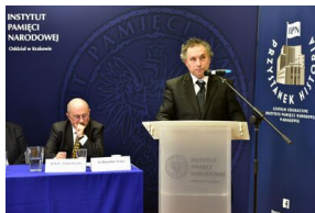
Pierwszy dzień konferencji.