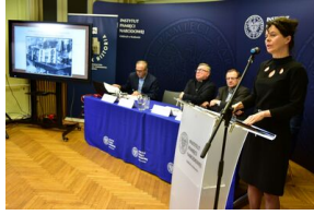
Pierwszy dzień konferencji.