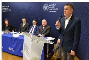
Ostatni dzień konferencji.