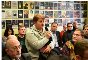
Pierwszy dzień konferencji.