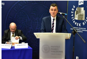
Pierwszy dzień konferencji.