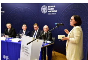
Pierwszy dzień konferencji.