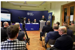
Pierwszy dzień konferencji.