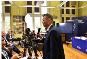
Pierwszy dzień konferencji.