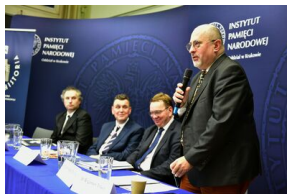
Pierwszy dzień konferencji.