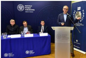
Pierwszy dzień konferencji.