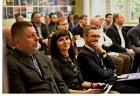
Pierwszy dzień konferencji.