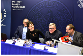
Pierwszy dzień konferencji.