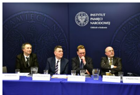
Pierwszy dzień konferencji.