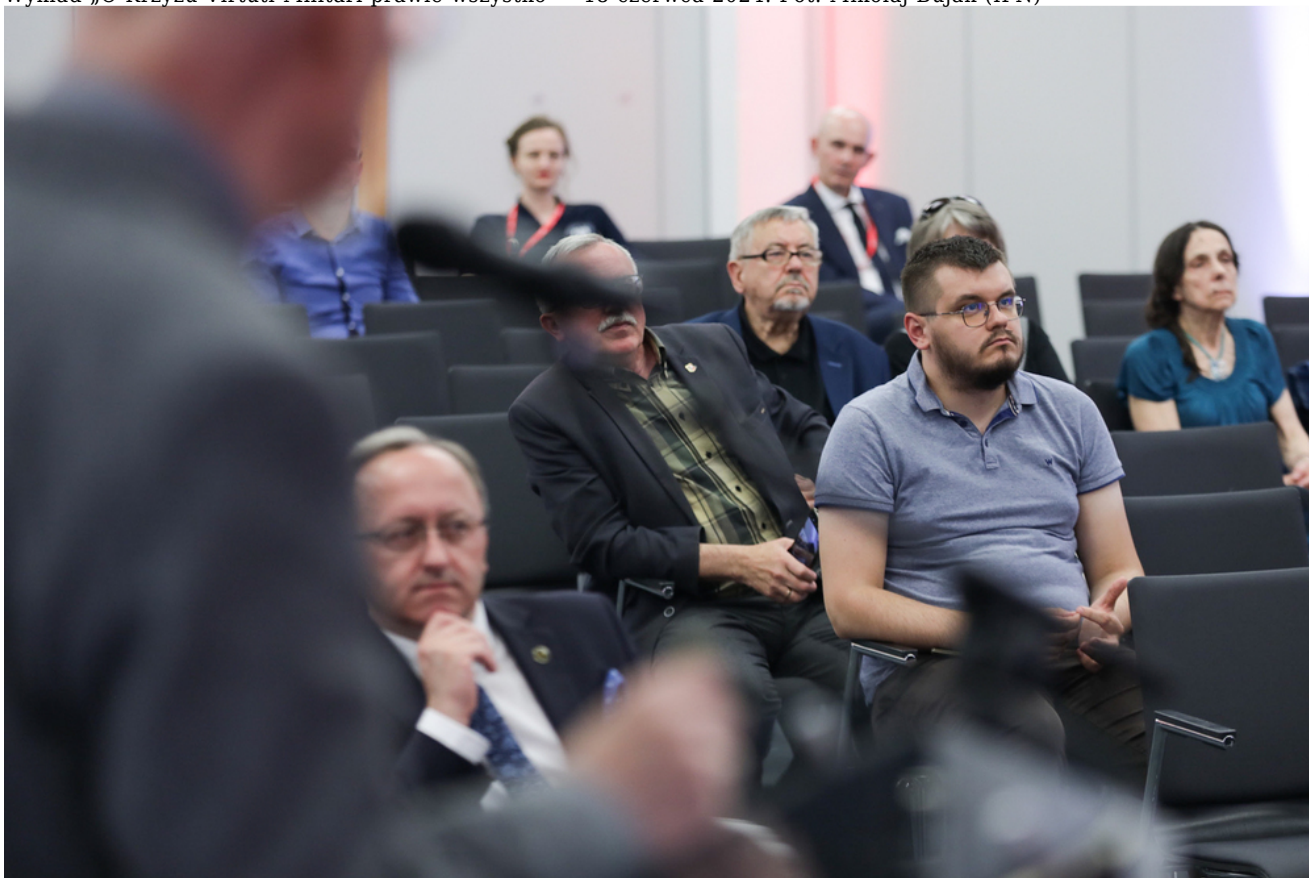
Wykład „O Krzyżu Virtuti Militari prawie wszystko” – 18 czerwca 2024.