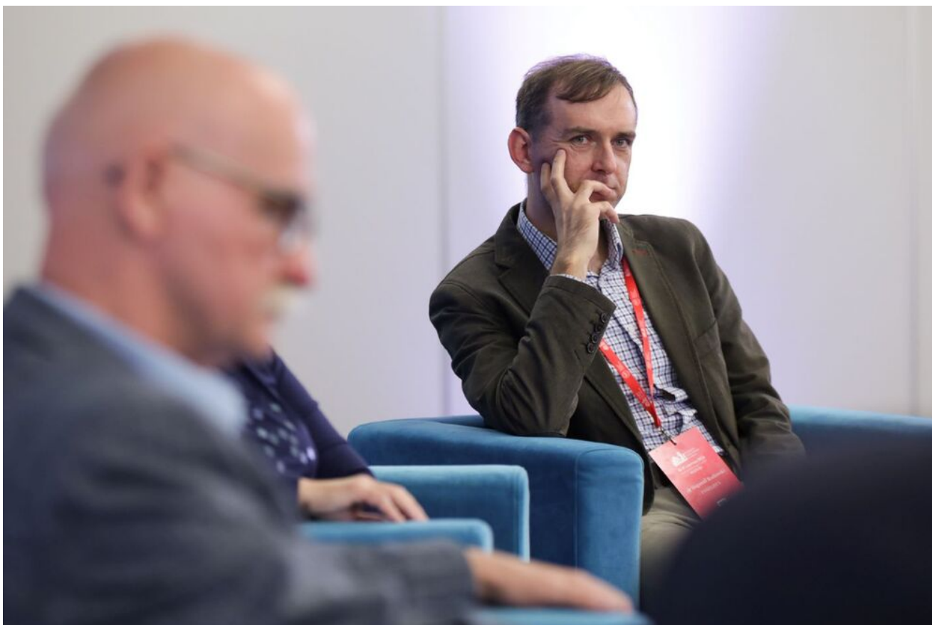
Debata „Mustergau. Okupacja w Kraju Warty” - 18 czerwca 2024.