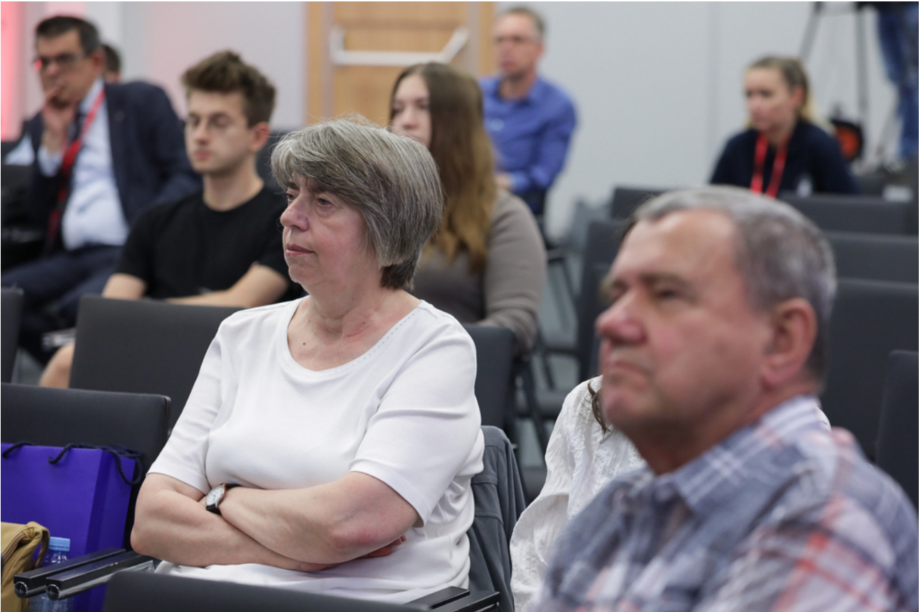
„Niemcy, naziści czy hitlerowcy? Semantyka i fakty” - 19 czerwca 2024.