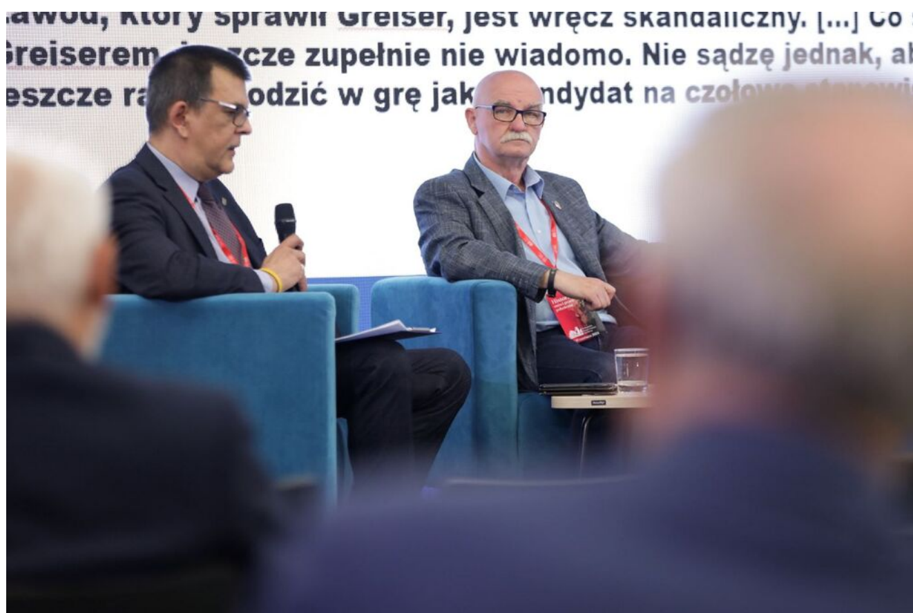
Debata „Mustergau. Okupacja w Kraju Warty” – 18 czerwca 2024.

Na zakończenie uczestnicy panelu, przedstawili swoje opinie na temat stanu badań nad historią „Kraju Warty” a także przedstawili pożądane kierunki badań i postulaty badawcze.