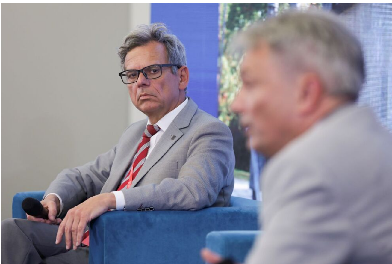
Debata „Wielkopolanie dla odradzającej się Polski” - 18 czerwca 2024.