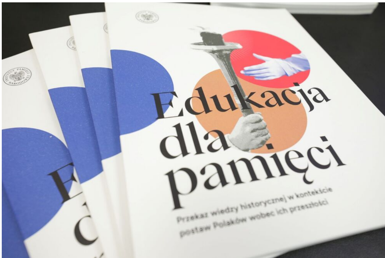
Debata „Edukacja dla pamięci” - 19 czerwca 2024.