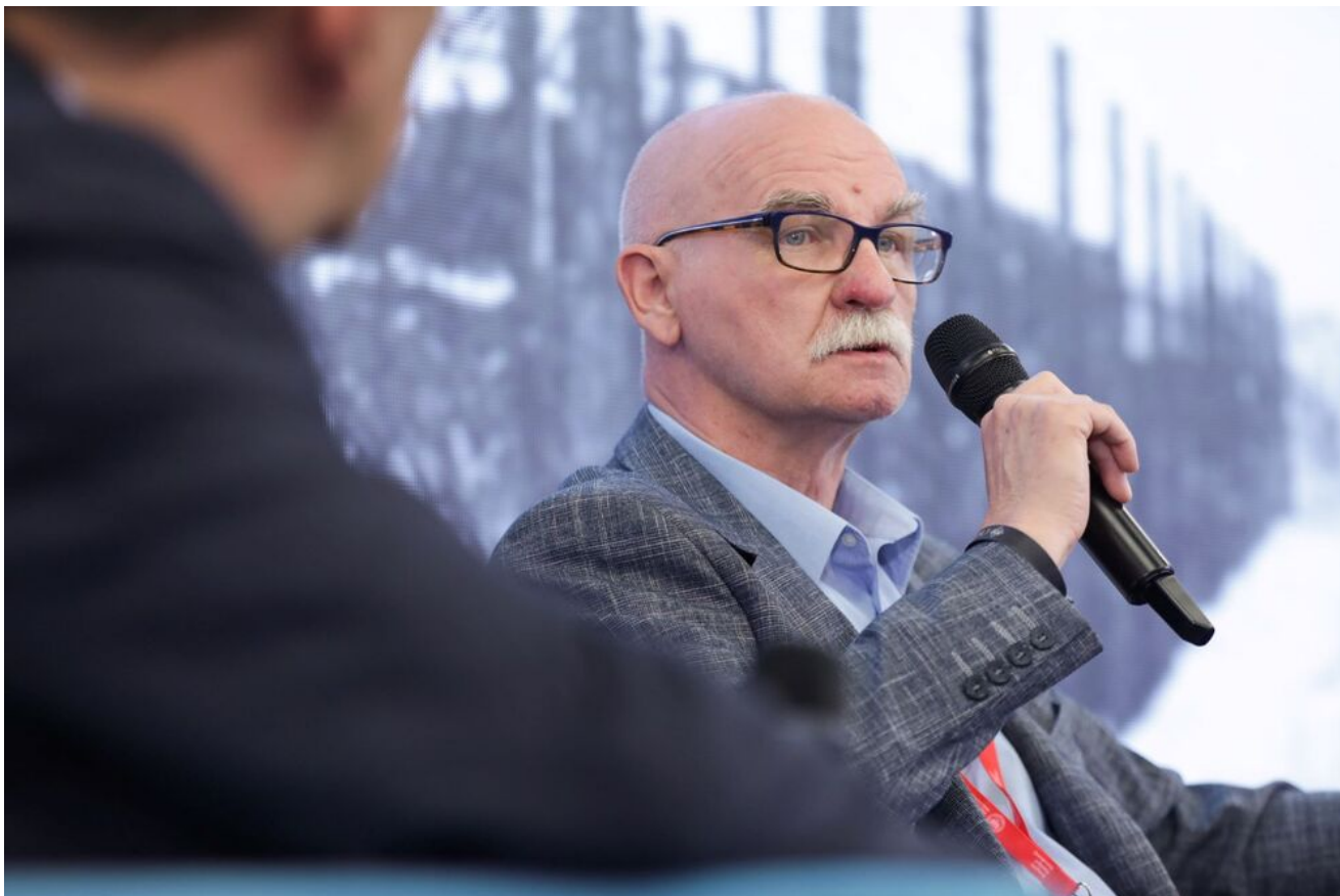
Debata „Mustergau. Okupacja w Kraju Warty” - 18 czerwca 2024.