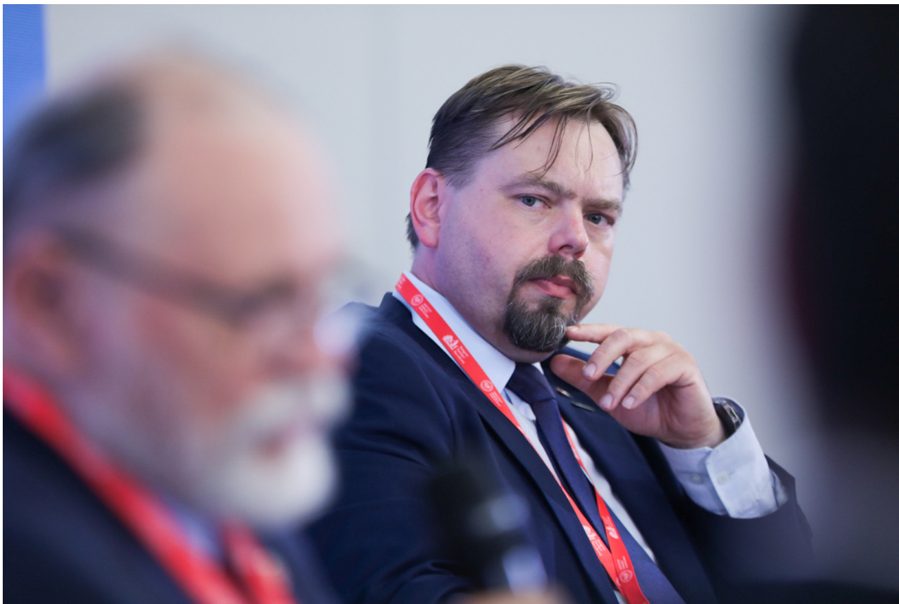
Debata „Wielkopoleanie na frontach II wojny światowej” - 18 czerwca 2024.