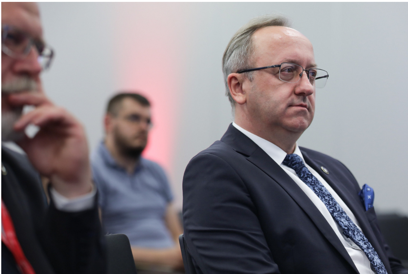
Wykład „O Krzyżu Virtuti Militari prawie wszystko” – 18 czerwca 2024.