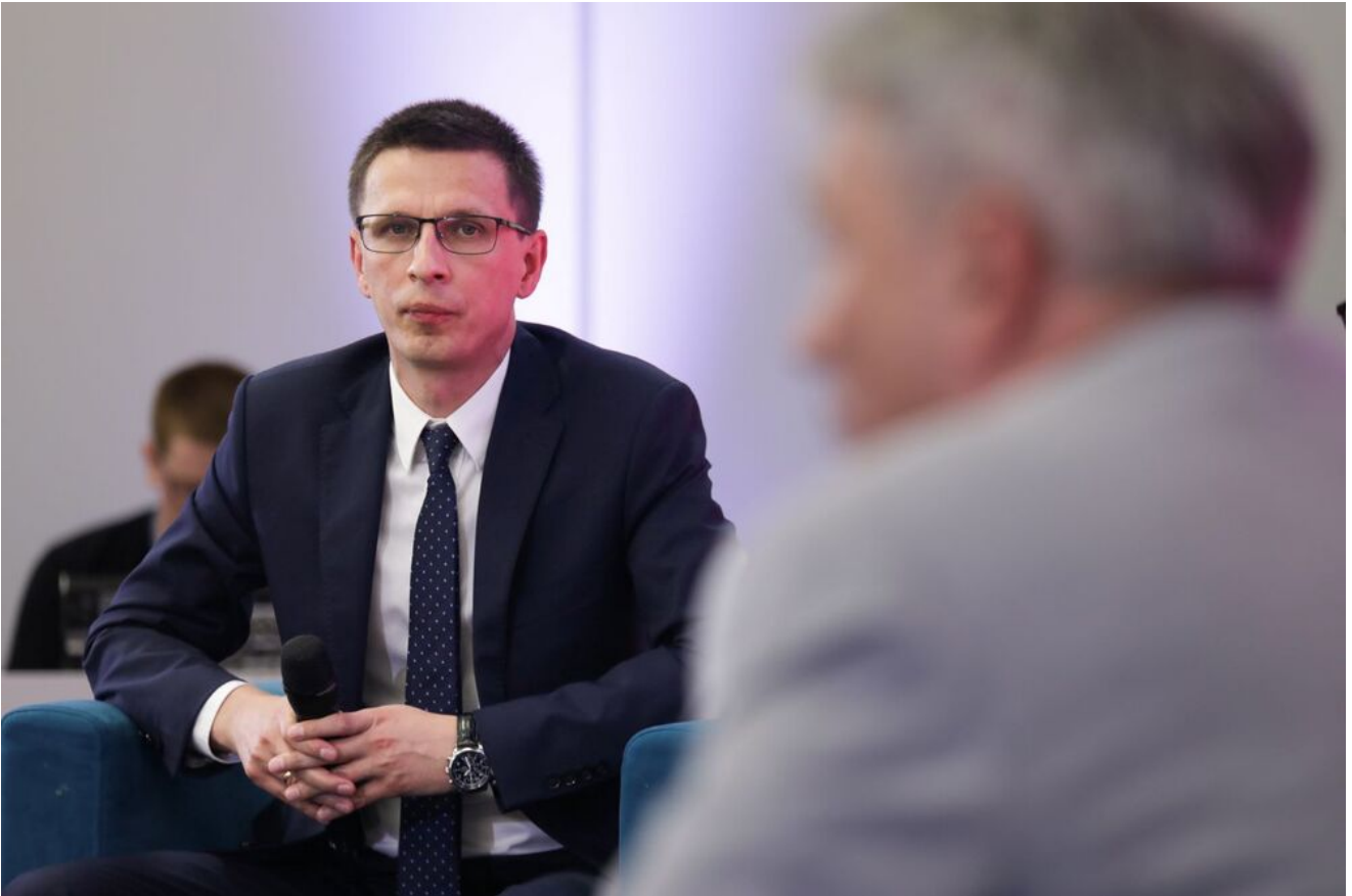
Debata „Wielkopoleanie dla odradzającej się Polski” - 18 czerwca 2024.