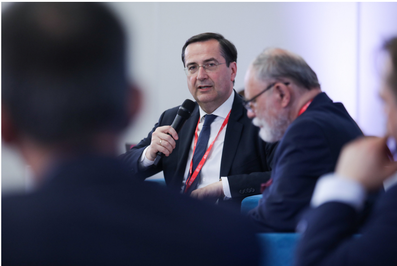
Debata „Wielkopoleanie na frontach II wojny światowej” - 18 czerwca 2024.