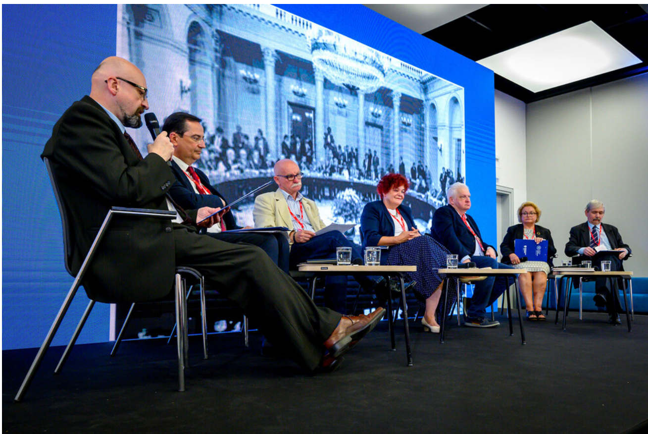
Debata „Czas przełomu 1989 roku w Wielkopolsce i na Ziemi Lubuskiej” - 19 czerwca 2024.