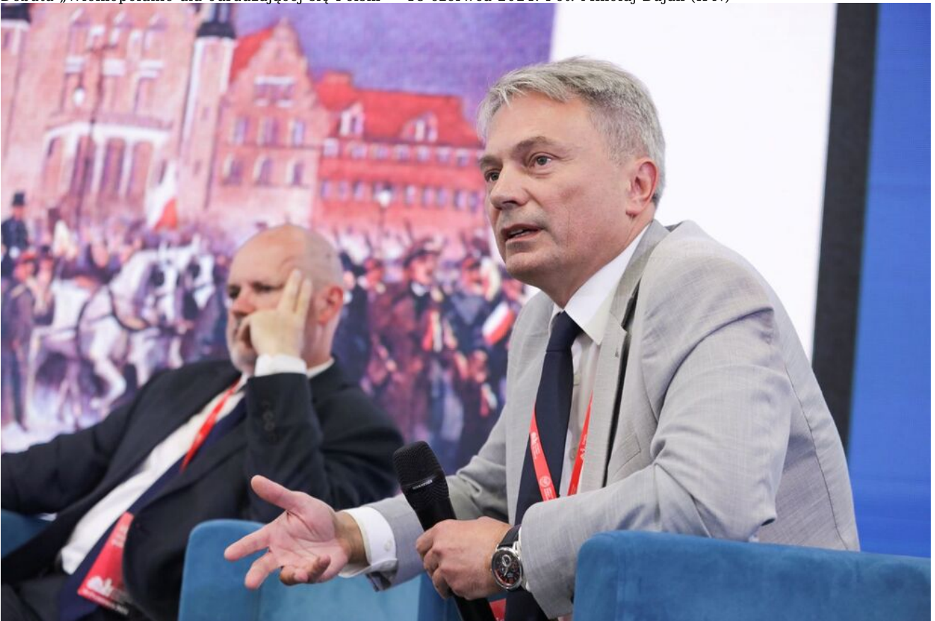
Debata „Wielkopoleanie dla odradzającej się Polski” - 18 czerwca 2024.