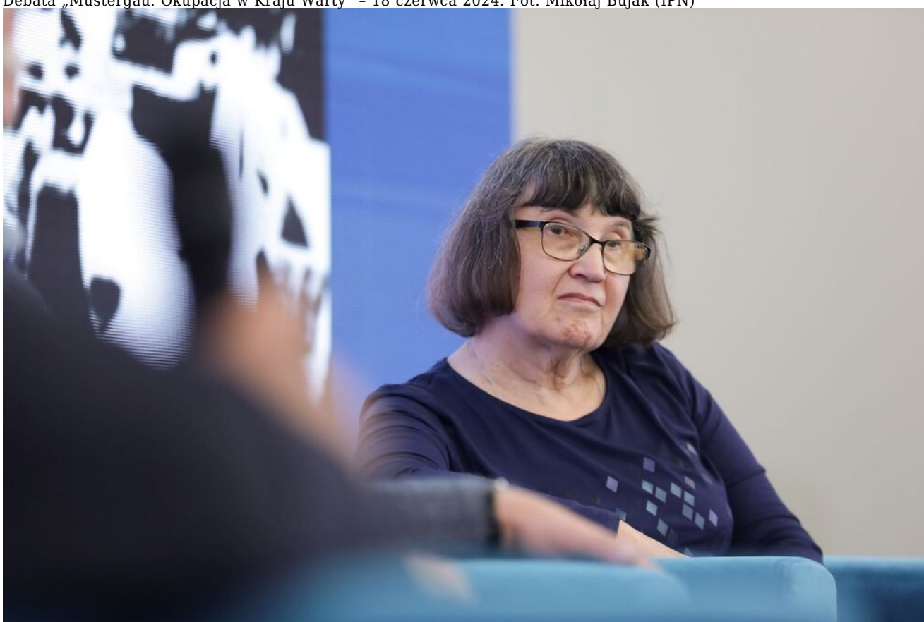
Debata „Mustergau. Okupacja w Kraju Warty” - 18 czerwca 2024.