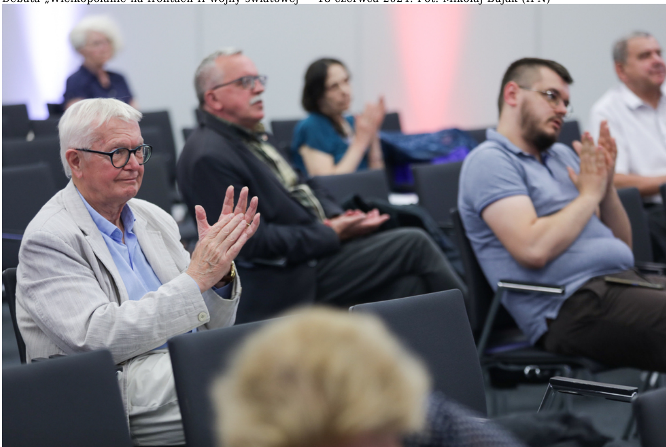
Debata „Wielkopoleanie na frontach II wojny światowej” - 18 czerwca 2024.