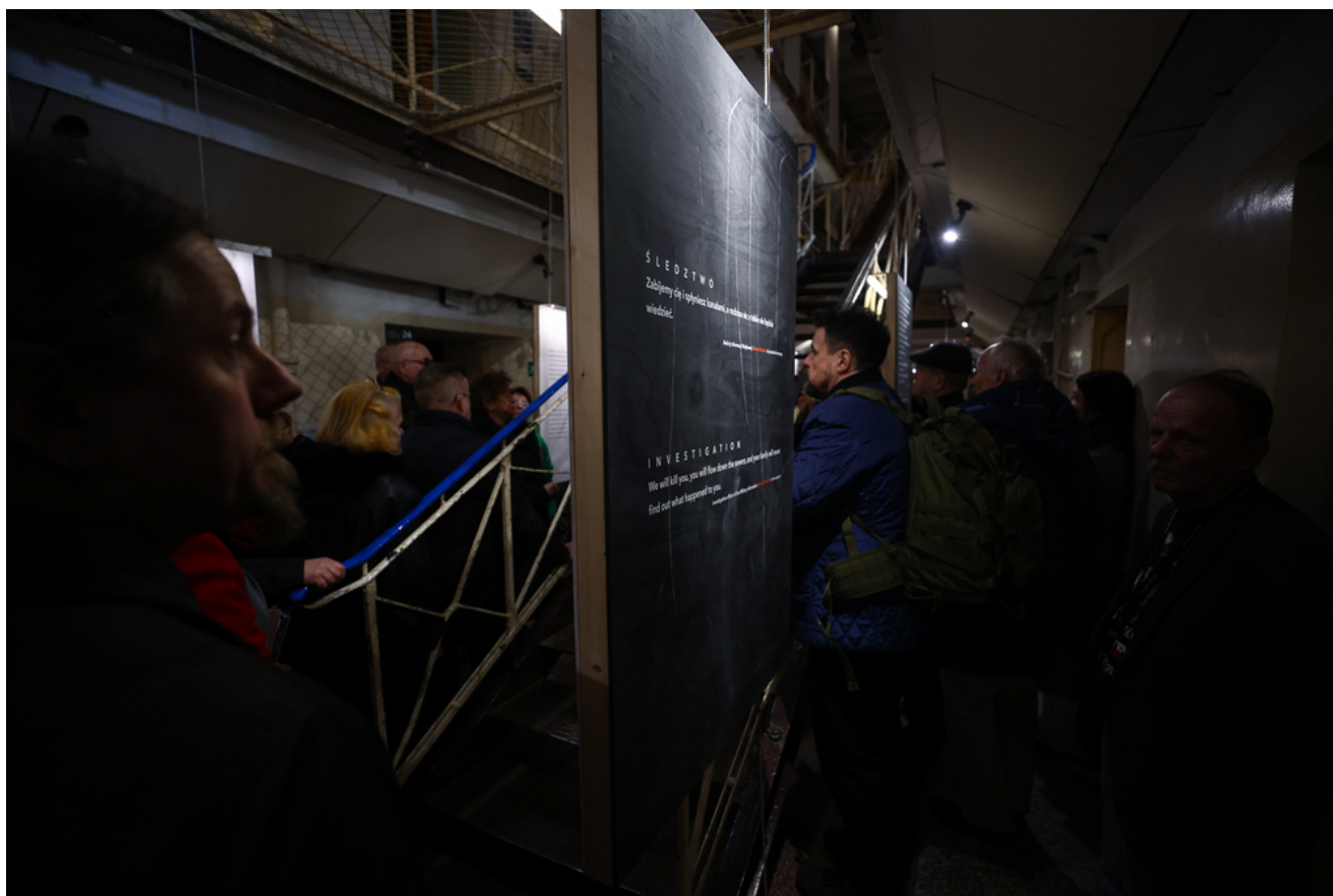
Zwiedzanie muzeum podczas Kongresu Pamięci Żołnierzy Wyklętych – Warszawa 7 marca 2025.

Szczątki Hieronima Dekutowskiego odnalazł zespół kierowany przez profesora Krzysztofa Szwagrzyka, latem 2012 r. w kwaterze „Ł” Cmentarza Wojskowego na Powązkach.