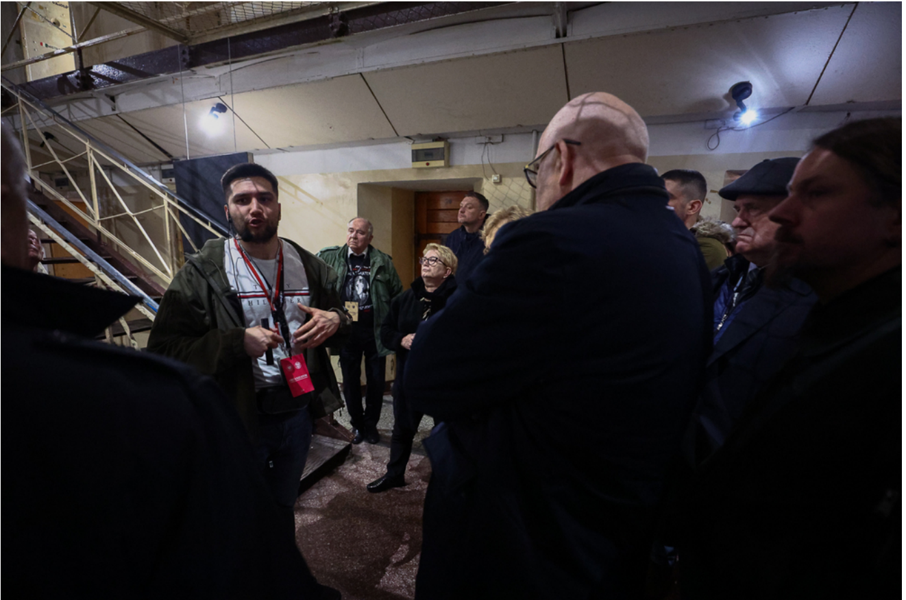
Zwiedzanie muzeum podczas Kongresu Pamięci Żołnierzy Wyklętych - Warszawa 7 marca 2025.