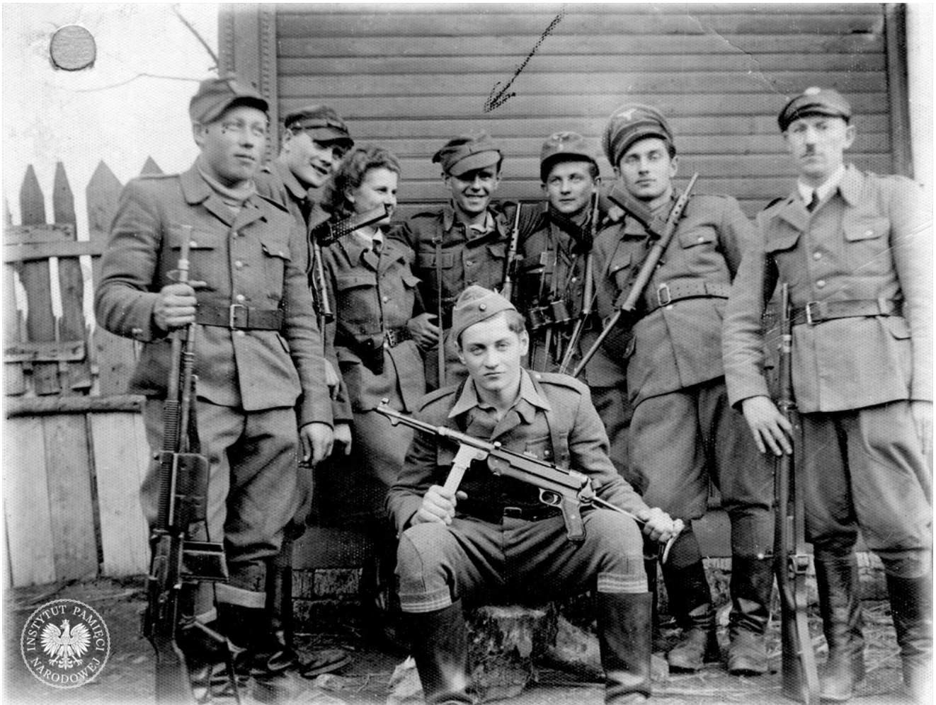
Oddział Hieronima Dekutowskiego „Zapory”.