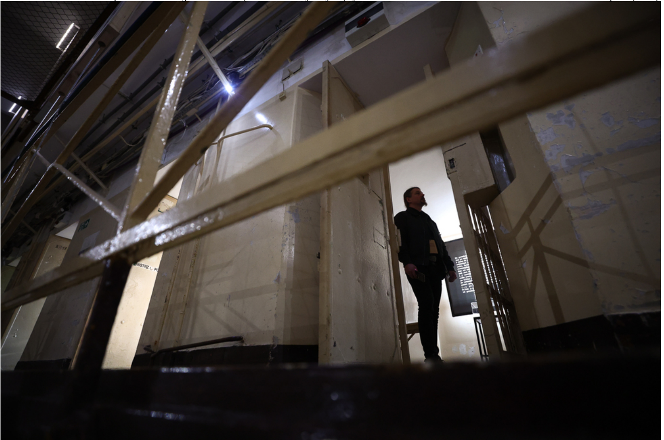
Oddaliśmy hołd mjr. Hieronimowi Dekutowskiemu podczas Kongresu Pamięci Żołnierzy Wyklętych - Warszawa, 7 marca 2025.