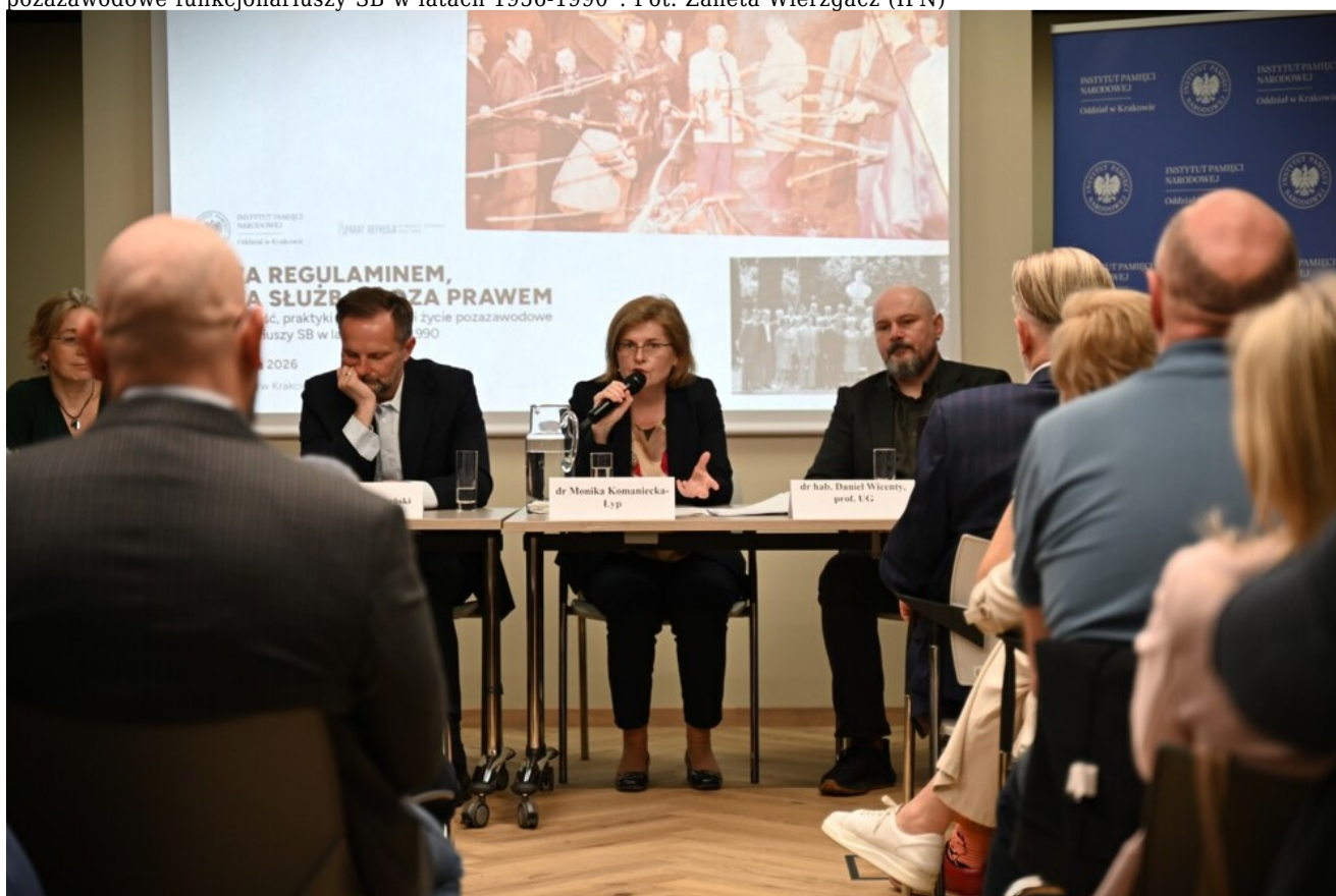
Konferencja naukowa „Poza regulaminem, poza służbą, poza prawem. Codziennosc, praktyki nieformalne i życie pozazawodowe funkcjonariuszy SB w latach 1956-1990”.