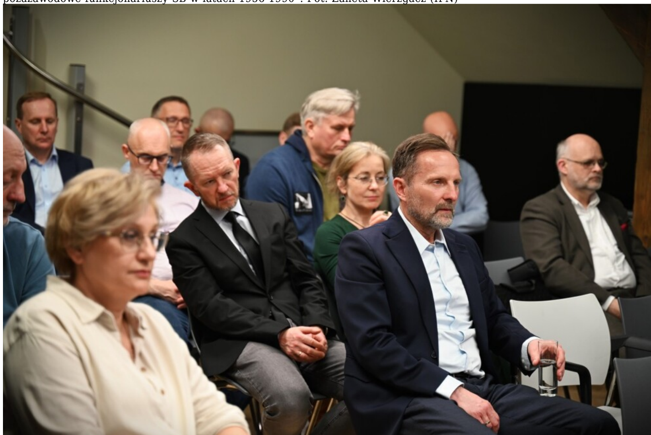
Konferencja naukowa „Poza regulaminem, poza służbą, poza prawem. Codziennosc, praktyki nieformalne i zycie pozazawodowe funkcjonariuszy SB w latach 1956-1990”.