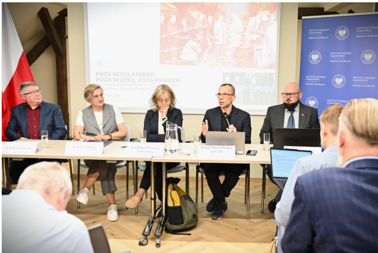
Konferencja naukowa „Poza regulaminem, poza służbą, poza prawem. Codzienność, praktyki nieformalne i życie pozazawodowe funkcjonariuszy SB w latach 1956-1990”.