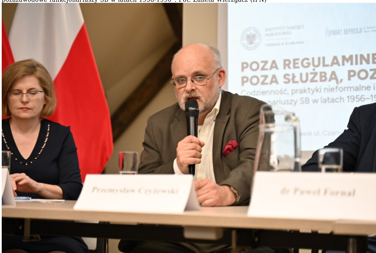
Konferencja naukowa „Poza regulaminem, poza służbą, poza prawem. Codziennosc, praktyki nieformalne i życie pozazawodowe funkcjonariuszy SB w latach 1956-1990”.