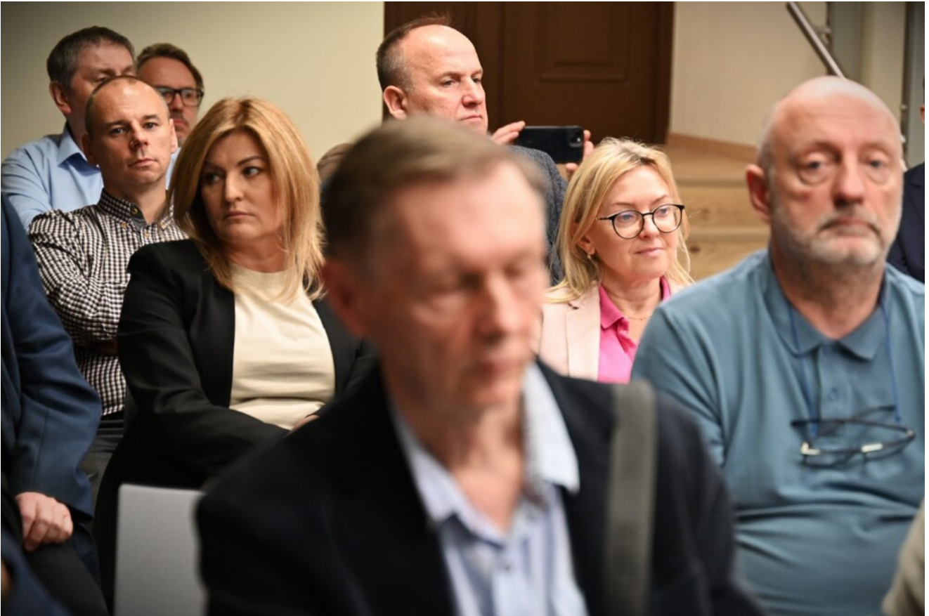
Konferencja naukowa „Poza regulaminem, poza służbą, poza prawem. Codzienność, praktyki nieformalne i życie pozazawodowe funkcjonariuszy SB w latach 1956-1990”.