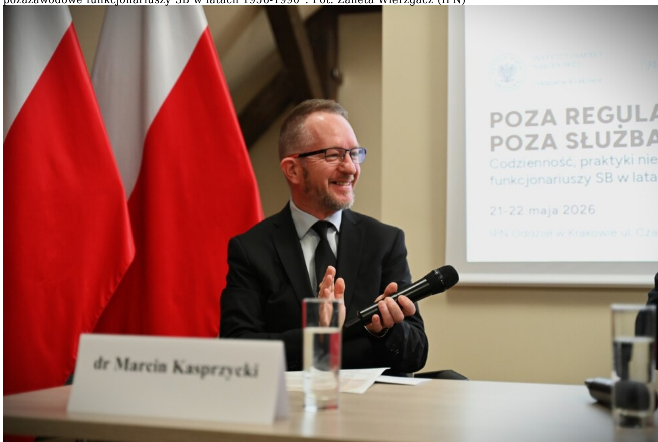
Konferencja naukowa „Poza regulaminem, poza służbą, poza prawem. Codziennosc, praktyki nieformalne i zycie pozazawodowe funkcjonariuszy SB w latach 1956-1990”.