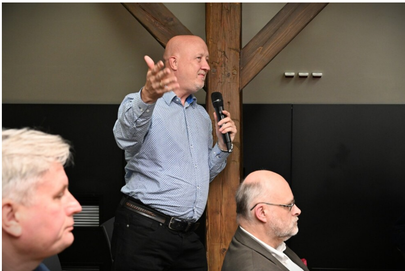
Konferencja naukowa „Poza regulaminem, poza służbą, poza prawem. Codzienność, praktyki nieformalne i życie pozazawodowe funkcjonariuszy SB w latach 1956-1990”.