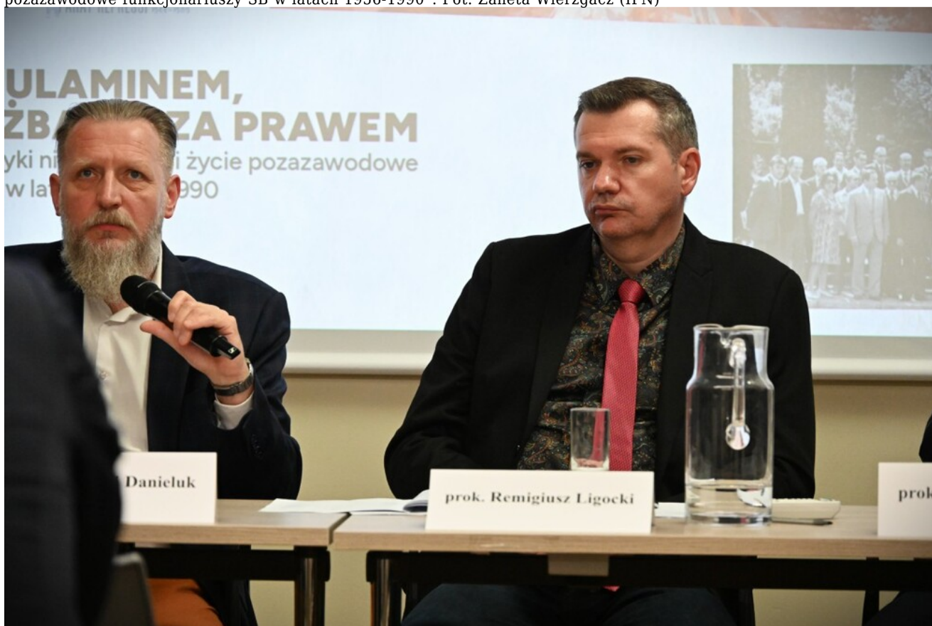
Konferencja naukowa „Poza regulaminem, poza służbą, poza prawem. Codzienność, praktyki nieformalne i życie pozazawodowe funkcjonariuszy SB w latach 1956-1990”.