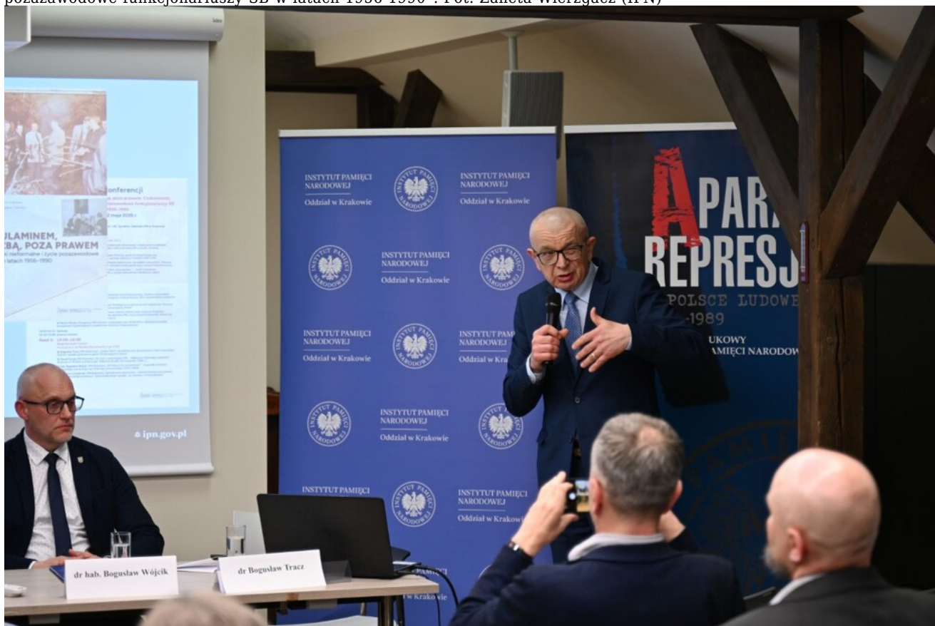
Konferencja naukowa „Poza regulaminem, poza służbą, poza prawem. Codziennosc, praktyki nieformalne i życie pozazawodowe funkcjonariuszy SB w latach 1956-1990”.