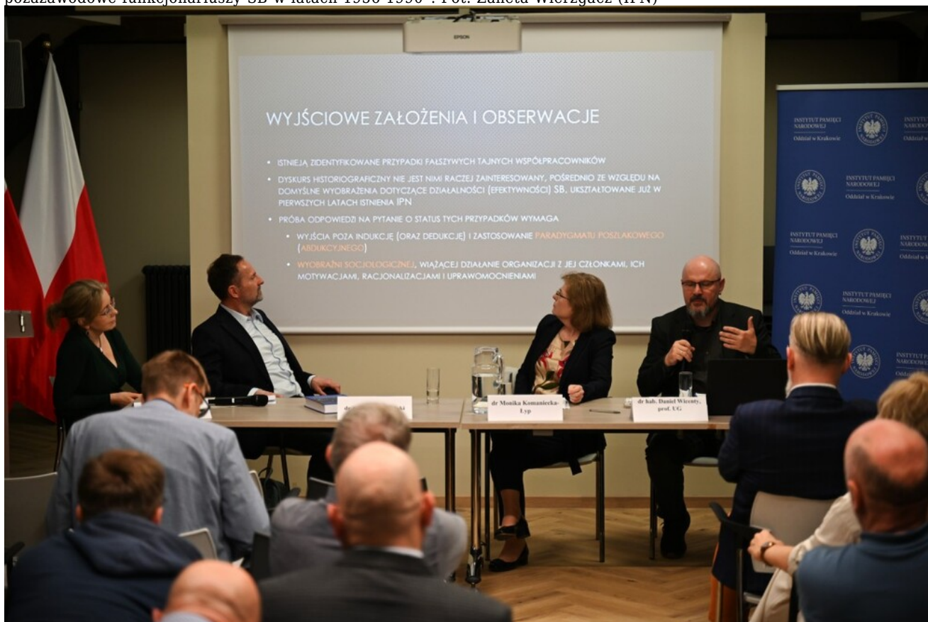
Konferencja naukowa „Poza regulaminem, poza służbą, poza prawem. Codziennosc, praktyki nieformalne i życie pozazawodowe funkcjonariuszy SB w latach 1956-1990”.