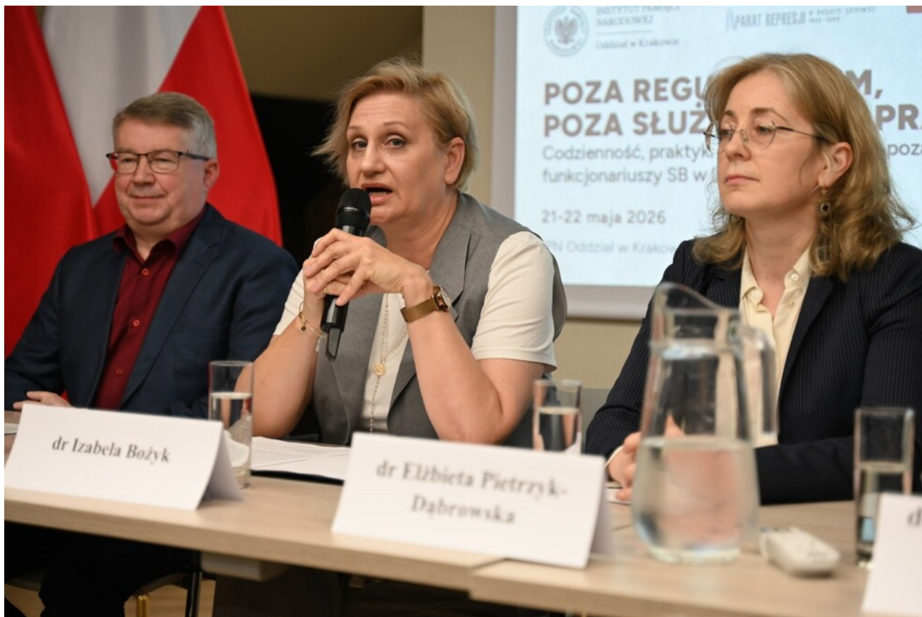
Konferencja naukowa „Poza regulaminem, poza służbą, poza prawem. Codzienność, praktyki nieformalne i życie pozazawodowe funkcjonariuszy SB w latach 1956-1990”.