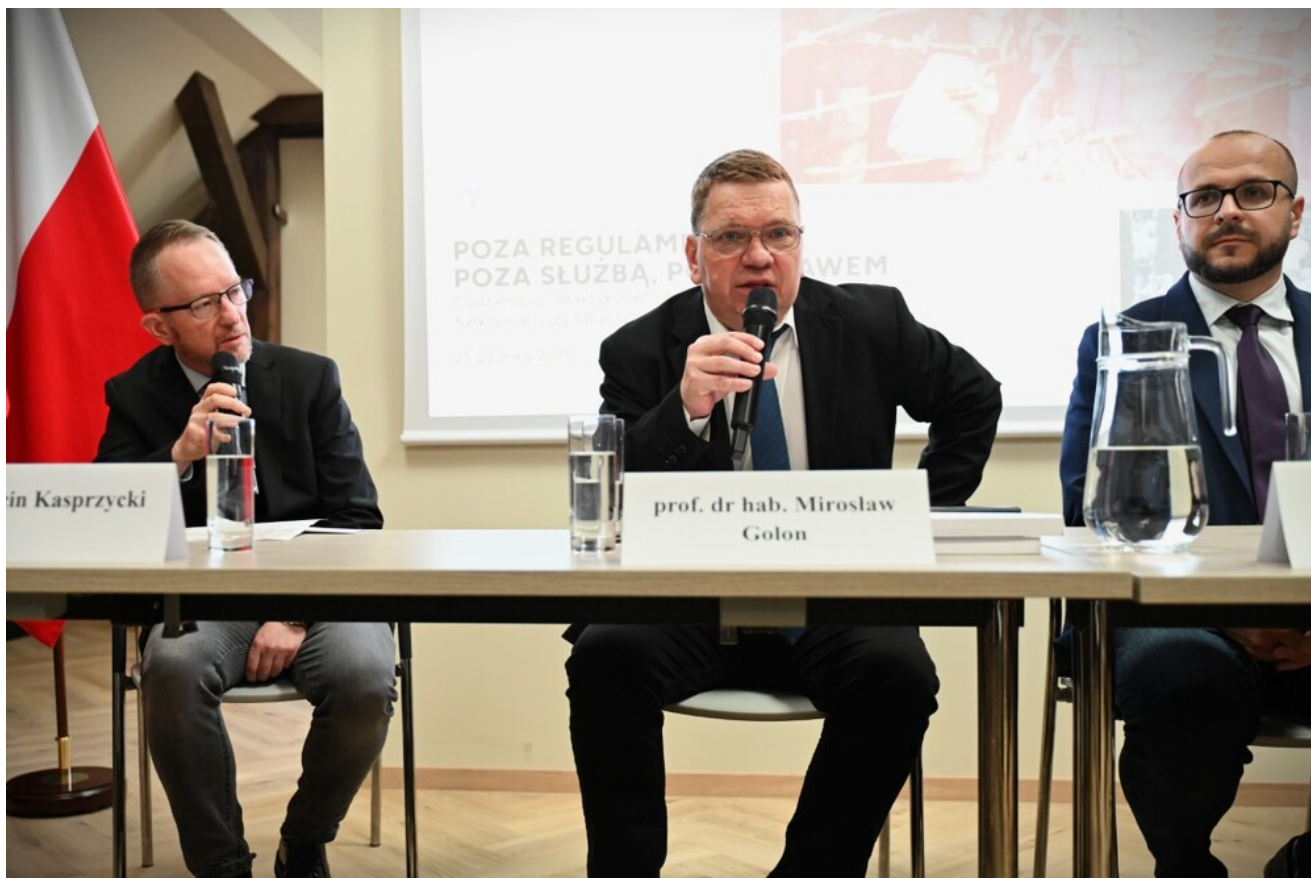
Konferencja naukowa „Poza regulaminem, poza służbą, poza prawem. Codziennosc, praktyki nieformalne i zycie pozazawodowe funkcjonariuszy SB w latach 1956-1990”.