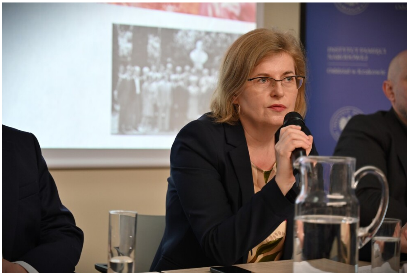
Konferencja naukowa „Poza regulaminem, poza służbą, poza prawem. Codziennosc, praktyki nieformalne i życie pozazawodowe funkcjonariuszy SB w latach 1956-1990”.