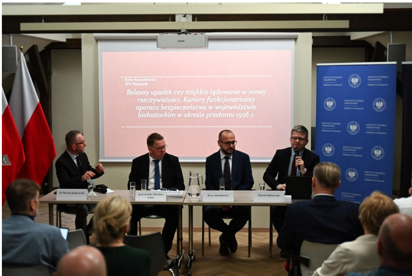
Konferencja naukowa „Poza regulaminem, poza służbą, poza prawem. Codziennosc, praktyki nieformalne i życie pozazawodowe funkcjonariuszy SB w latach 1956-1990”.