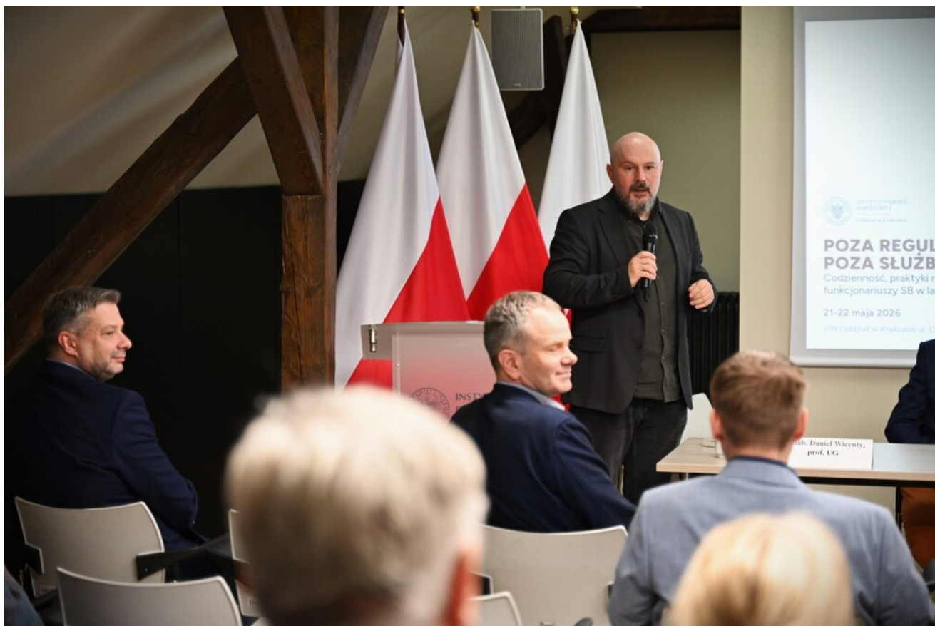
Konferencja naukowa „Poza regulaminem, poza służbą, poza prawem. Codziennosc, praktyki nieformalne i zycie pozazawodowe funkcjonariuszy SB w latach 1956-1990”.