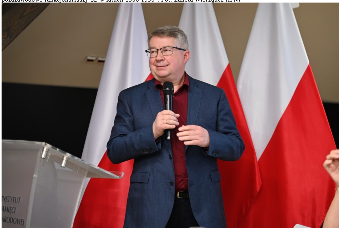
Konferencja naukowa „Poza regulaminem, poza służbą, poza prawem. Codziennosc, praktyki nieformalne i życie pozazawodowe funkcjonariuszy SB w latach 1956-1990”.