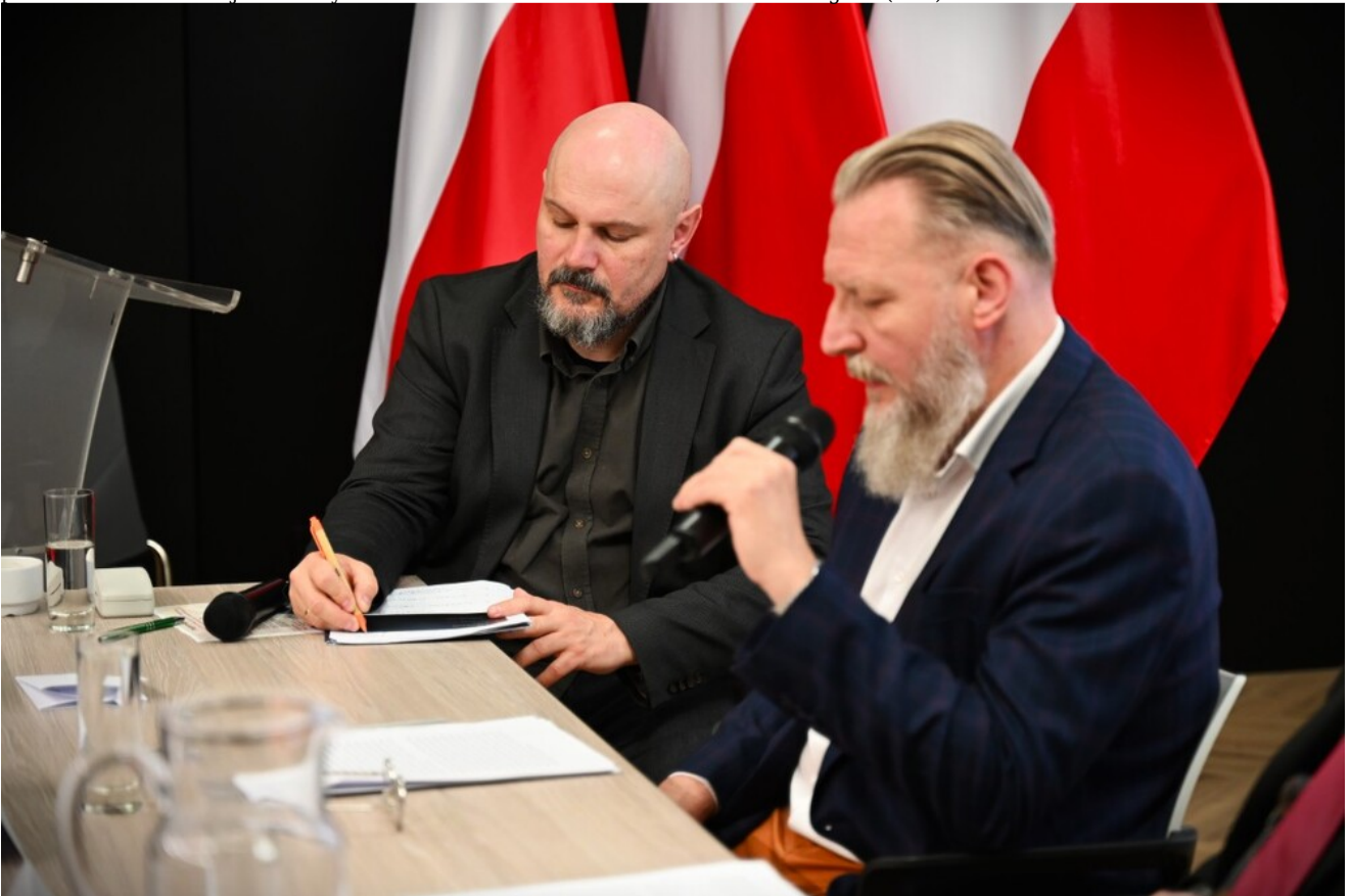
Konferencja naukowa „Poza regulaminem, poza służbą, poza prawem. Codzienność, praktyki nieformalne i życie pozazawodowe funkcjonariuszy SB w latach 1956-1990”.