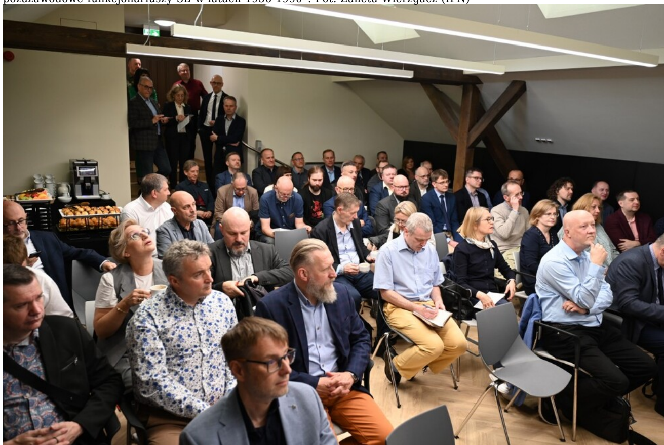
Konferencja naukowa „Poza regulaminem, poza służbą, poza prawem. Codzienność, praktyki nieformalne i życie pozazawodowe funkcjonariuszy SB w latach 1956-1990”.