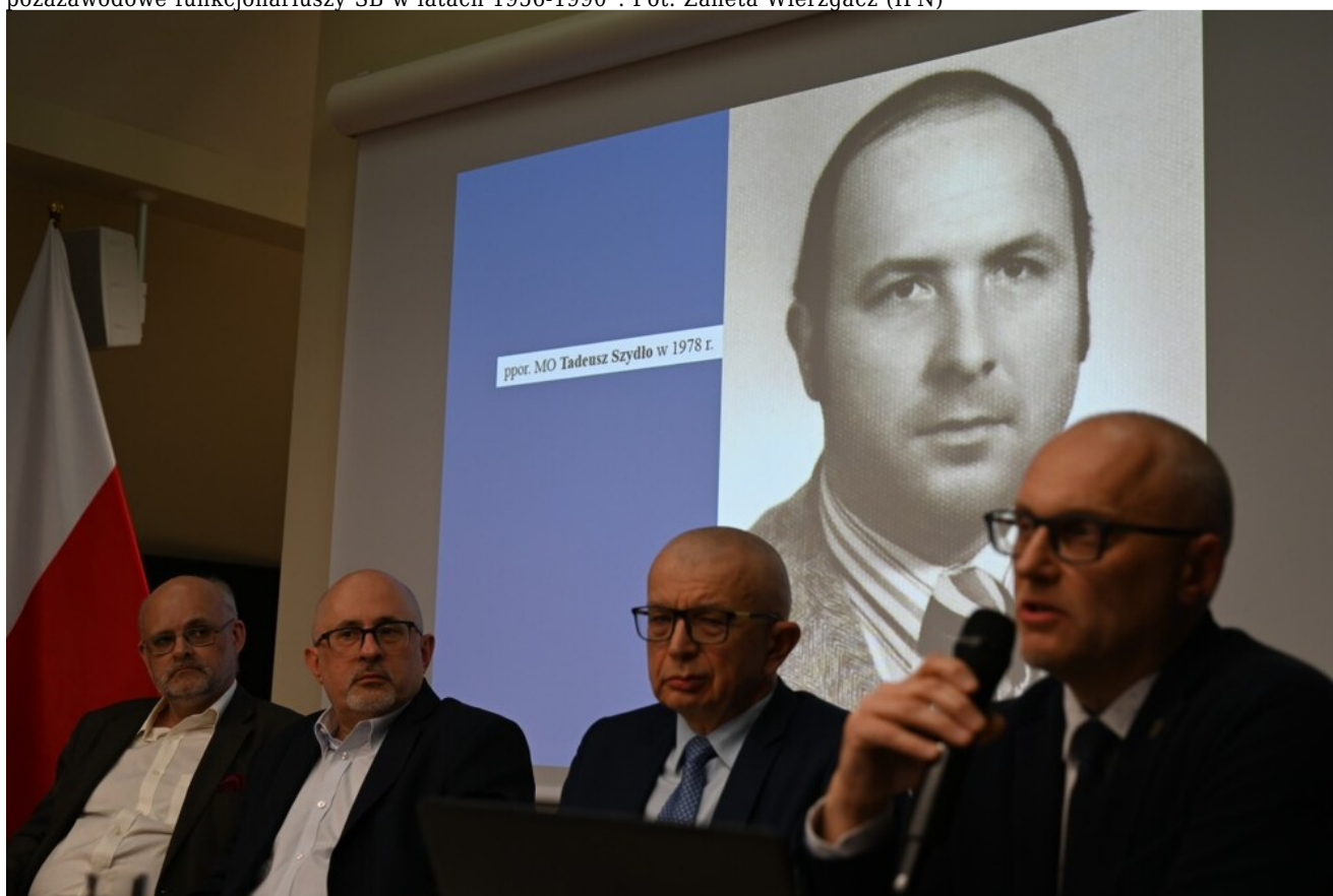
Konferencja naukowa „Poza regulaminem, poza służbą, poza prawem. Codziennosc, praktyki nieformalne i życie pozazawodowe funkcjonariuszy SB w latach 1956-1990”.