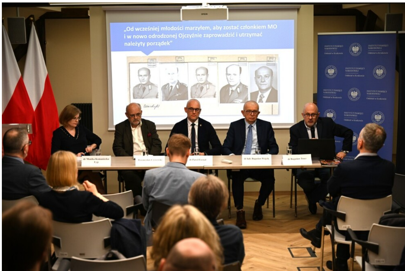
Konferencja naukowa „Poza regulaminem, poza służbą, poza prawem. Codziennosc, praktyki nieformalne i życie pozazawodowe funkcjonariuszy SB w latach 1956-1990”.