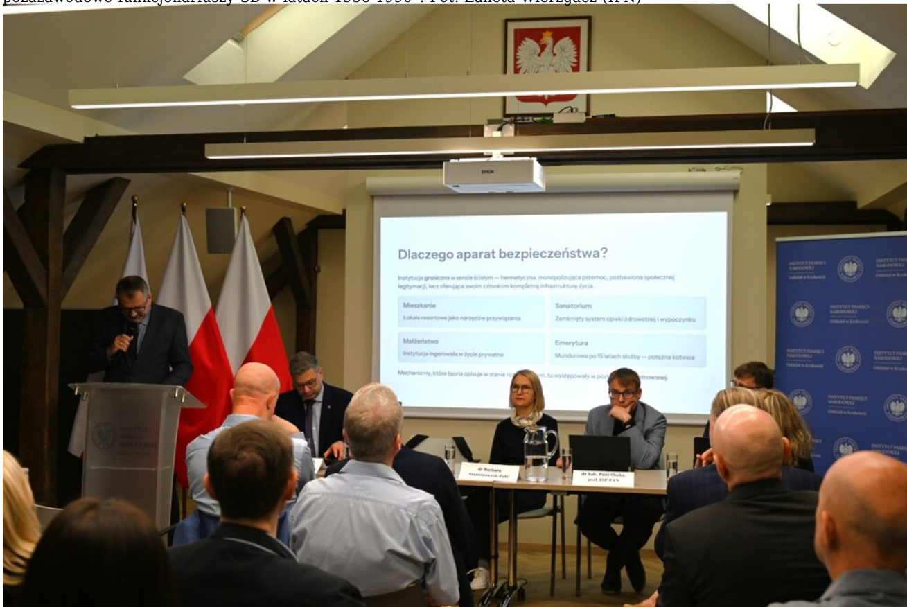
Konferencja naukowa „Poza regulaminem, poza służbą, poza prawem. Codzienność, praktyki nieformalne i życie pozazawodowe funkcjonariuszy SB w latach 1956-1990”.