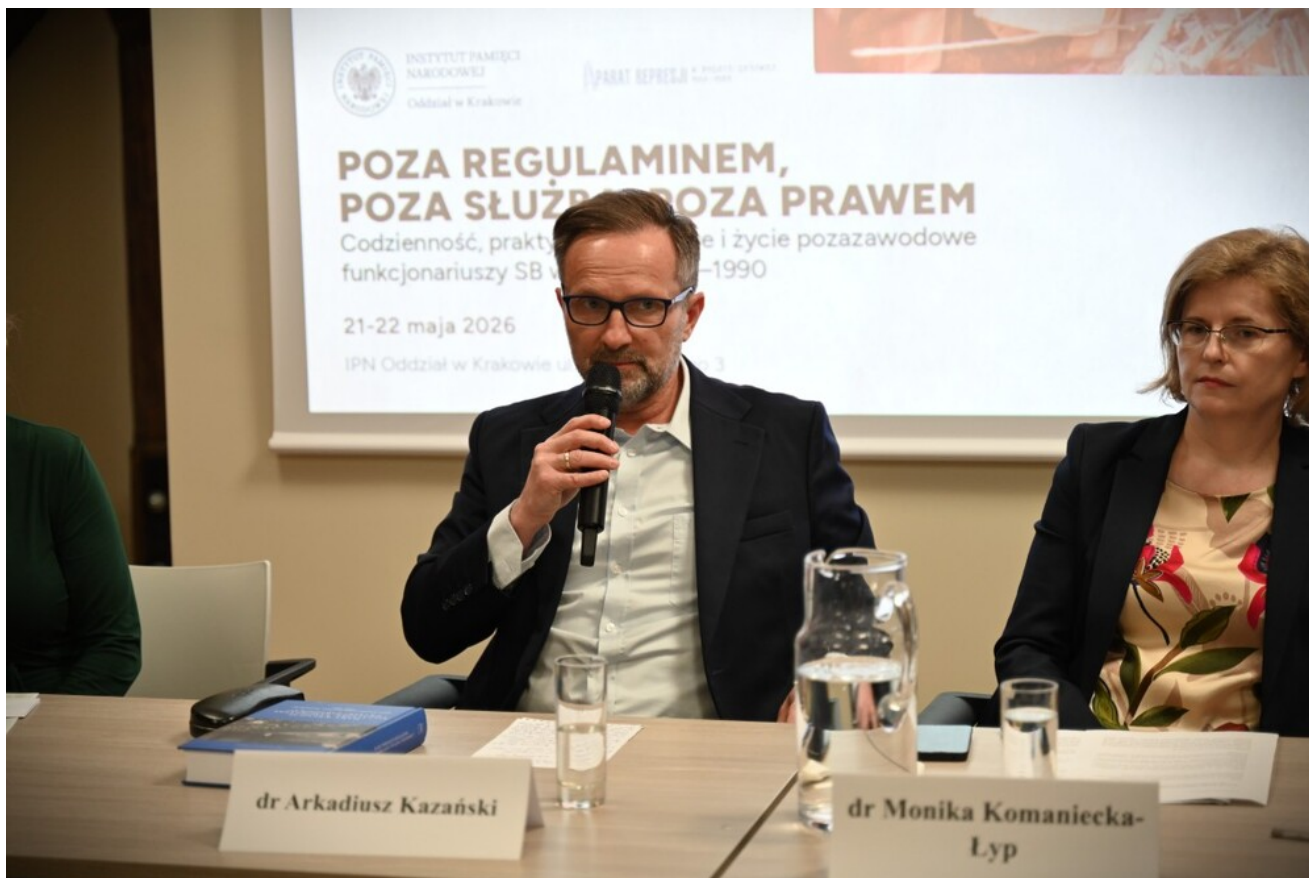
Konferencja naukowa „Poza regulaminem, poza służbą, poza prawem. Codziennosc, praktyki nieformalne i zycie pozazawodowe funkcjonariuszy SB w latach 1956-1990”.