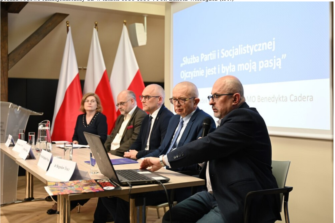
Konferencja naukowa „Poza regulaminem, poza służbą, poza prawem. Codzienność, praktyki nieformalne i życie pozazawodowe funkcjonariuszy SB w latach 1956-1990”.