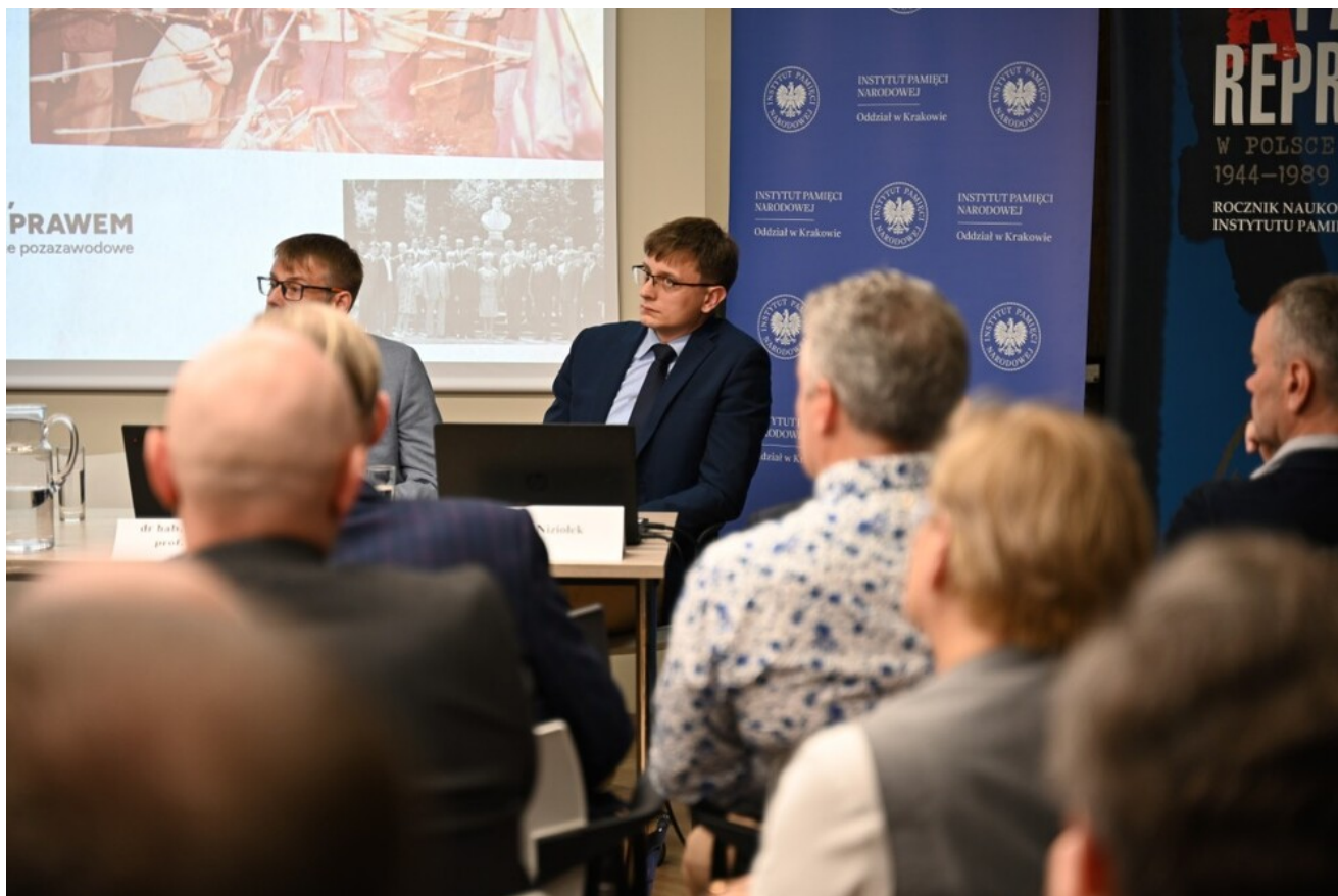
Konferencja naukowa „Poza regulaminem, poza służbą, poza prawem. Codziennosc, praktyki nieformalne i życie pozazawodowe funkcjonariuszy SB w latach 1956-1990”.