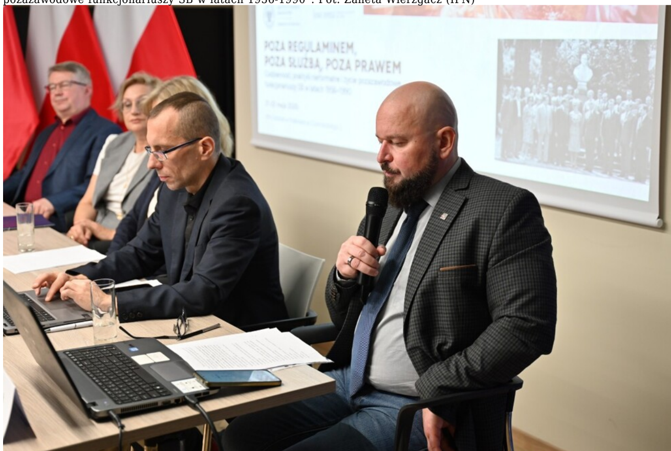
Konferencja naukowa „Poza regulaminem, poza służbą, poza prawem. Codzienność, praktyki nieformalne i życie pozazawodowe funkcjonariuszy SB w latach 1956-1990”.