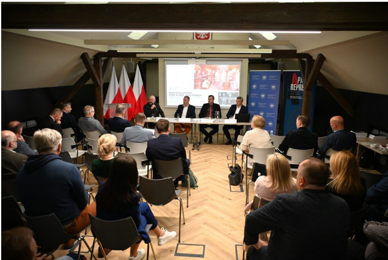
Konferencja naukowa „Poza regulaminem, poza służbą, poza prawem. Codziennosc, praktyki nieformalne i zycie pozazawodowe funkcjonariuszy SB w latach 1956-1990”.