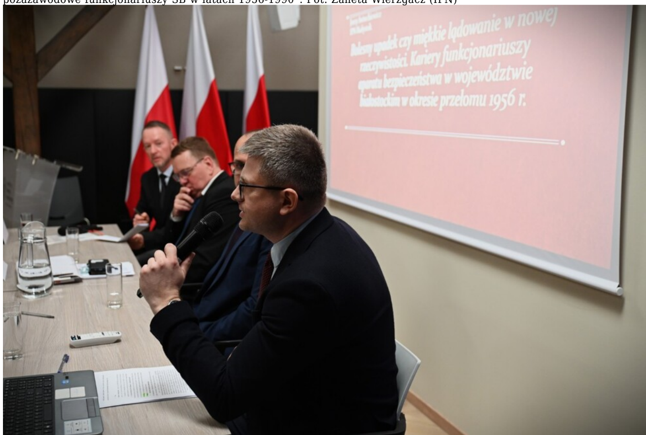
Konferencja naukowa „Poza regulaminem, poza służbą, poza prawem. Codziennosc, praktyki nieformalne i życie pozazawodowe funkcjonariuszy SB w latach 1956-1990”.