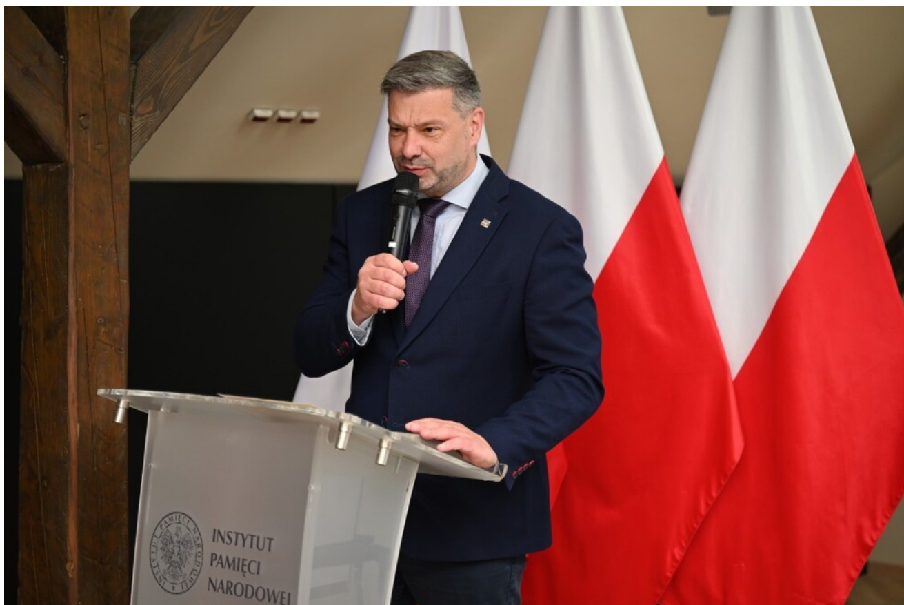
Konferencja naukowa „Poza regulaminem, poza służbą, poza prawem. Codzienność, praktyki nieformalne i życie pozazawodowe funkcjonariuszy SB w latach 1956-1990”.