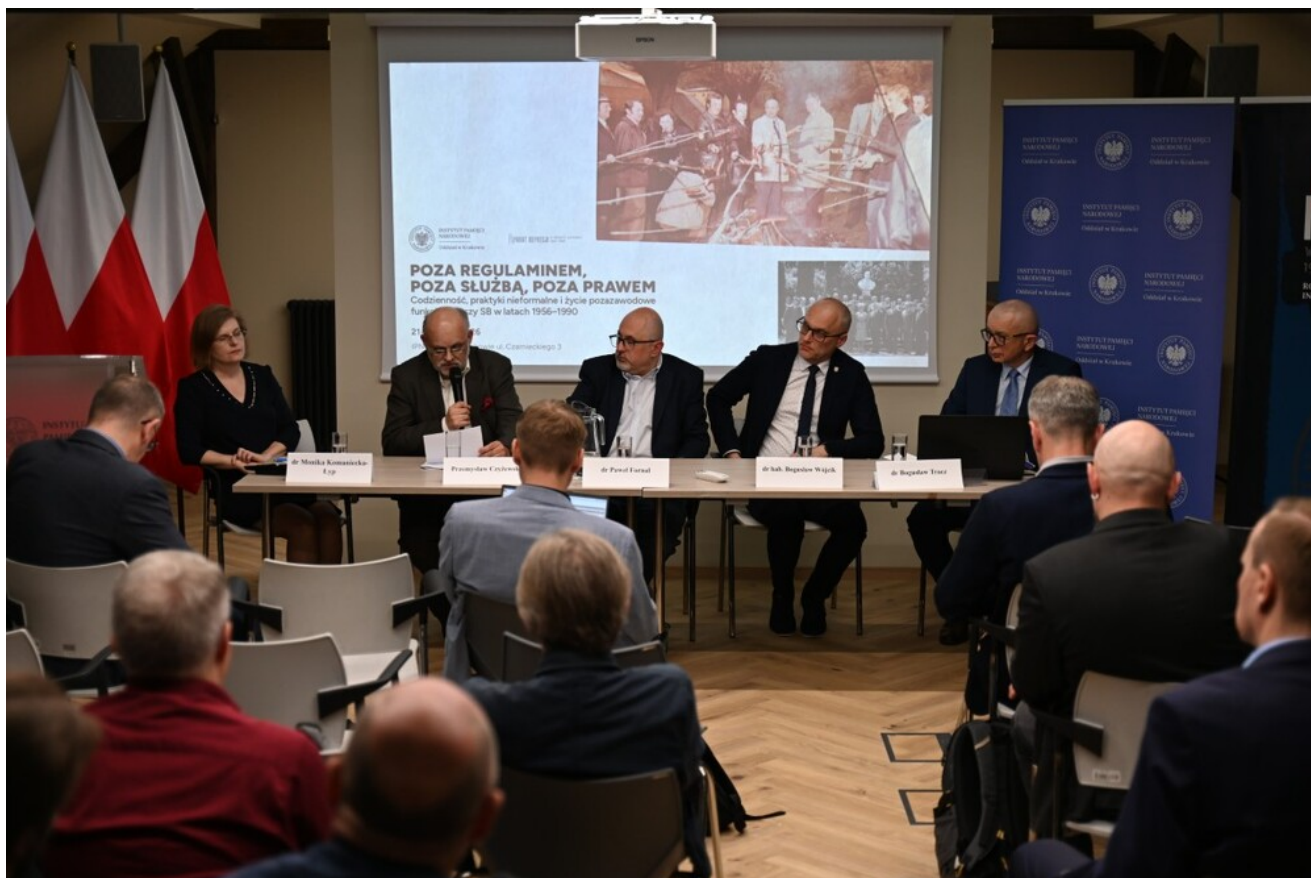
Konferencja naukowa „Poza regulaminem, poza służbą, poza prawem. Codziennosc, praktyki nieformalne i życie pozazawodowe funkcjonariuszy SB w latach 1956-1990”.