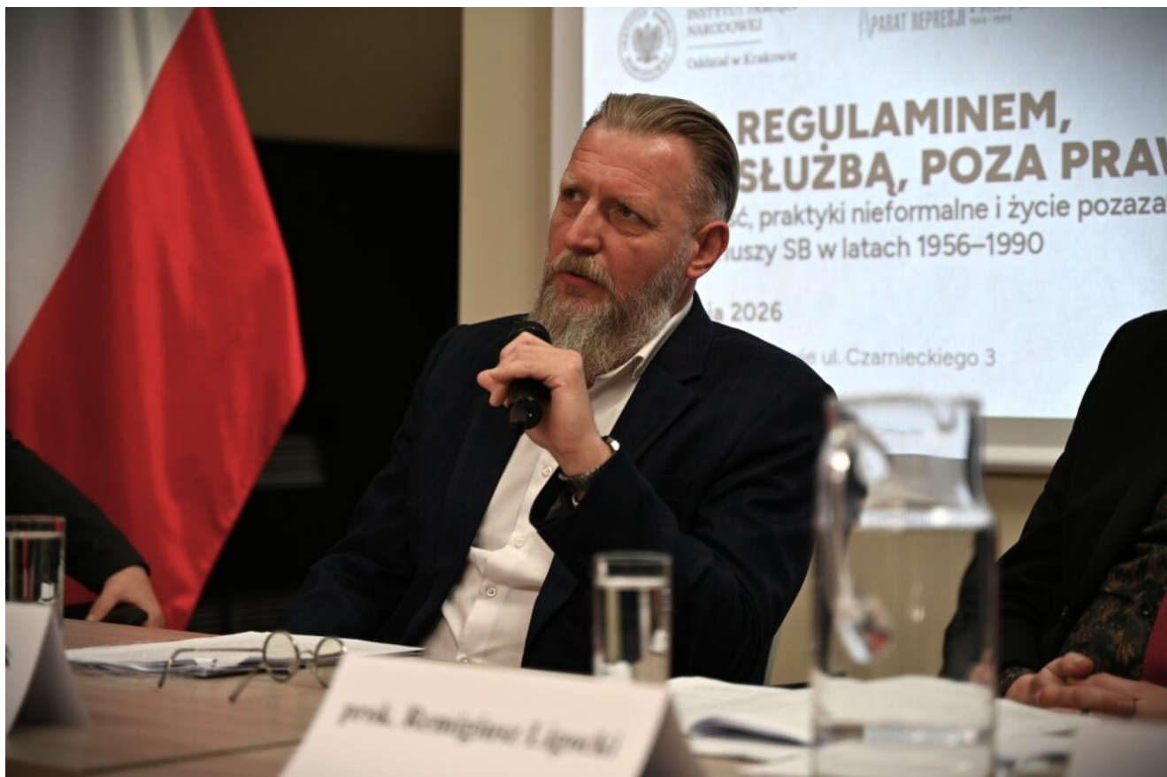
Konferencja naukowa „Poza regulaminem, poza służbą, poza prawem. Codziennosc, praktyki nieformalne i zycie pozazawodowe funkcjonariuszy SB w latach 1956-1990”.