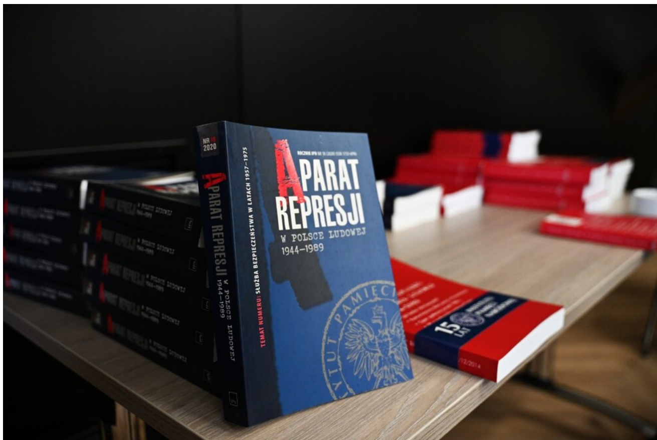
Konferencja naukowa „Poza regulaminem, poza służbą, poza prawem. Codziennosc, praktyki nieformalne i życie pozazawodowe funkcjonariuszy SB w latach 1956-1990”.