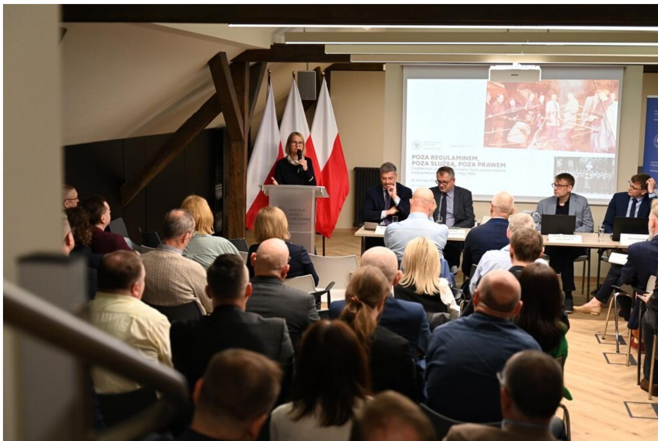
Konferencja naukowa „Poza regulaminem, poza służbą, poza prawem. Codzienność, praktyki nieformalne i życie pozazawodowe funkcjonariuszy SB w latach 1956-1990”.