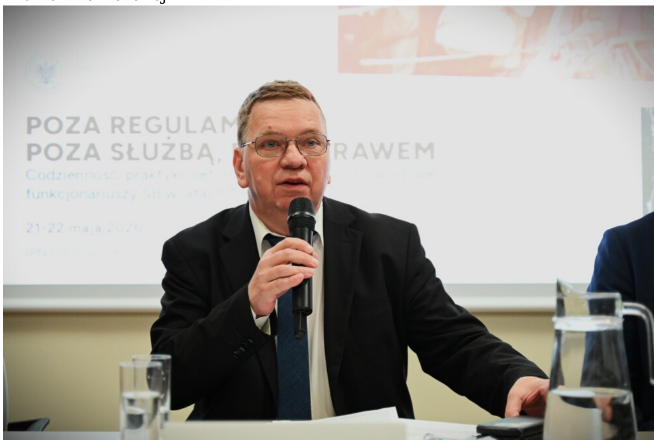
Konferencja naukowa „Poza regulaminem, poza służbą, poza prawem. Codziennosc, praktyki nieformalne i życie pozazawodowe funkcjonariuszy SB w latach 1956-1990”.