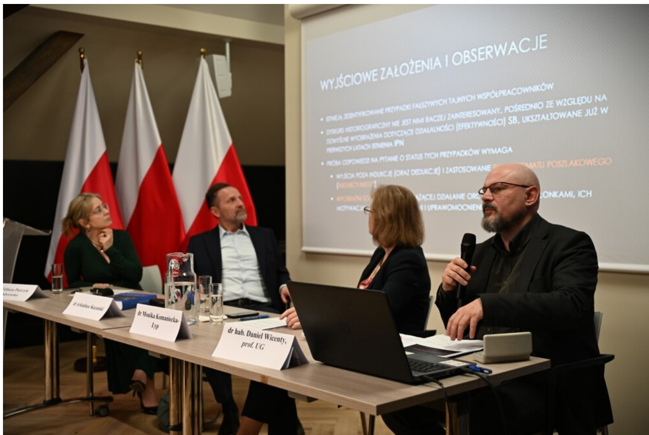
Konferencja naukowa „Poza regulaminem, poza służbą, poza prawem. Codziennosc, praktyki nieformalne i życie pozazawodowe funkcjonariuszy SB w latach 1956-1990”.