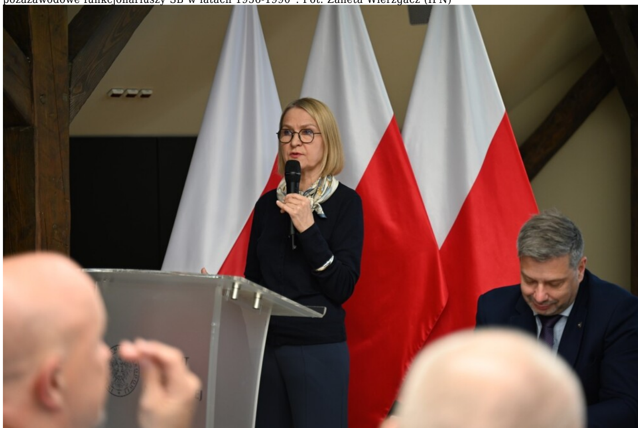
Konferencja naukowa „Poza regulaminem, poza służbą, poza prawem. Codzienność, praktyki nieformalne i życie pozazawodowe funkcjonariuszy SB w latach 1956-1990”.