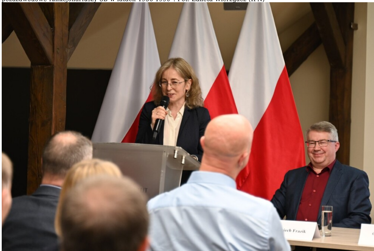
Konferencja naukowa „Poza regulaminem, poza służbą, poza prawem. Codzienność, praktyki nieformalne i życie pozazawodowe funkcjonariuszy SB w latach 1956-1990”.