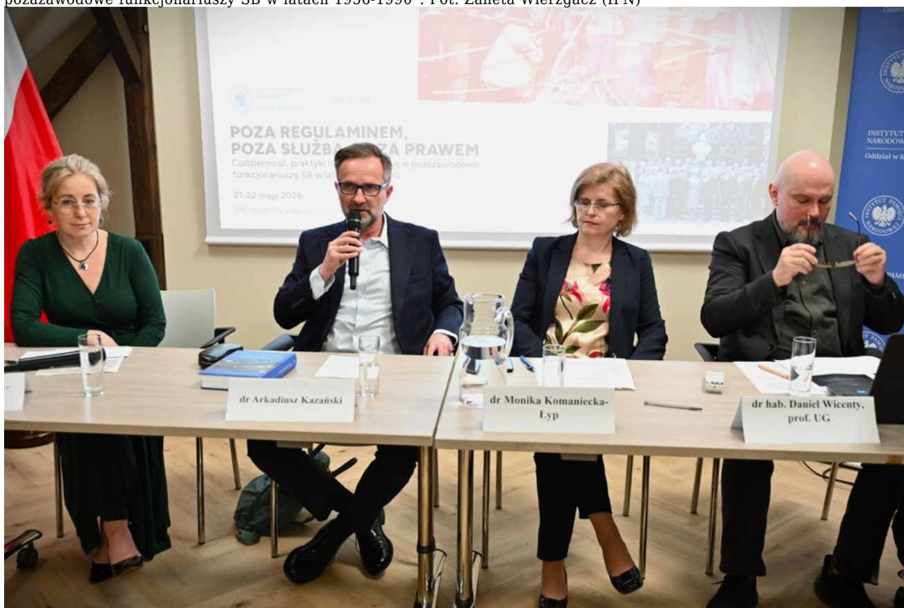
Konferencja naukowa „Poza regulaminem, poza służbą, poza prawem. Codziennosc, praktyki nieformalne i zycie pozazawodowe funkcjonariuszy SB w latach 1956-1990”.