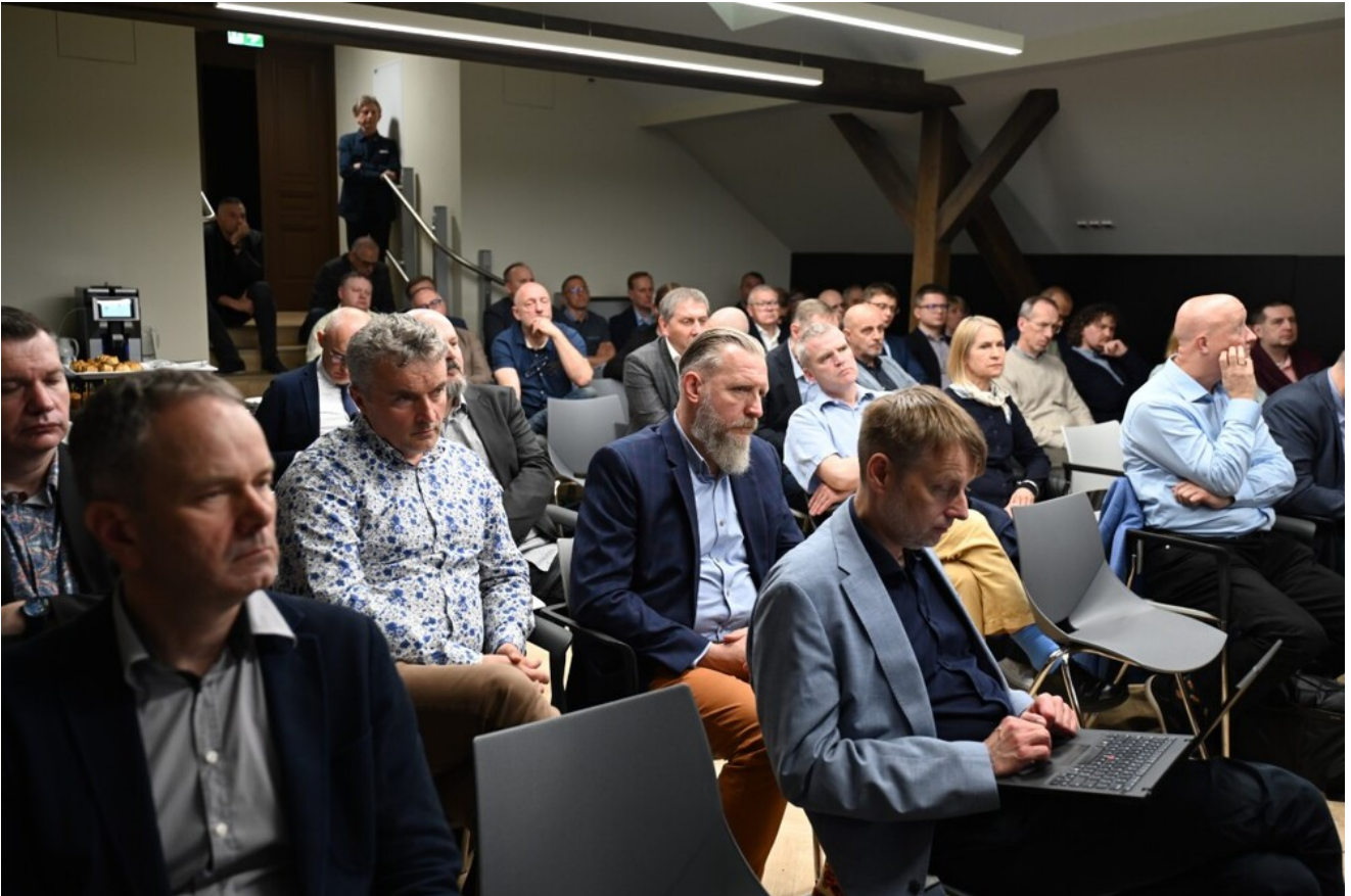
Konferencja naukowa „Poza regulaminem, poza służbą, poza prawem. Codzienność, praktyki nieformalne i życie pozazawodowe funkcjonariuszy SB w latach 1956-1990”.