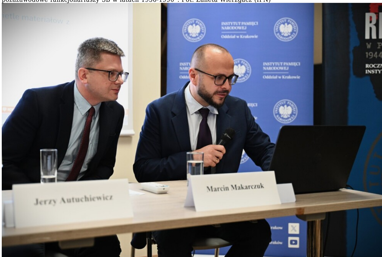
Konferencja naukowa „Poza regulaminem, poza służbą, poza prawem. Codziennosc, praktyki nieformalne i życie pozazawodowe funkcjonariuszy SB w latach 1956-1990”.