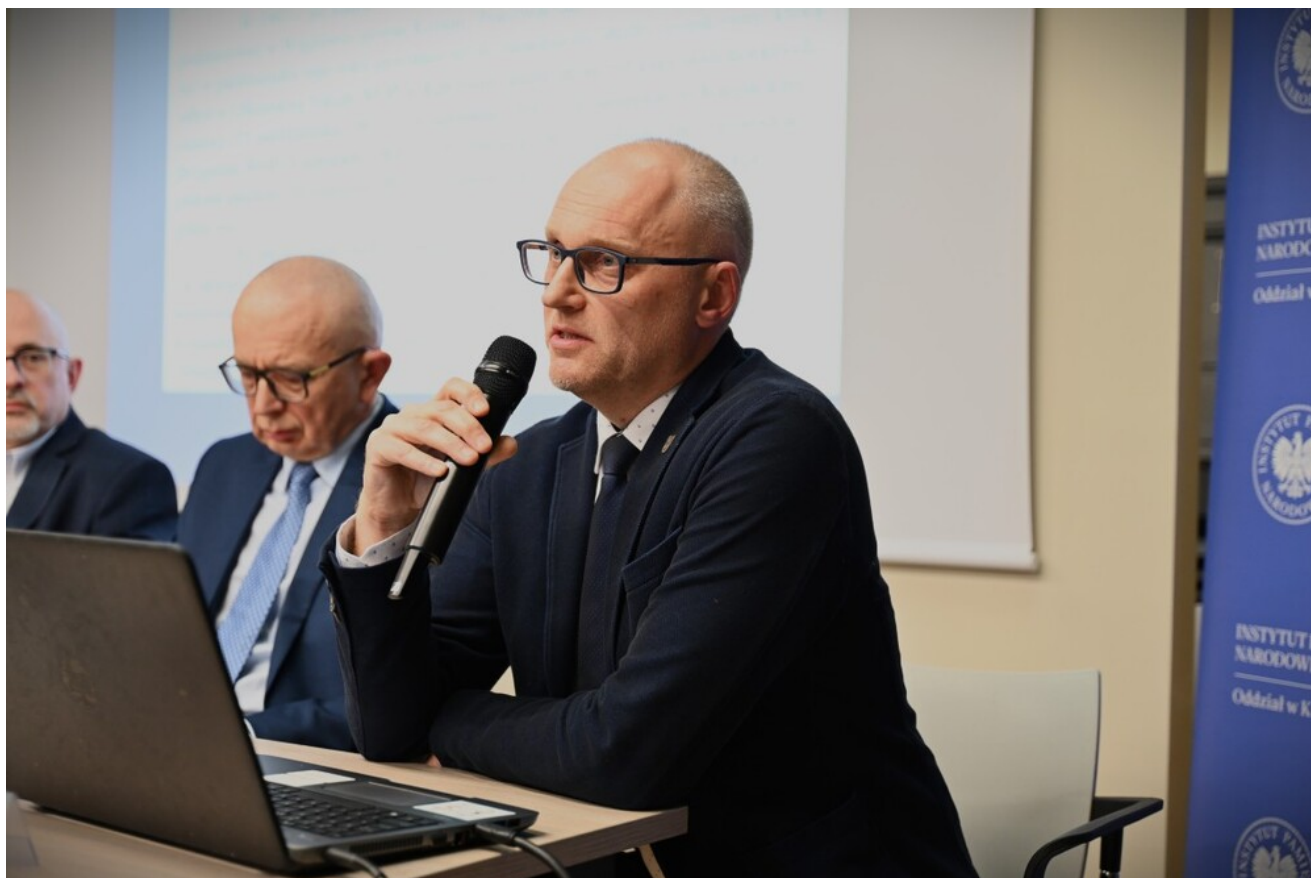
Konferencja naukowa „Poza regulaminem, poza służbą, poza prawem. Codziennosc, praktyki nieformalne i życie pozazawodowe funkcjonariuszy SB w latach 1956-1990”.