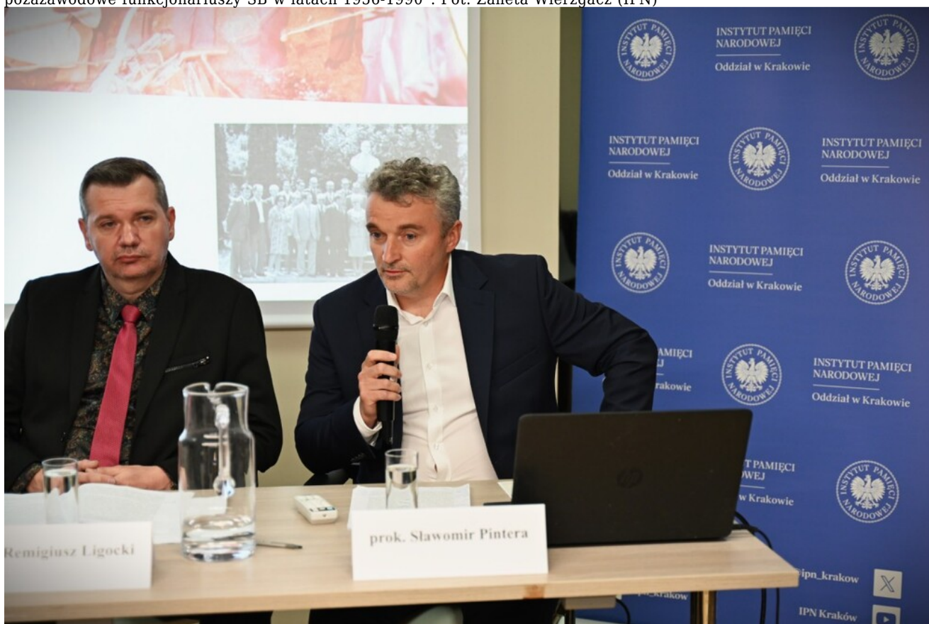
Konferencja naukowa „Poza regulaminem, poza służbą, poza prawem. Codziennosc, praktyki nieformalne i zycie pozazawodowe funkcjonariuszy SB w latach 1956-1990”.