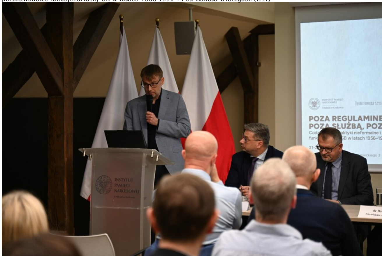
Konferencja naukowa „Poza regulaminem, poza służbą, poza prawem. Codziennosc, praktyki nieformalne i życie pozazawodowe funkcjonariuszy SB w latach 1956-1990”.