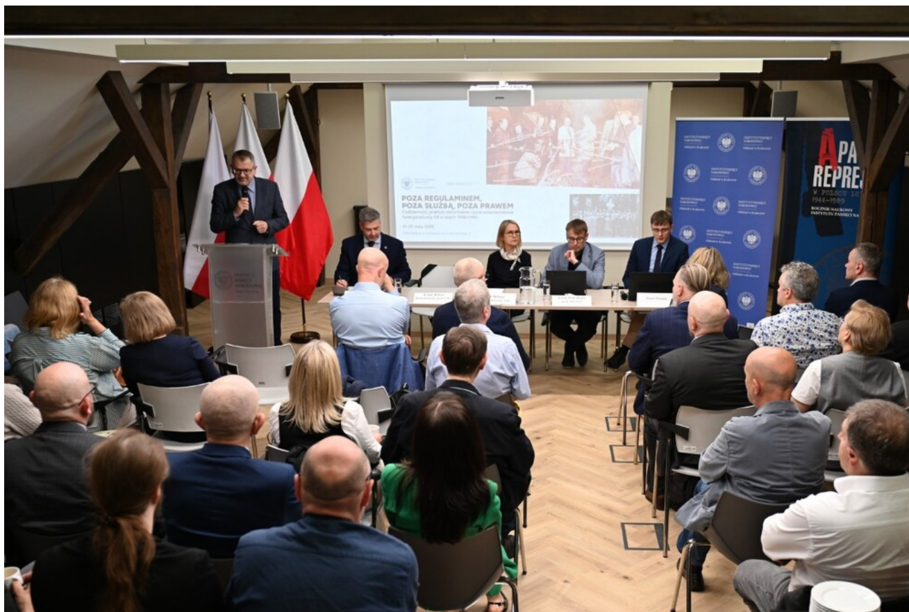
Konferencja naukowa „Poza regulaminem, poza służbą, poza prawem. Codziennosc, praktyki nieformalne i życie pozazawodowe funkcjonariuszy SB w latach 1956-1990”.