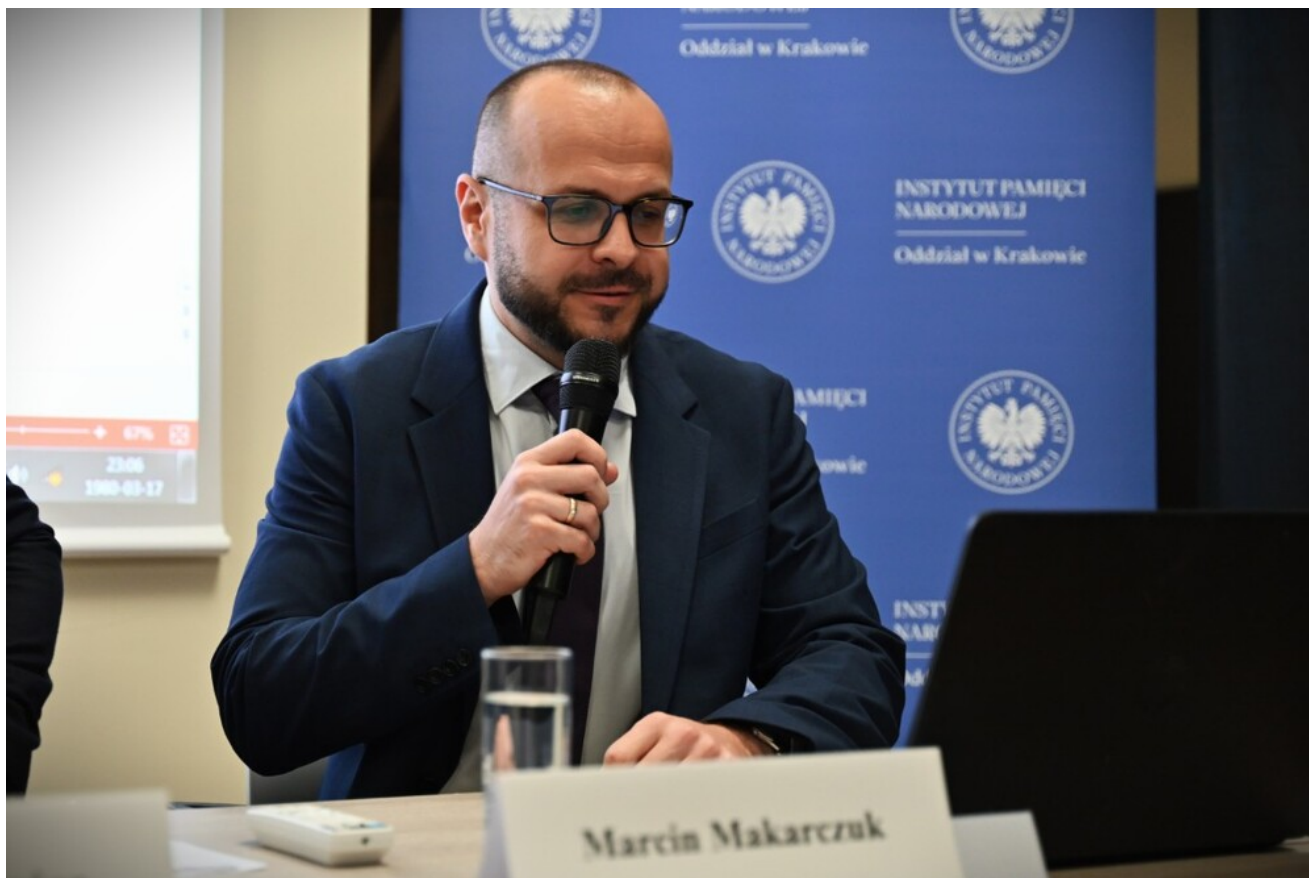
Konferencja naukowa „Poza regulaminem, poza służbą, poza prawem. Codziennosc, praktyki nieformalne i życie pozazawodowe funkcjonariuszy SB w latach 1956-1990”.