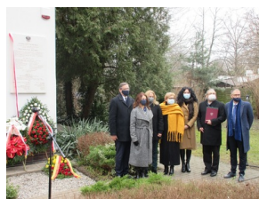
Uroczyste odsłonięcie tablicy upamiętniającej Jana i Antoninę Żabińskich - Sprawiedliwych wśród Narodów Świata - Warszawa, 24 marca 2021.