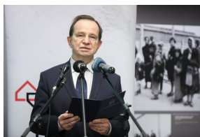
Marszałek województwa podkarpackiego Władysław Ortyl. Uroczystości Narodowego Dnia Pamięci Polaków ratujących Żydów pod okupacją niemiecką - Markowa, 24 marca 2021.