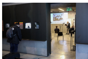
Uroczystości Narodowego Dnia Pamięci Polaków ratujących Żydów pod okupacją niemiecką - Markowa, 24 marca 2021.