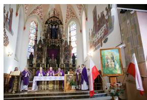
Uroczystości Narodowego Dnia Pamięci Polaków ratujących Żydów pod okupacją niemiecką - Markowa, 24 marca