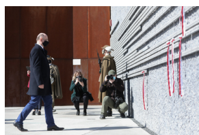
Uroczystości Narodowego Dnia Pamięci Polaków ratujących Żydów pod okupacją niemiecką - Markowa, 24 marca 2021.