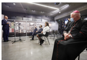
Uroczystości Narodowego Dnia Pamięci Polaków ratujących Żydów pod okupacją niemiecką - Markowa, 24 marca 2021.