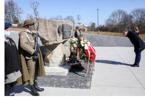
Uroczystości Narodowego Dnia Pamięci Polaków ratujących Żydów pod okupacją niemiecką - Markowa, 24 marca 2021.