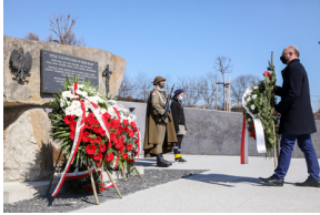
Uroczystości Narodowego Dnia Pamięci Polaków ratujących Żydów pod okupacją niemiecką - Markowa, 24 marca 2021.