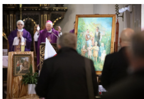
Uroczystości Narodowego Dnia Pamięci Polaków ratujących Żydów pod okupacją niemiecką - Markowa, 24 marca