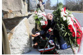
Uroczystości Narodowego Dnia Pamięci Polaków ratujących Żydów pod okupacją niemiecką - Markowa, 24 marca 2021.