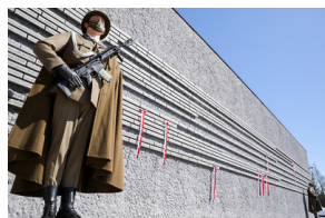
Uroczystości Narodowego Dnia Pamięci Polaków ratujących Żydów pod okupacją niemiecką - Markowa, 24 marca 2021.

Natępnie rozpoczęły się uroczystości w Muzeum Ulmów w Markowej. Podczas wystąpień m.in. przypomniana została historia ratowania Żydów. Na Ścianie Pamięci odsłonięto kolejne tablice z nazwiskami mieszkańców Podkarpacia ratujących Żydów .