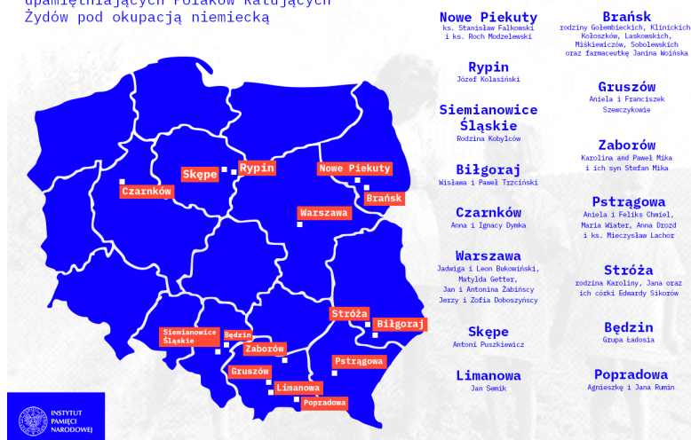
Mapa tablic (2021) upamiętniających Polaków Ratujących Żydów pod okupacją niemiecką

W 2021 roku zostaną odsłonięte nowe tablice oraz wykonane w ubiegłym roku, a nie odsłonięte z powodu epidemii Covid-19.