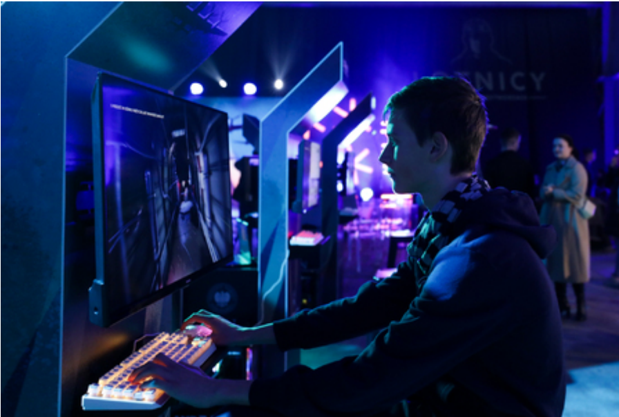
„Lotnicy - wojna w przestworzach” - kolejny autorski projekt gamingowy Instytutu Pamięci Narodowej