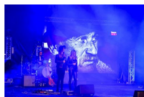
17 września 2019. „Niepodległa Pioska”.