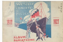
Strona tytułowa albumu poświęconego wycieczce weteranów Armii Bliskiej do Polski w 1927 r. 000000 15 000000