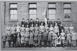
Zjazd założycieli Stowarzyszenia Weteranów Armii Polskiej w Ameryce (Cleveland, Ohio, 28-30 maja 1921 r.)