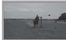
„Po czemu łokieć” – popisy władania lancą i szabłą.