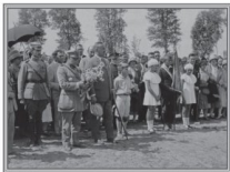
Uroczyste nabożeństwo za poległych w wojnie 1927 r.

Goście nasi zza morza poświęcili część soboty na wyjazd do Radzyna, gdzie lat temu kilka tysięcy zwycięskie boje z nieprzyjacielem kraju. Głównym celem tej wycieczki na pola radzyniejskie było oddanie caci poległym towarzyszyom broni.