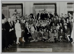
Jed Błkiny" wzięty przez Prezydenta Chępczyńskiego Związku Halickiego.