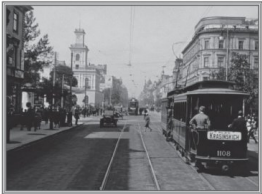
Warszawa. Uł. Marszałkowska.