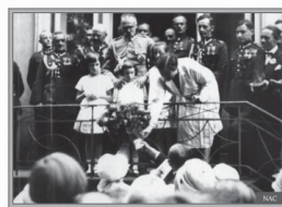
Z wzięty u Marszałka Józefa Piłsudskiego.

Chwila miłczenia. Przerywa je Marszałek, nawiązując z przytyłymi pogawędkę.