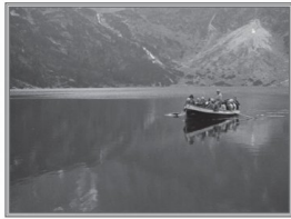
Łódźka po Morskim Oku.