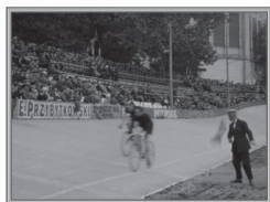
Zawody tenisowe na warszawskich Dynasach.