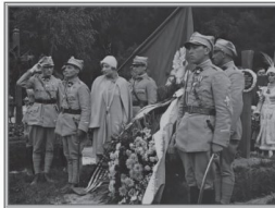
Cmentarz Oból Lwowskich. Złotne wieńce.

Na cmentarzu Obrońców Lwowa z łokci smutnych mogli bohaterów zmarła mieć dopiero pojście o nadmiarach wybitna tego miarą, które chciało być polskie na wierzchu one, najbardziej szczerze poległych oddała wycieczka swój hołd, składając na cmentarzu wspaniałe wieńce.