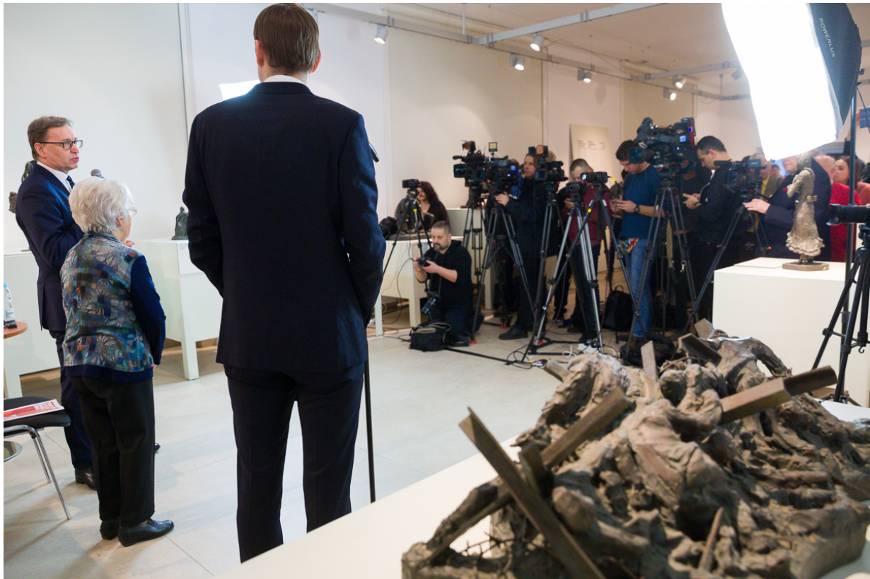
„Obraz Treblinki w oczach Samuela Willenberga” – konferencja prasowa poprzedzająca otwarcie wystawy – Warszawa, 28 stycznia 2020.

W Centrum Edukacyjnym IPN im. Janusza Kurtyki w Warszawie odbyła się konferencja prasowa dotycząca wystawy wyjątkowych, obrazujących historię Holocaustu rzeźb Samuela Willenberga, które przybyły do Polski za sprawą Instytutu Pamięci Narodowej. Autor to uciekinier z Treblinki, świadek niemieckich zbrodni, który po latach wyrzeźbił sceny z obozu. Wieczorem odbył się uroczysty wernisaż.