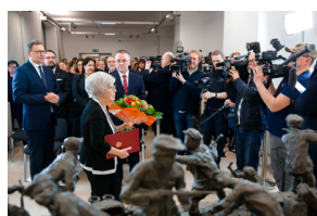
Wernisaż „Obraz Treblinki w oczach Samuela Willenberga” – Warszawa, 28 stycznia 2020.

O godz. 18.00 odbył się w tym samym miejscu wernisaż wystawy, objętej Patronatem Narodowym Prezydenta Rzeczypospolitej Polskiej Andrzeja Dudy w Stulecie Odzyskania Niepodległości. Pokazowi rzeźb towarzyszyła emisja filmu dokumentalnego „Ostatni świadek z Treblinki”.