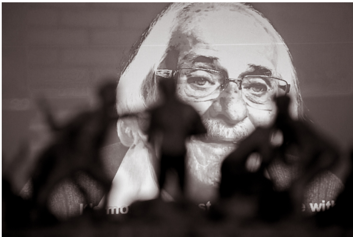
„Obraz Treblinki w oczach Samuela Willenberga” – fragment wystawy – Warszawa, 28 stycznia 2020.