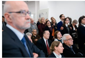
Wernisaż „Obraz Treblinki w oczach Samuela Willenberga” – Warszawa, 28 stycznia 2020.