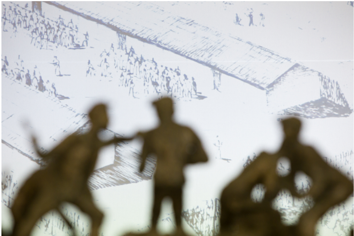
„Obraz Trebłinki w oczach Samuela Willenberg” – fragment wystawy – Warszawa, 28 stycznia 2020.