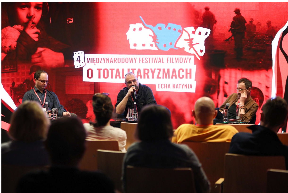
4. Międzynarodowy Festiwal Filmowy o Totalitaryzmach „Echa Katynia” podczas Kongresu Pamięci Narodowej – Warszawa, 13 kwietnia 2023.

Licznie zebrani miłośnicy historii mogli dziś uczestniczyć w wielu aktywnościach, a każde pokolenie odwiedzających odnalazło dla siebie ciekawe wydarzenia. Wieczorem odbyła się gala Sygnetów Wydawnictwa IPN, podczas której poznaliśmy Najlepsze Książki Roku 2022.