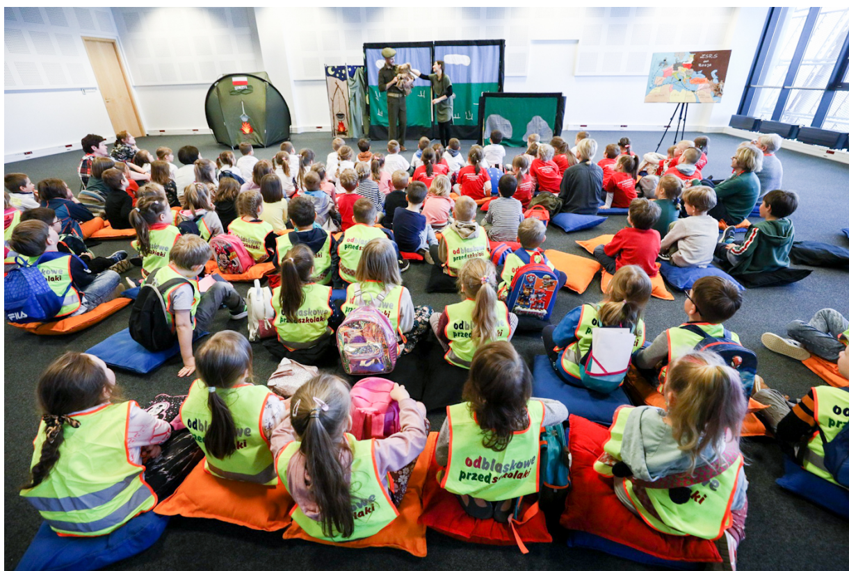
Spektakle „Miś Wojtek” na Kongresie Pamięci Narodowej – Warszawa, 13 kwietnia 2023.