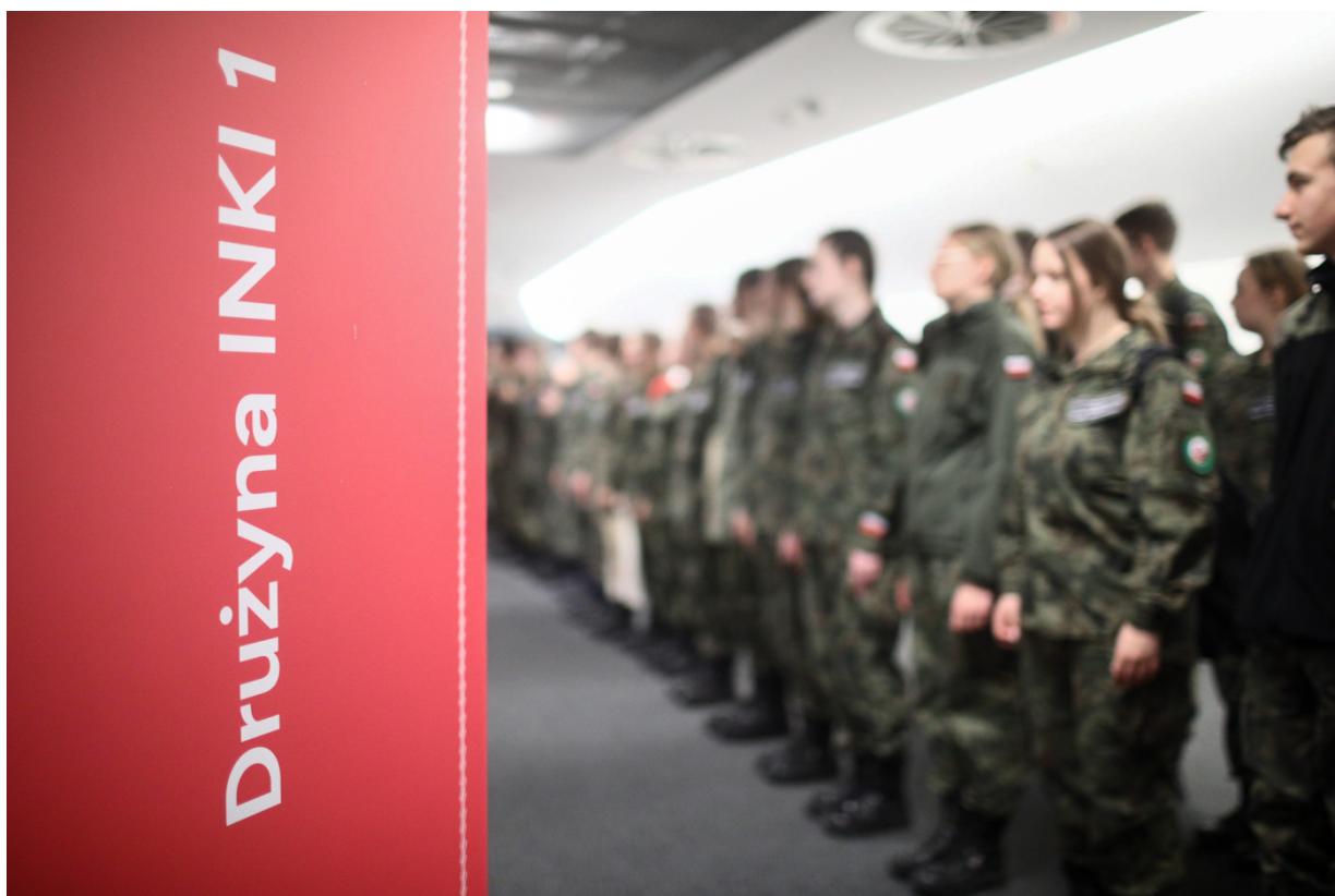
Warsztaty „Drużyna Inki” na Kongresie Pamięci Narodowej - Warszawa, 13 kwietnia 2023.