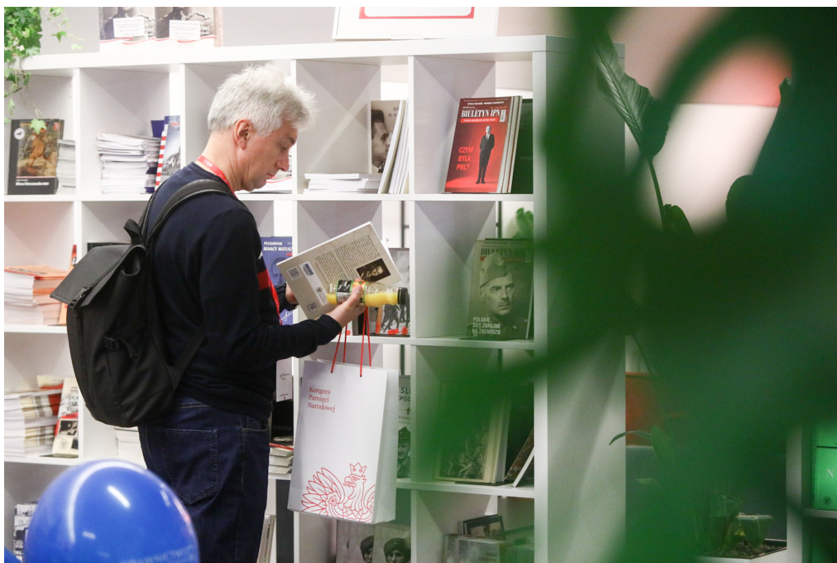
Strefa Wydawnictwa IPN na Kongresie Pamięci Narodowej – Warszawa, 13 kwietnia 2023.