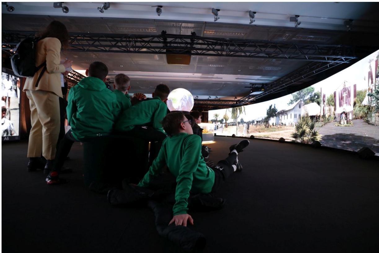
Wystawa „Szlaki Nadziei. Odyseja Wolności” podczas Kongresu Pamięci Narodowej – Warszawa, 13 kwietnia 2023.