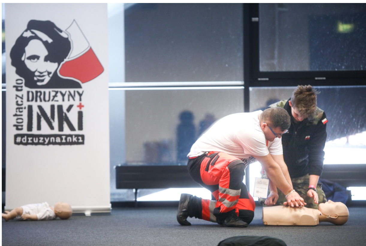
Warsztaty „Drużyna Inki” na Kongresie Pamięci Narodowej – Warszawa, 13 kwietnia 2023.