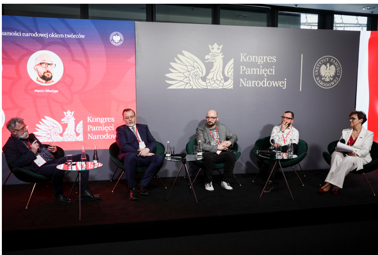
Panel dyskusyjny „Symbole tożsamości narodowej okiem twórców” podczas Kongresu Pamięci Narodowej – Warszawa, 13 kwietnia 2023.