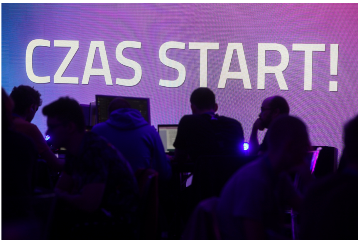
Kongres Pamięci Narodowej: początek „HistHacku” – pierwszego w dziejach hackathonu organizowanego przez IPN – Warszawa, 13 kwietnia 2023.