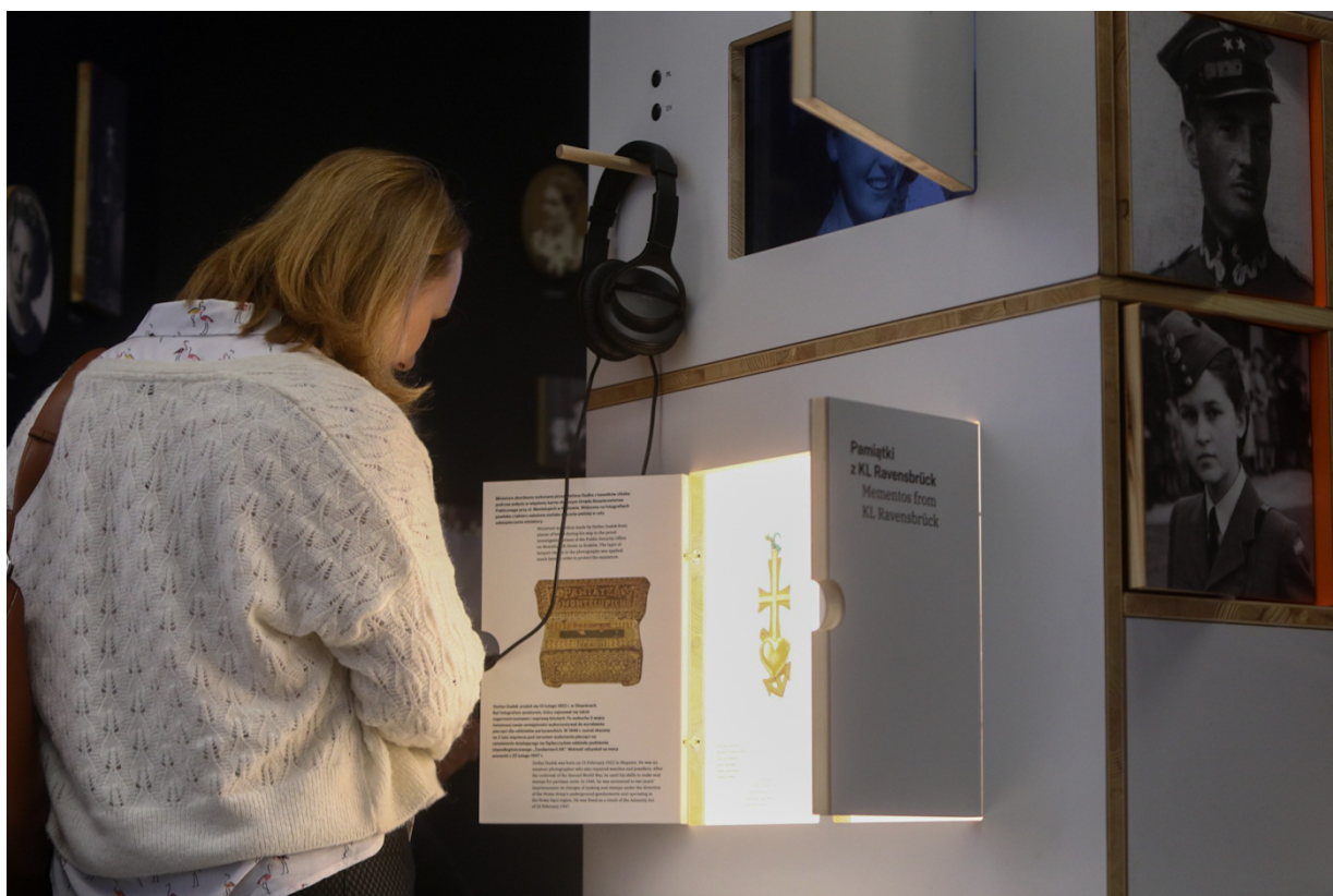
Strefa Archiwum IPN na Kongresie Pamięci Narodowej – Warszawa, 13 kwietnia 2023.