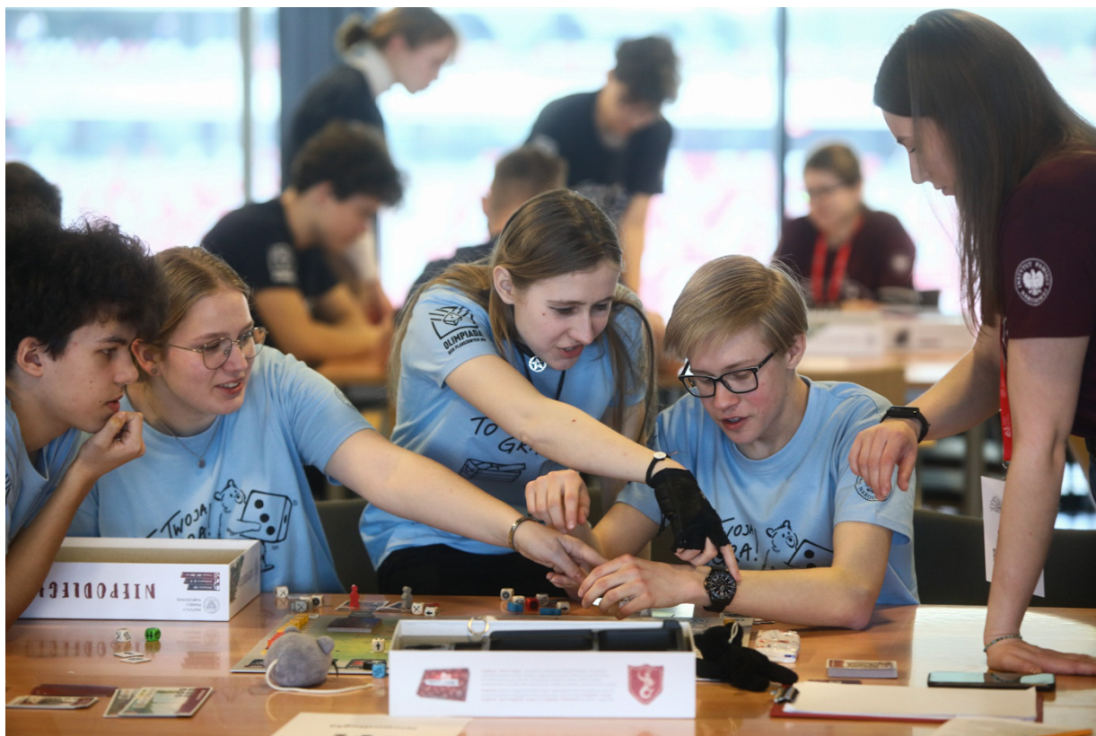
Olimpiada Gier Planszowych na Kongresie Pamięci Narodowej – Warszawa, 13 kwietnia 2023.