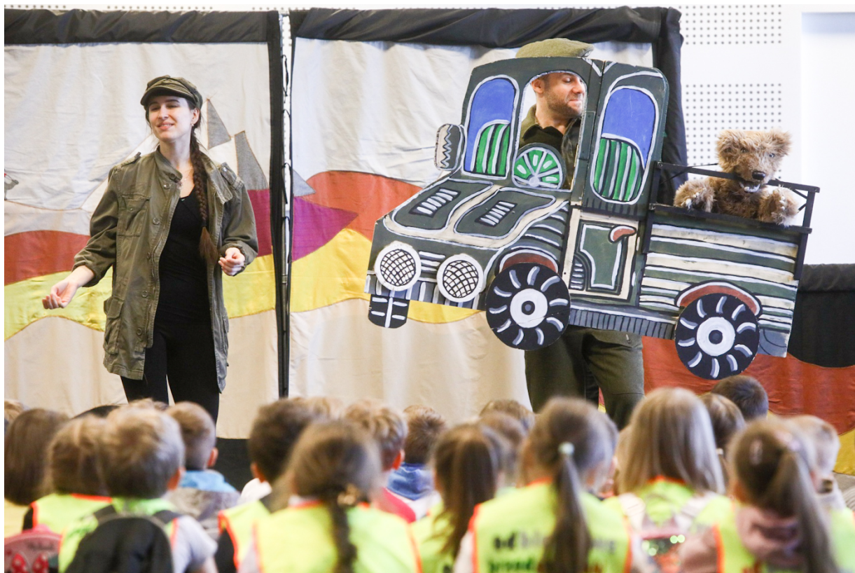
Spektakle „Miś Wojtek” na Kongresie Pamięci Narodowej – Warszawa, 13 kwietnia 2023.