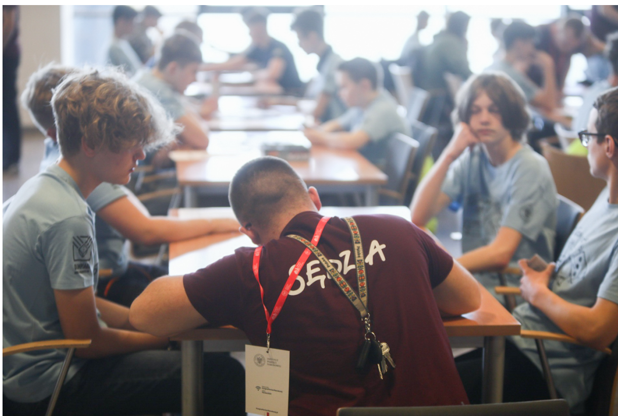
Olimpiada Gier Planszowych na Kongresie Pamięci Narodowej – Warszawa, 13 kwietnia 2023.