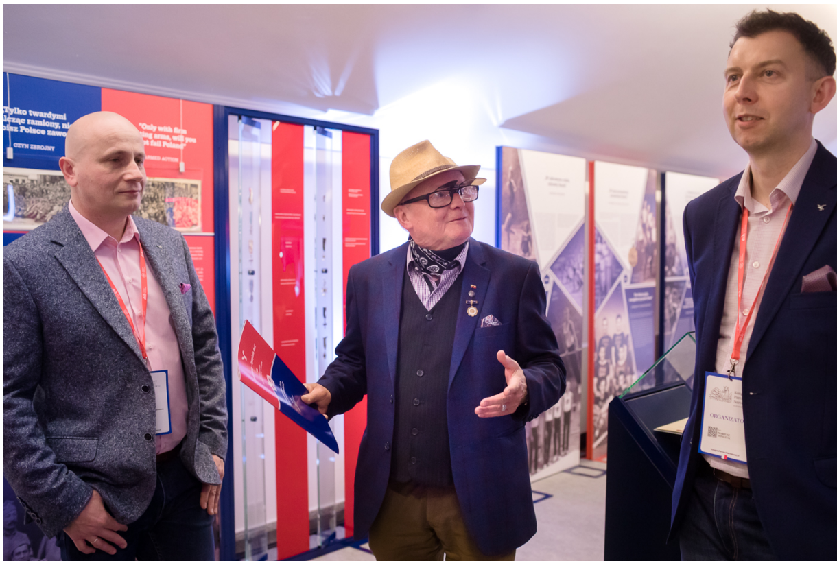
Strefa Archiwum IPN na Kongresie Pamięci Narodowej – Warszawa, 13 kwietnia 2023.