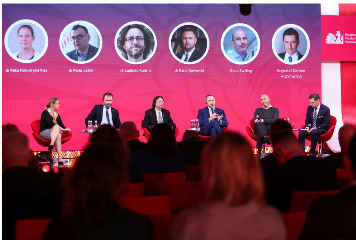
Panel „Polityka pamięci i polityka historyczna – doświadczenie krajów Europy Środkowo-Wschodniej okiem szefów instytucji” – Warszawa, 13 kwietnia 2023.