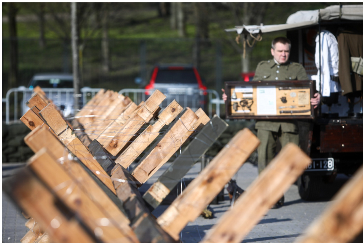
Kongres Pamięci Narodowej: Rekonstrukcje historyczne - Warszawa, 13 kwietnia 2023.