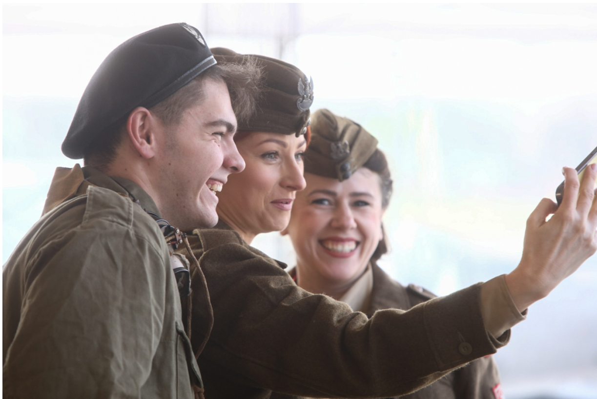
Kongres Pamięci Narodowej: Rekonstrukcje historyczne – Warszawa, 13 kwietnia 2023.