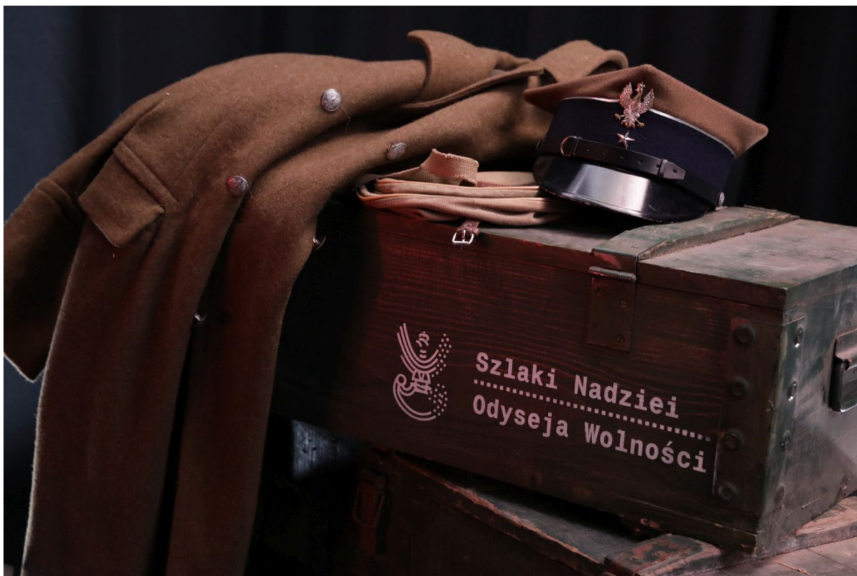
Wystawa „Szlaki Nadziei. Odyseja Wolności” podczas Kongresu Pamięci Narodowej – Warszawa, 13 kwietnia 2023.