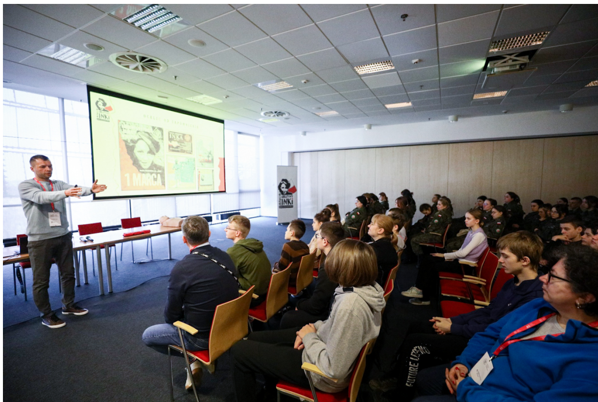
Warsztaty „Drużyna Inki” na Kongresie Pamięci Narodowej – Warszawa, 13 kwietnia 2023.