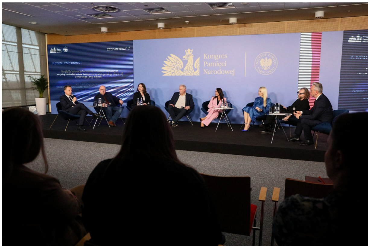
Panel dyskusyjny „Immersyjna edukacja historyczna” podczas Kongresu Pamięci Narodowej – Warszawa, 13 kwietnia 2023.