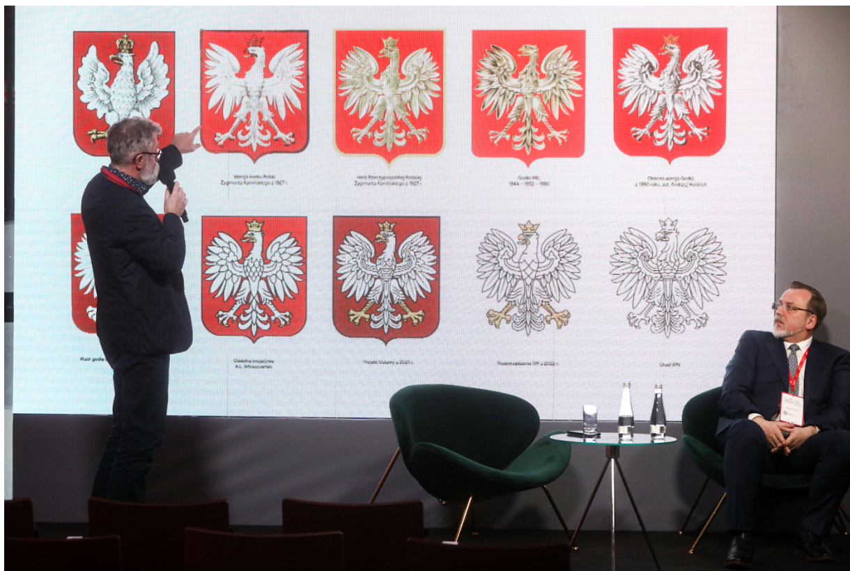
Panel dyskusyjny „Symbole tożsamości narodowej okiem twórców” podczas Kongresu Pamięci Narodowej – Warszawa, 13 kwietnia 2023.