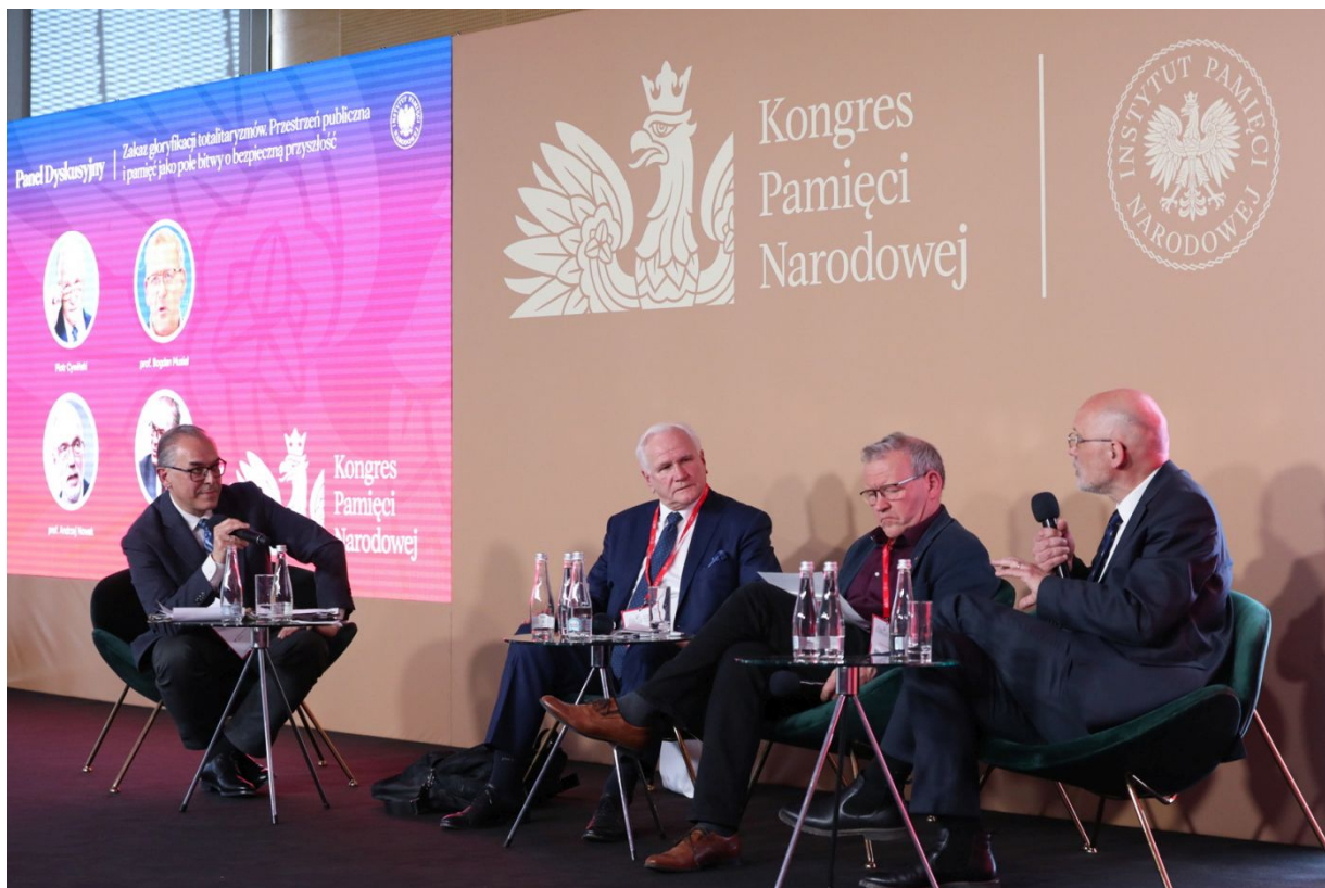
Panel „Zakaz gloryfikacji totalitaryzmów. Przestrzeń publiczna i pamięć jako pole bitwy o bezpieczną przyszłość” – Warszawa, 13 kwietnia 2023.