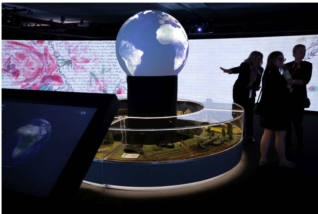
Wystawa „Szlaki Nadziei. Odyseja Wolności” podczas Kongresu Pamięci Narodowej – Warszawa, 13 kwietnia 2023.