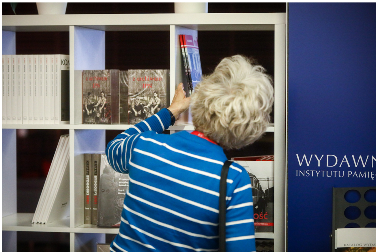
Strefa Wydawnictwa IPN na Kongresie Pamięci Narodowej - Warszawa, 13 kwietnia 2023.