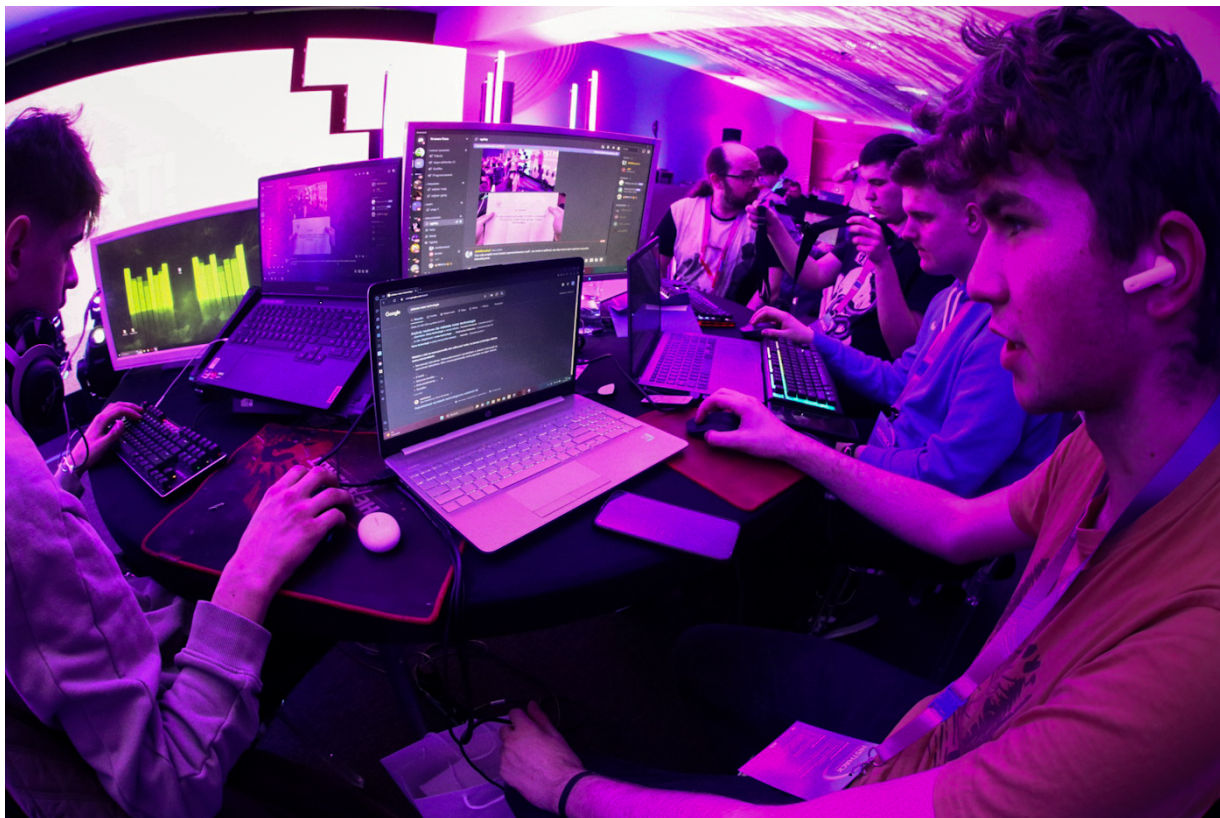
Kongres Pamięci Narodowej: początek „HistHacku” – pierwszego w dziejach hackathonu organizowanego przez IPN – Warszawa, 13 kwietnia 2023.