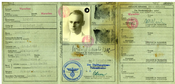
Kenkarta Witolda Pileckiego na nazwisko Smoliński.