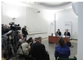
Konferencja prasowa prezesa IPN Janusza Kurtyki – 6 kwietnia 2010.