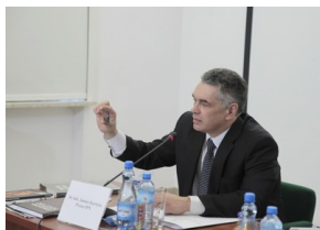
Konferencja prasowa prezesa IPN Janusza Kurtyki – 6 kwietnia 2010.

Była to ostatnia konferencja prasowa Janusza Kurtyki. 10 kwietnia 2010 roku prezes IPN zginął w katastrofie samolotu prezydenckiego w Smoleńsku, w drodze na uroczystości upamiętniające 70. rocznicę Zbrodni Katyńskiej. Na pokład samolotu zabrał egzemplarze pierwszego wydania książki Zbrodnia Katyńska. W kręgu prawdy i kłamstwa , wraz z katyńskim numerem „Biuletynu IPN” .