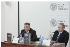
Konferencja prasowa prezesa IPN Janusza Kurtyki – 6 kwietnia 2010.

Polecamy prezentowaną wtedy publikację: Zbrodnia Katyńska. W kręgu prawdy i kłamstwa pod red. Sławomira Kalbarczyka