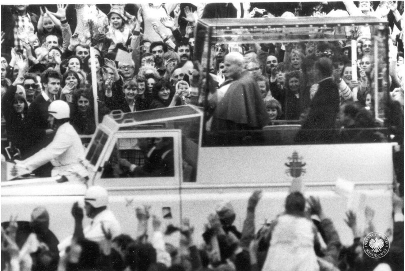
Druga pielgrzymka Jana Pawła II do Ojczyzny. Papamobile z Janem Pawłem II w środku na Placu Trzech Krzyży

Rozważania do młodzieży w czasie Apelu Jasnogórskiego (fragment), 18 czerwca 1983 r.