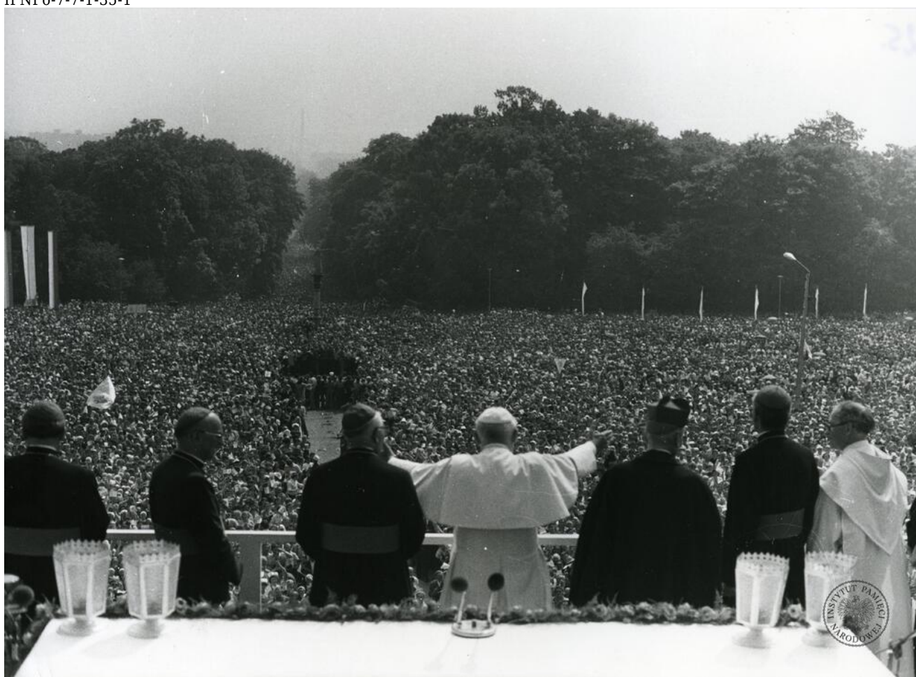
Sanktuarium Matki Bożej Częstochowskiej na Jasnej Górze. Papież Jan Paweł II pozdrawia wiernych z podium ołtarza