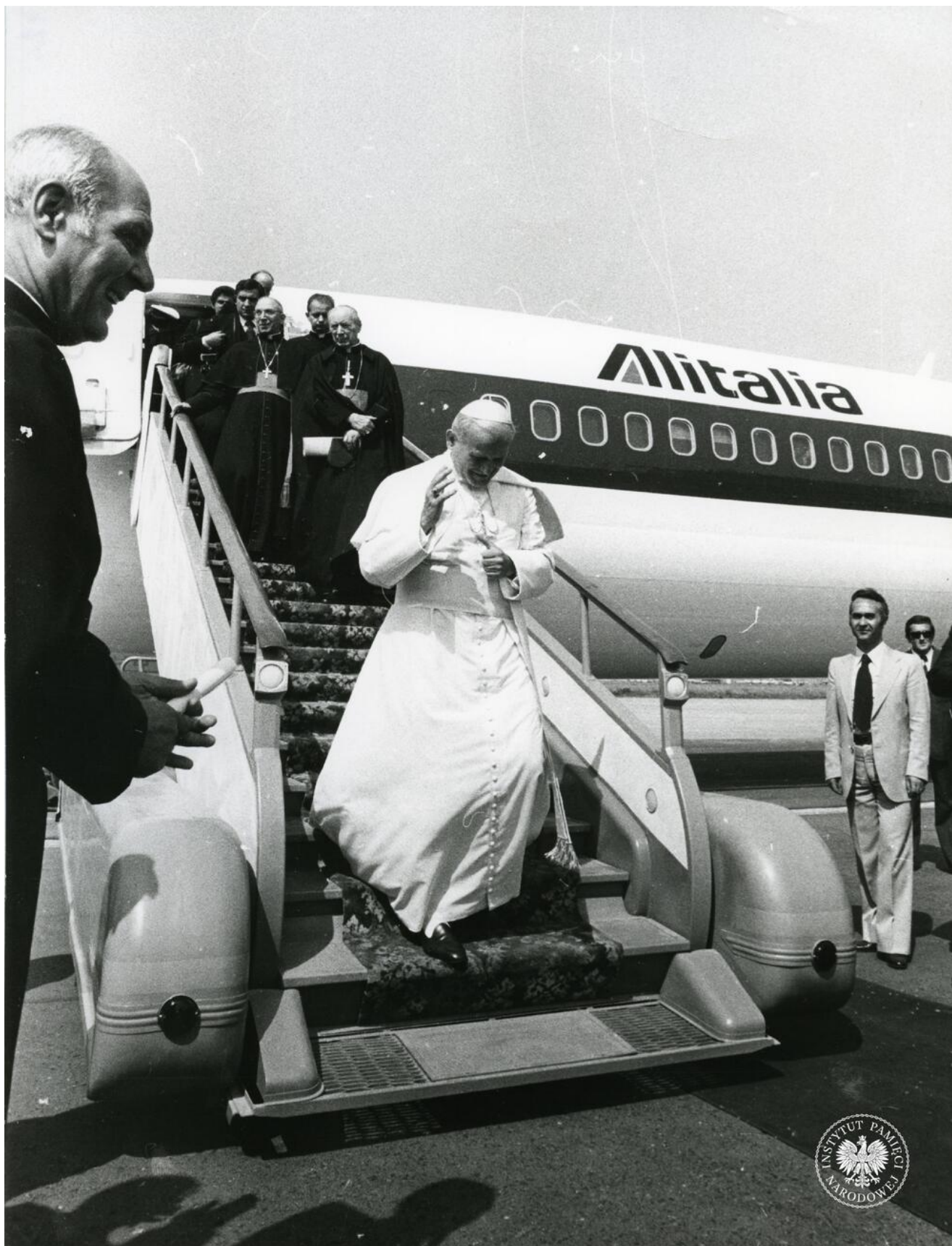
Pielgrzymka Jana Pawła II w 1979 r. do Polski. Jan Paweł II schodzi po schodach samolotu włoskich linii lotniczych Alitalia na lotnisku w Warszawie, za papieżem kard. Stefan Wyszyński