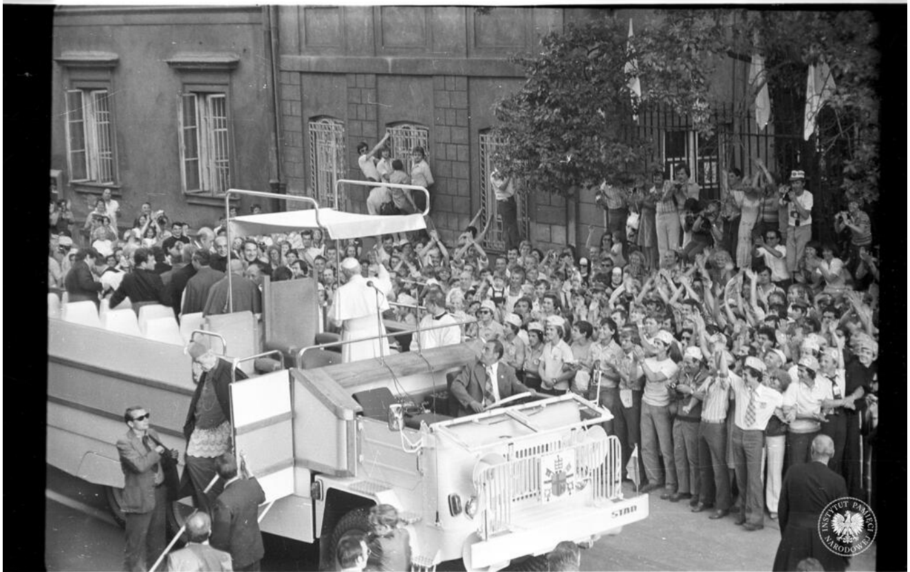
Główne wejście do siedziby prymasa Polski przy ul. Miodowej 17-19 w Warszawie przed i podczas pierwszej pielgrzymki papieża Jana Pawła II do Polski. Zdjęcia wykonane z punktu zakrytego kryptonim „Kopuła” w ramach operacji „Lato 79”