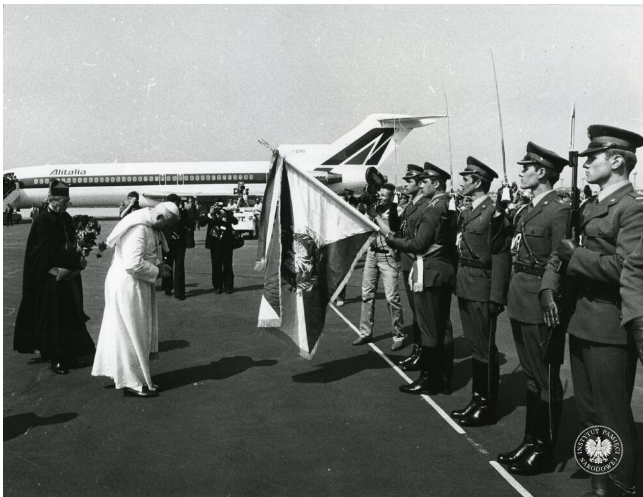
Pielgrzymka Jana Pawła II w 1979 r. do Polski. Jan Paweł II oddaje honory przed pocztem sztandarowym Kompanii Reprezentacyjnej Wojska Polskiego. Po lewej stronie stoi kard. Stefan Wyszyński