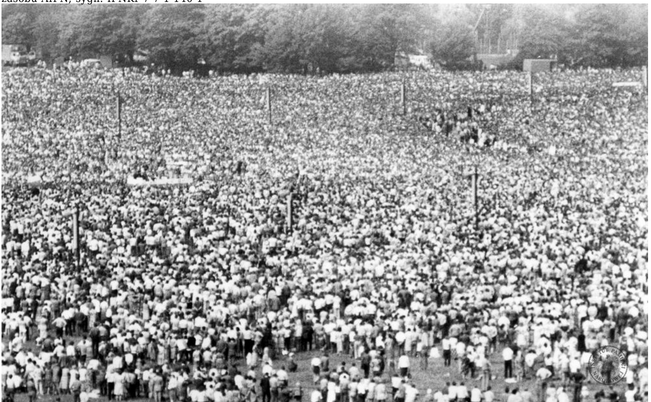
Tłum wiernych zgromadzony na krakowskich Błoniach, przed lub po Mszy świętej, celebrowanej przez papieża Jana Pawła II w ostatnim dniu jego pierwszej pielgrzymki do Ojczyzny, 10 czerwca 1979 r.