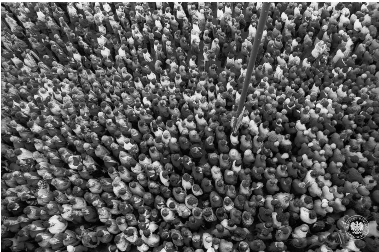
Ludzie zebrani na placu Zamkowym w Warszawie po zamachu na papieża Jana Pawła II, maj 1981 r.