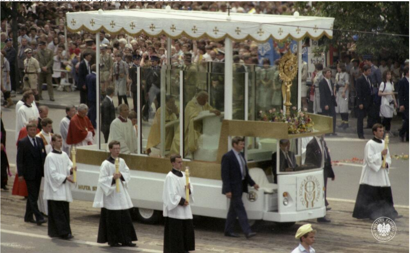
Trzecia pielgrzymka Jana Pawła II do Polski. Jan Paweł II kłęczy w samochodzie przed monstrancją z Najświętszym Sakramentem, ul. Marszałkowska w Warszawie. Obserwacja operacyjna w ramach operacji Zorza II prowadzona na ulicach Warszawy w czasie trzeciej pielgrzymki papieża Jana Pawła II do Polski