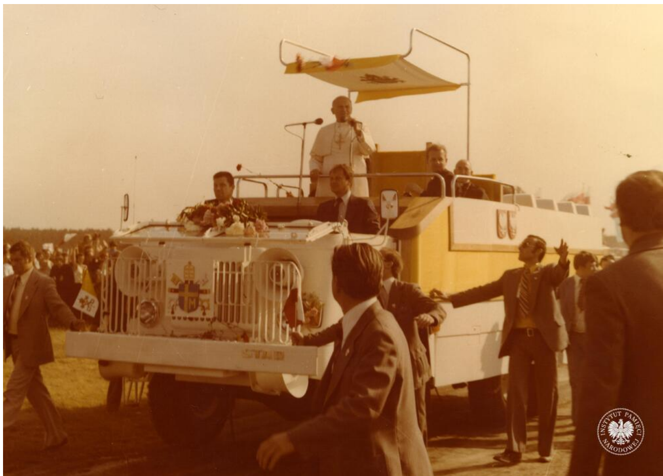
Pierwsza pielgrzymka Jana Pawła II do Polski. Papież Jan Paweł II w samochodzie papieskim, którym poruszał się wśród wiernych, 3 czerwca 1979 r.

Po zamachu na Jana Pawła II: maj 1981 rok