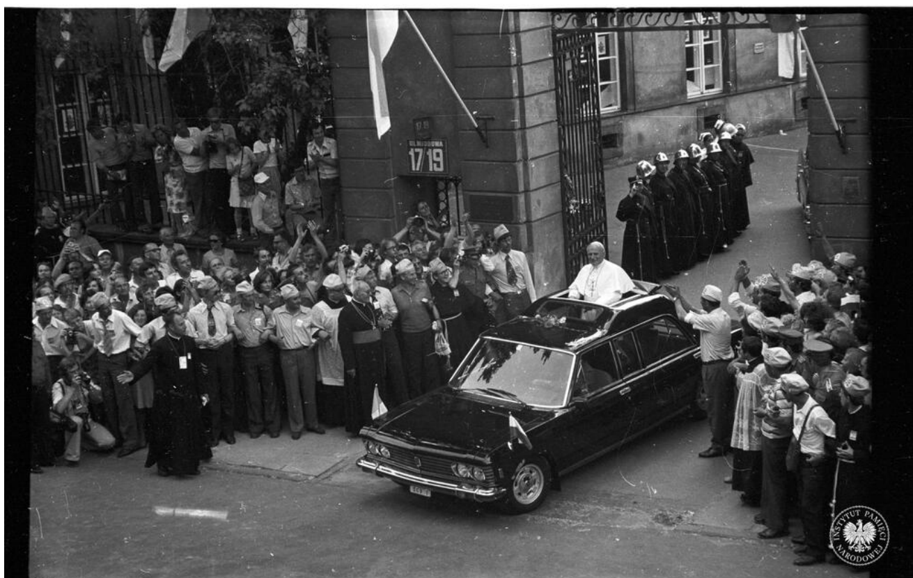
Główne wejście do siedziby prymasa Polski przy ul. Miodowej 17-19 w Warszawie przed i podczas pierwszej pielgrzymki papieża Jana Pawła II do Polski. Zdjęcia wykonane z punktu zakrytego kryptonim „Kopuła” w ramach operacji „Lato 79”, z