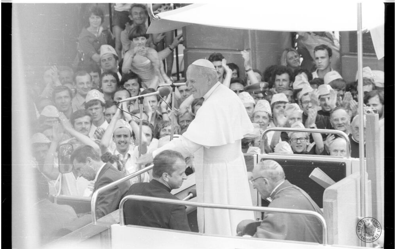
Główne wejście do siedziby prymasa Polski przy ul. Miodowej 17-19 w Warszawie przed i podczas pierwszej pielgrzymki papieża Jana Pawła II do Polski. Zdjęcia wykonane z punktu zakrytego kryptonim „Kopuła” w ramach operacji „Lato 79”