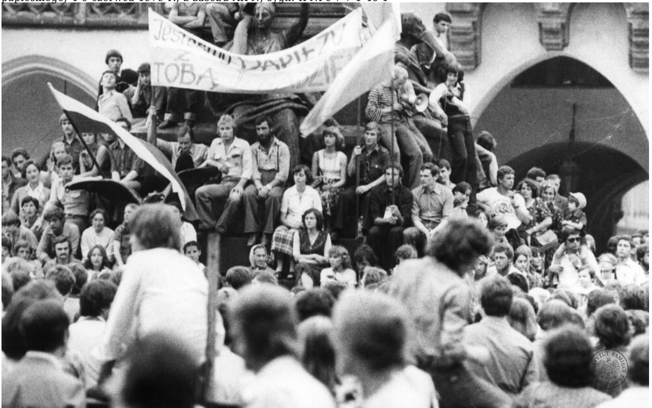
Grupa ludzi na cokole pomnika Adama Mickiewicza w dniu przybycia do kościoła Mariackiego papieża Jana Pawła II. Widoczny transparent z hasłem: „Jesteśmy z Tobą Papieżu nadziei”. Na ostatnim planie Sukiennice, 9 czerwca 1979 r.

papieskiego, 4-6 czerwca 1979 r., z zasobu AIPN, sygn. IPNPo-7-7-1-46-1