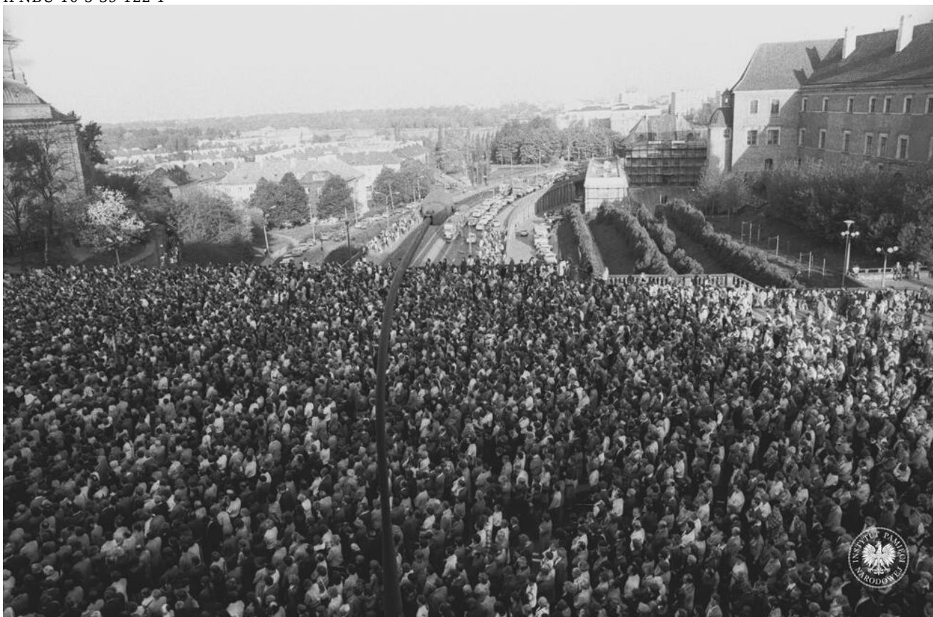
Ludzie zebrani na placu Zamkowym w Warszawie po zamachu na papieża Jana Pawła II