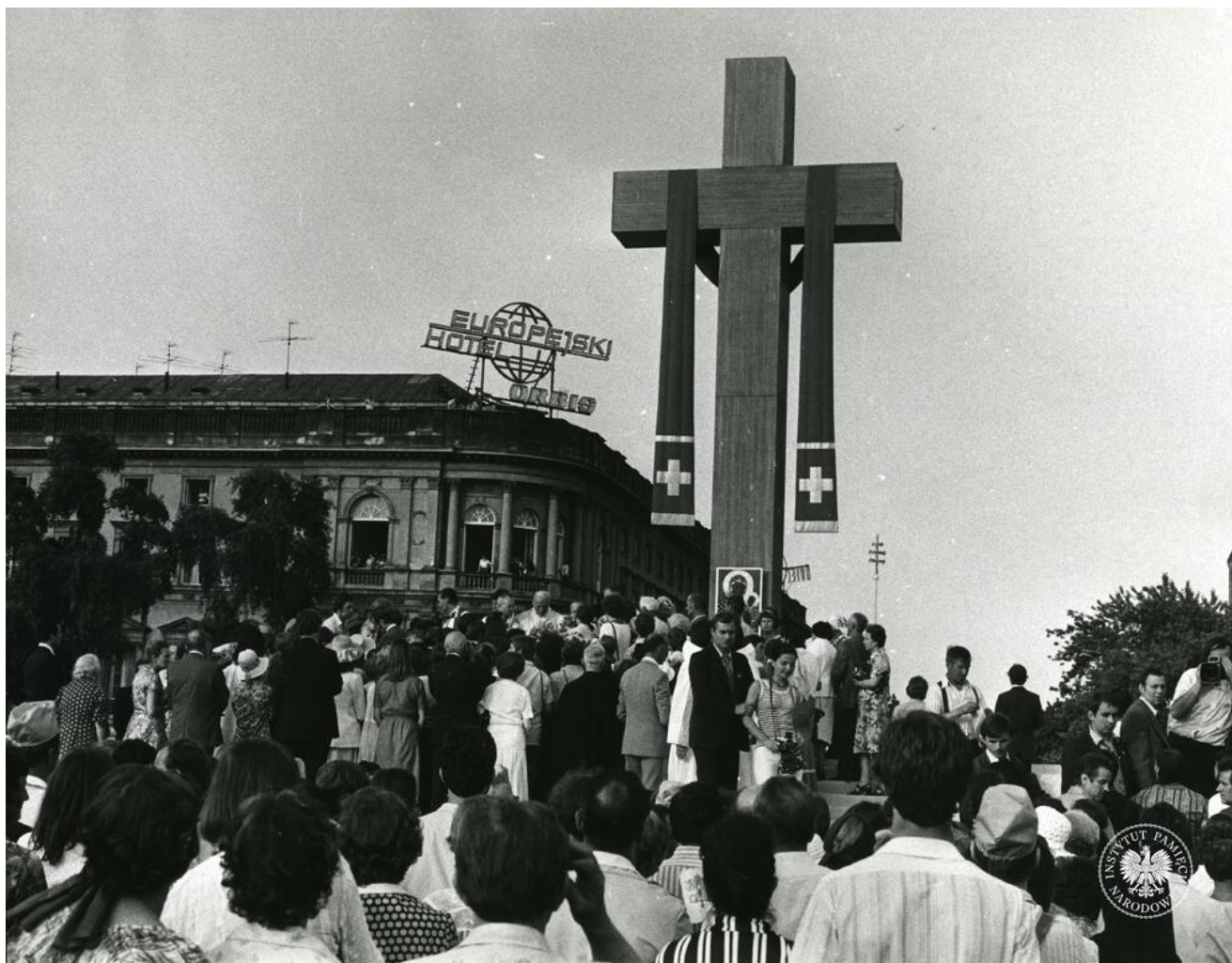
Pielgrzymka Jana Pawła II w 1979 r. do Polski, Msza św. na placu Zwycięstwa w Warszawie, 2 czerwca 1979 r.