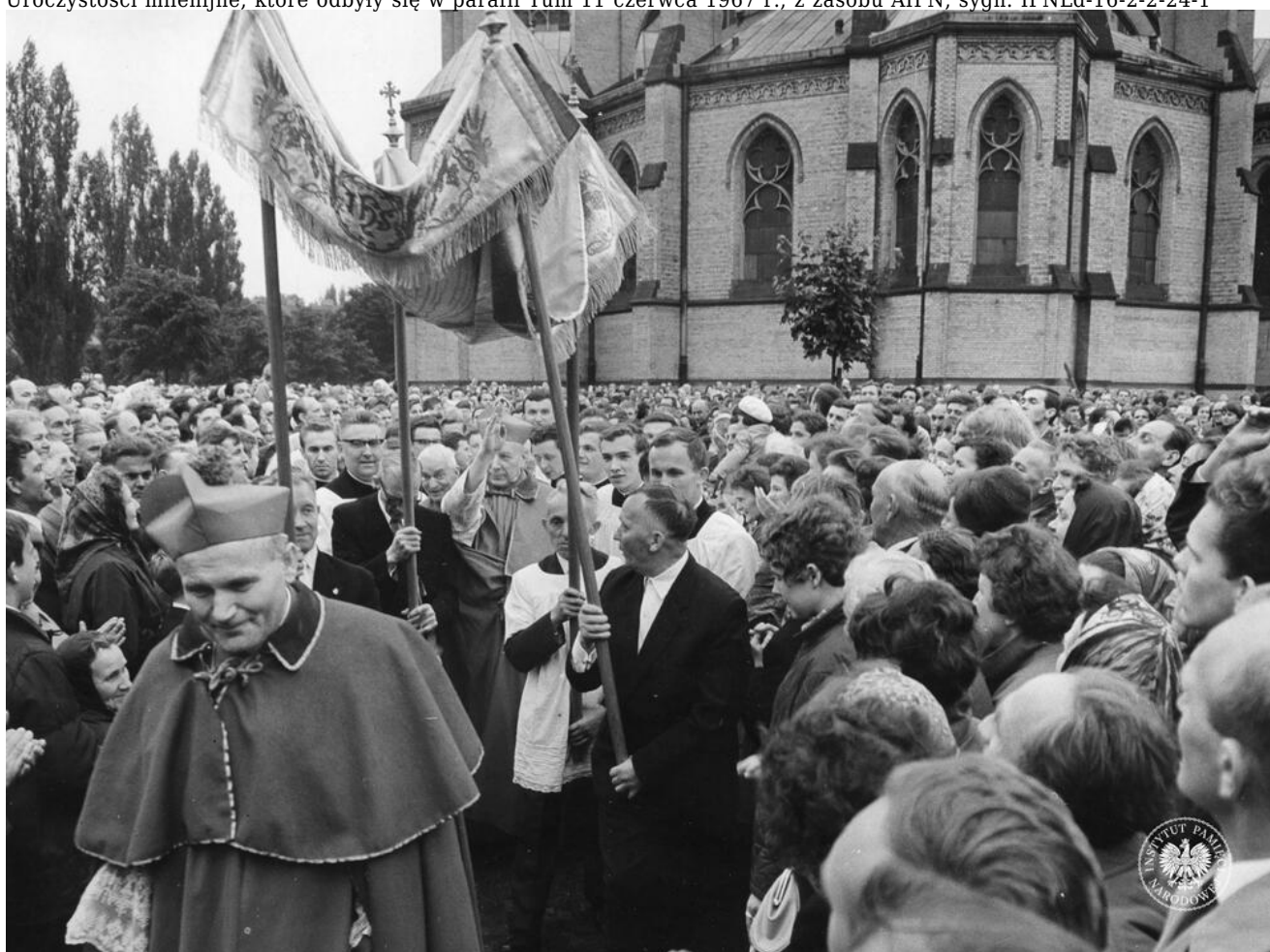
Uroczystości milenijne, które odbyły się w parafii Tum 11 czerwca 1967 r.