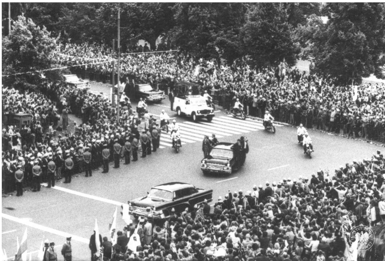
Druga pielgrzymka Jana Pawła II do Ojczyzny. Kolumna samochodów papieskich, Jan Paweł II widoczny w papamobile w asyście milicji na motocyklach, przejeżdża wśród tłumów rozstawionych po obu stronach ulicy na skrzyżowaniu ulic Wawelskiej i Zwirki i Wigury przed pomnikiem Lotnika.