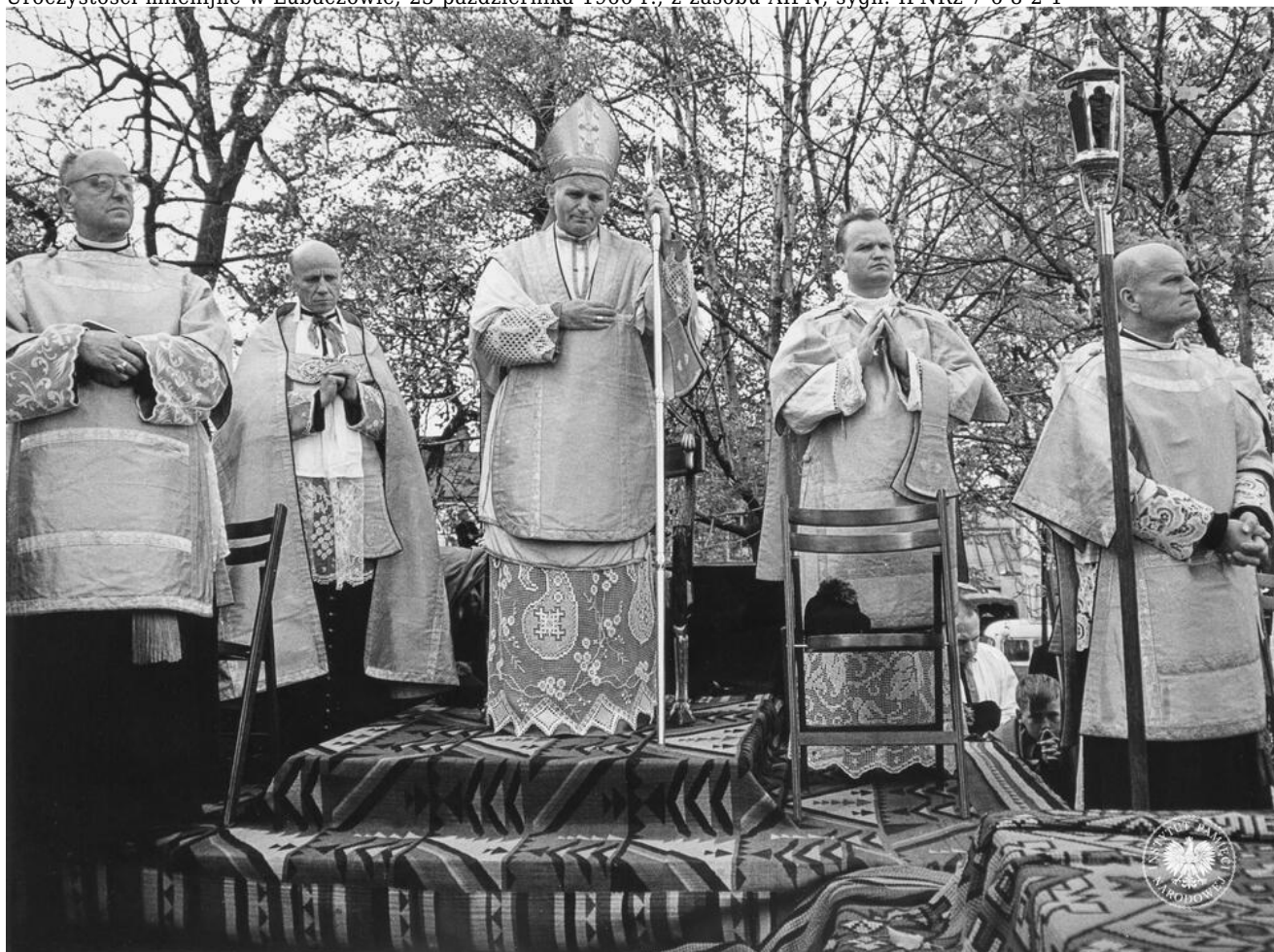
Uroczystości milenijne w Lubaczowie, 23 października 1966 r.