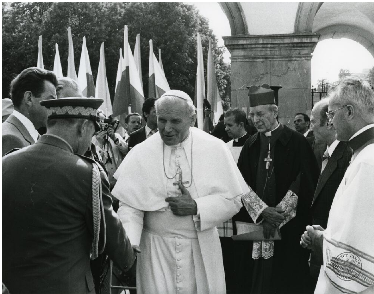
Papież Jan Paweł II wita się z delegacją przedstawicieli władz państwowych i wojskowych przy grobie Nieznanego Żołnierza w Warszawie. Za Papieżem stoi kard. Stefan Wyszyński