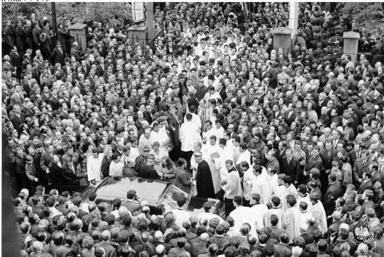
Pieszne pielgrzymki kobiet i mężczyzn do Piekar Śląskich w dniach 27 maja oraz 19 sierpnia 1973 r., w śródku kard. Karol Wojtyła