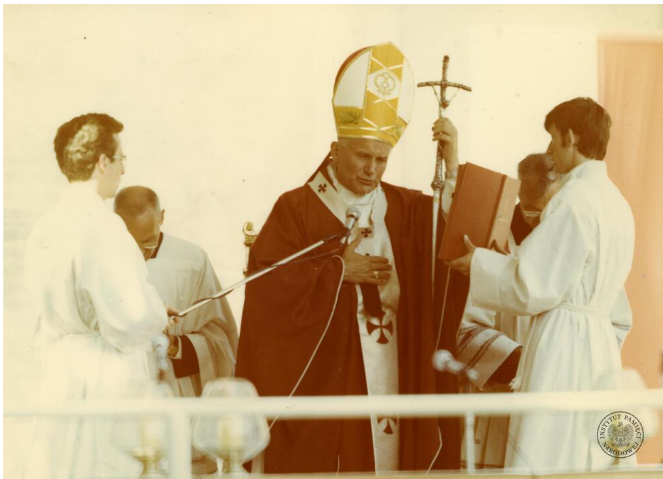
Papież Jan Paweł II w otoczeniu duchowieństwa podczas odprawiania Mszy św. na Wzgórzu Lecha, 3 czerwca 1979 r.