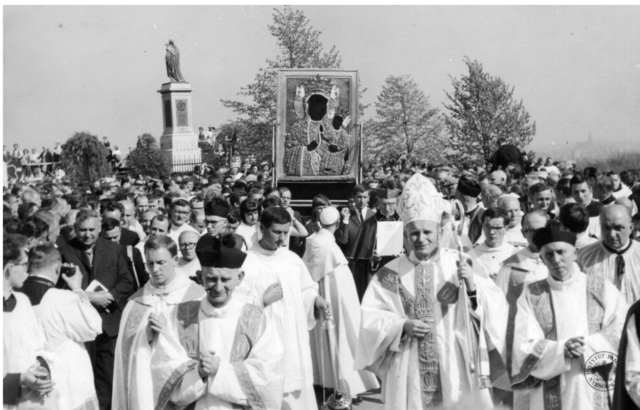
Arcybiskup Karol Wojtyła prowadzi procesję podczas centralnych uroczystości milenijnych na Jasnej Górze, 3 maja 1966 r.