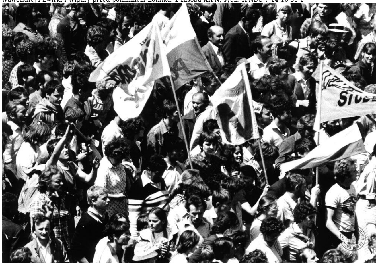
Druga pielgrzymka Jana Pawła II do Polski. Nabożeństwo poświęcenia kościoła parafialnego pw. św. Maksymiliana Marii Kolbego w Mistrzejowicach

III pielgrzymka Jana Pawła II do Polski, 8-14 czerwca 1987 r.