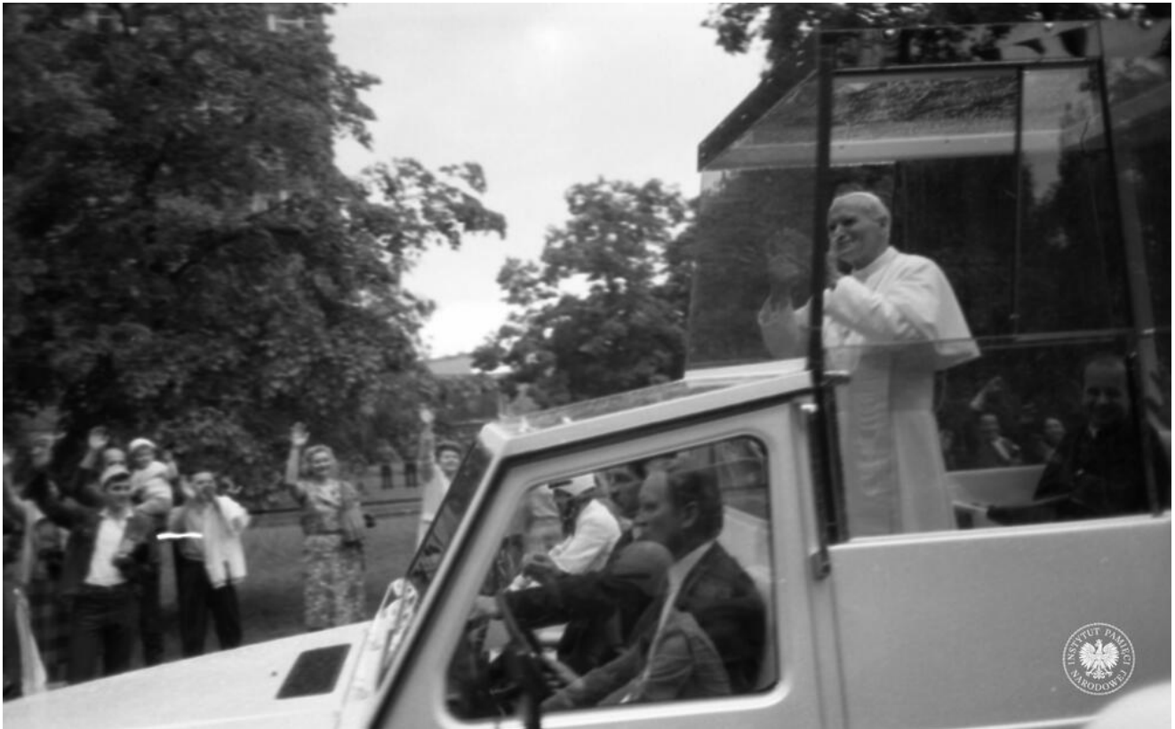
Trzecia pielgrzymka Jana Pawła II do Polski. Fragment ulicy Żwirki i Wigury w Warszawie. Na pierwszym planie jadące w stronę lotniska Okęcie papamobile Mercedes-Benz W460 G230 (nr rej. SCV 7) widać Ojca Świętego

Homilia Jana Pawła II do młodzieży na Westerplatte (fragmenty), 12 czerwca 1987 r.