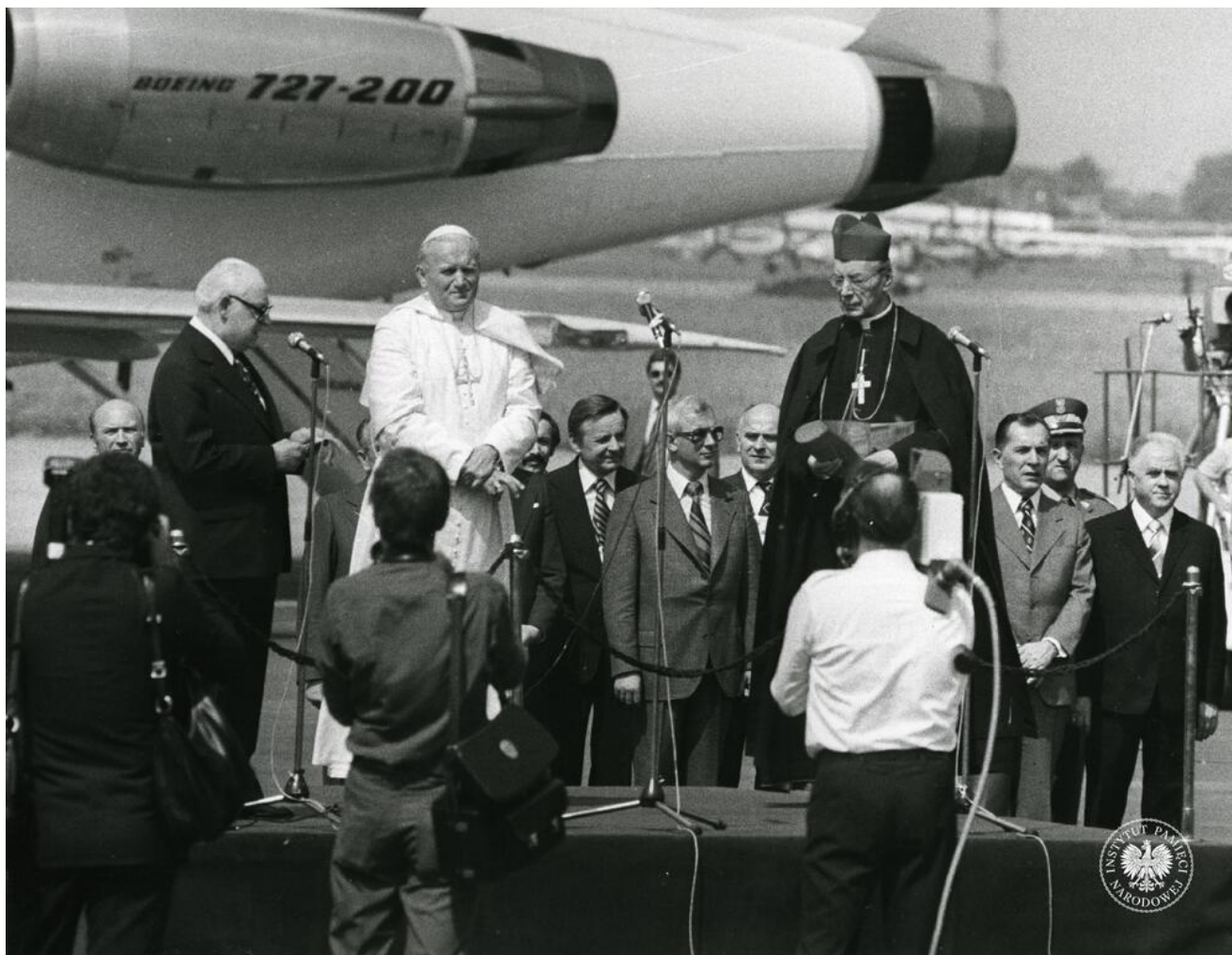
Pierwsza pielgrzymka Jana Pawła II do Ojczyzny. Powitanie Papieża Jana Pawła II na lotnisku w Warszawie. Mowę powitalną czyta przedstawiciel władz państwowych Henryk Jabłoński. Po lewej stronie Papieża stoi kard. Stefan Wyszyński