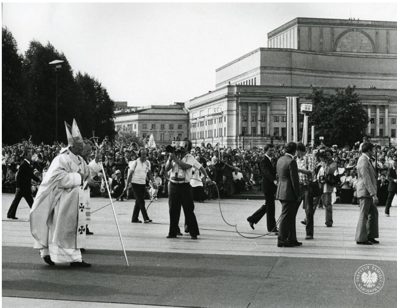
Pierwsza pielgrzymka Jana Pawła II do Polski, 2 czerwca 1979 r., Ojciec Święty Jan Paweł II przechadza się wzdłuż sektorów na Placu Zwycięstwa