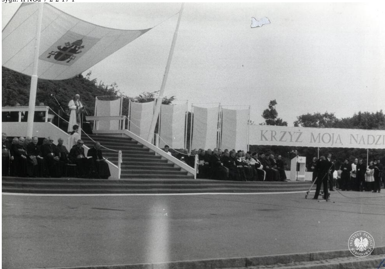
Trzecia pielgrzymka Jana Pawła II do Polski. Papież Jan Paweł II na Westerplatte w czasie wizyty w Polsce w 1987 r. Na transparencie napis: „Krzyż moją Nadzi[eją]”, 12 czerwca 1987 r.