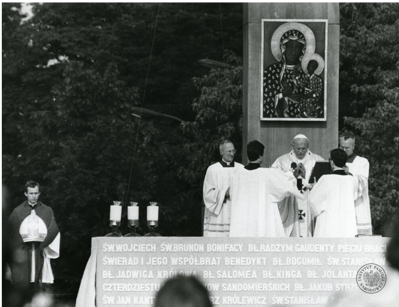
Pierwsza pielgrzymka do Ojczyzny. Na Placu Zwycięstwa w Warszawie Ojciec Święty prawdopodobnie odczytuje fragmenty z mszału w asyście czterech duchownych