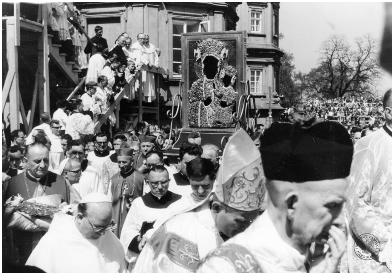
Centralne uroczystości milenijne na Jasnej Górze, 3 maja 1966 r.