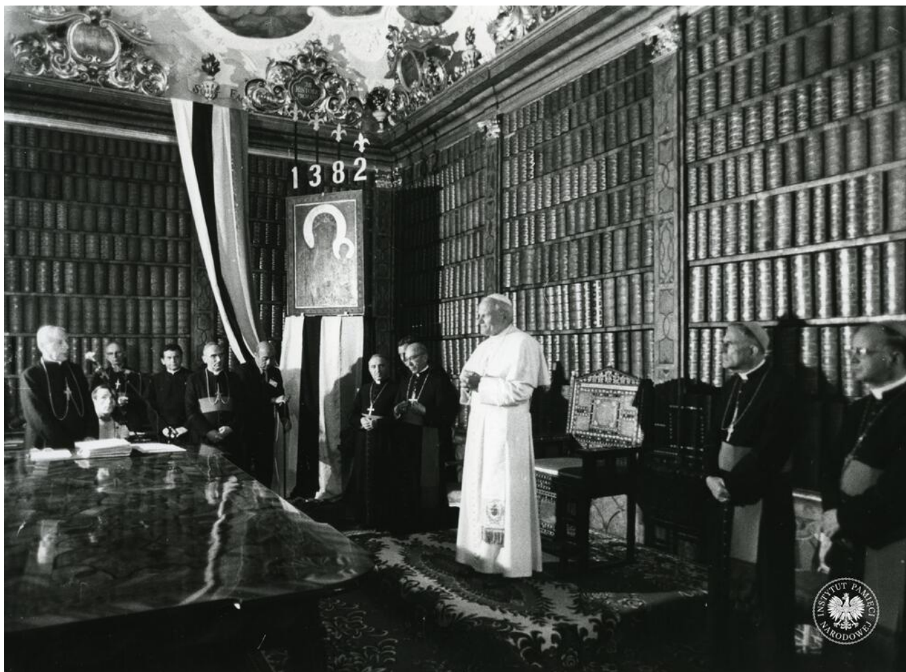
Fotografia przedstawia Konferencję Episkopatu Polski z udziałem Jana Pawła II w sali biblioteki klasztoru OO. Paulinów na Jasnej Górze., 4-6 czerwca 1979 r.