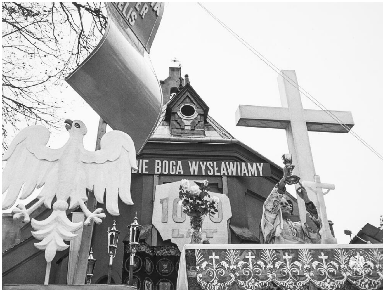
Uroczystości milenijne w Lubaczowie, abp Karol Wojtyła, 23 października 1966 r.