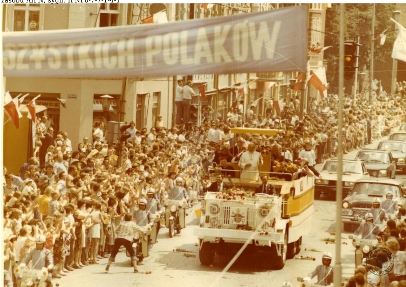
Pierwsza pielgrzymka Jana Pawła II do Polski. Przejazd Papieża Jana Pawła II ulicami Gniezna, 3 czerwca 1979 r.