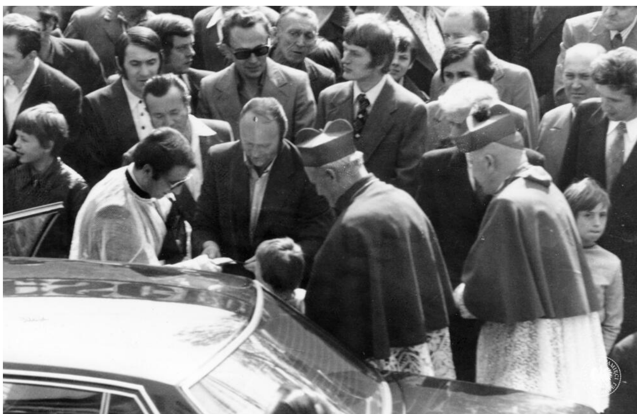
Pielgrzymka mężczyzn do Piekar Śląskich 29 maja 1977 r., w środku kard. Karol Wojtyła