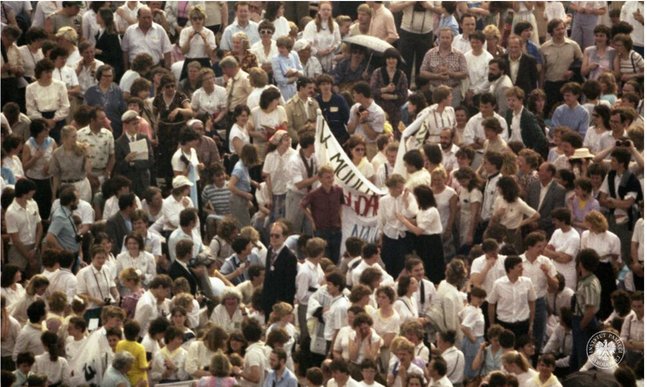
Trzecia pielgrzymka Jana Pawła II do Polski. Tłum pielgrzymów z transparentami na ulicach Warszawy. Obserwacja operacyjna w ramach operacji Zorza II prowadzona na ulicach Warszawy w czasie trzeciej pielgrzymki papieża Jana Pawła II do Polski