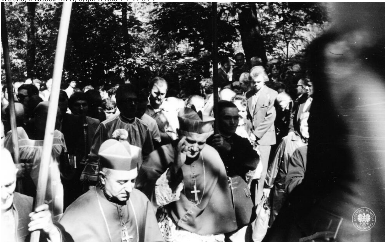
Pielgrzymka mężczyzn do Piekar Śląskich, 29 maja 1977 r., w śródku kard. Karol Wojtyła