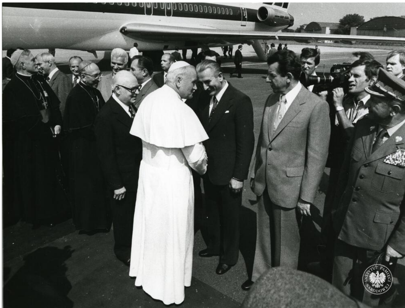
Pierwsza pielgrzymka Jana Pawła II do Polski. Papież Jan Paweł II wita się z delegacją przedstawicieli władz państwowych na lotnisku w Warszawie. Po lewej stronie Papieża stoi Henryk Jabłoński