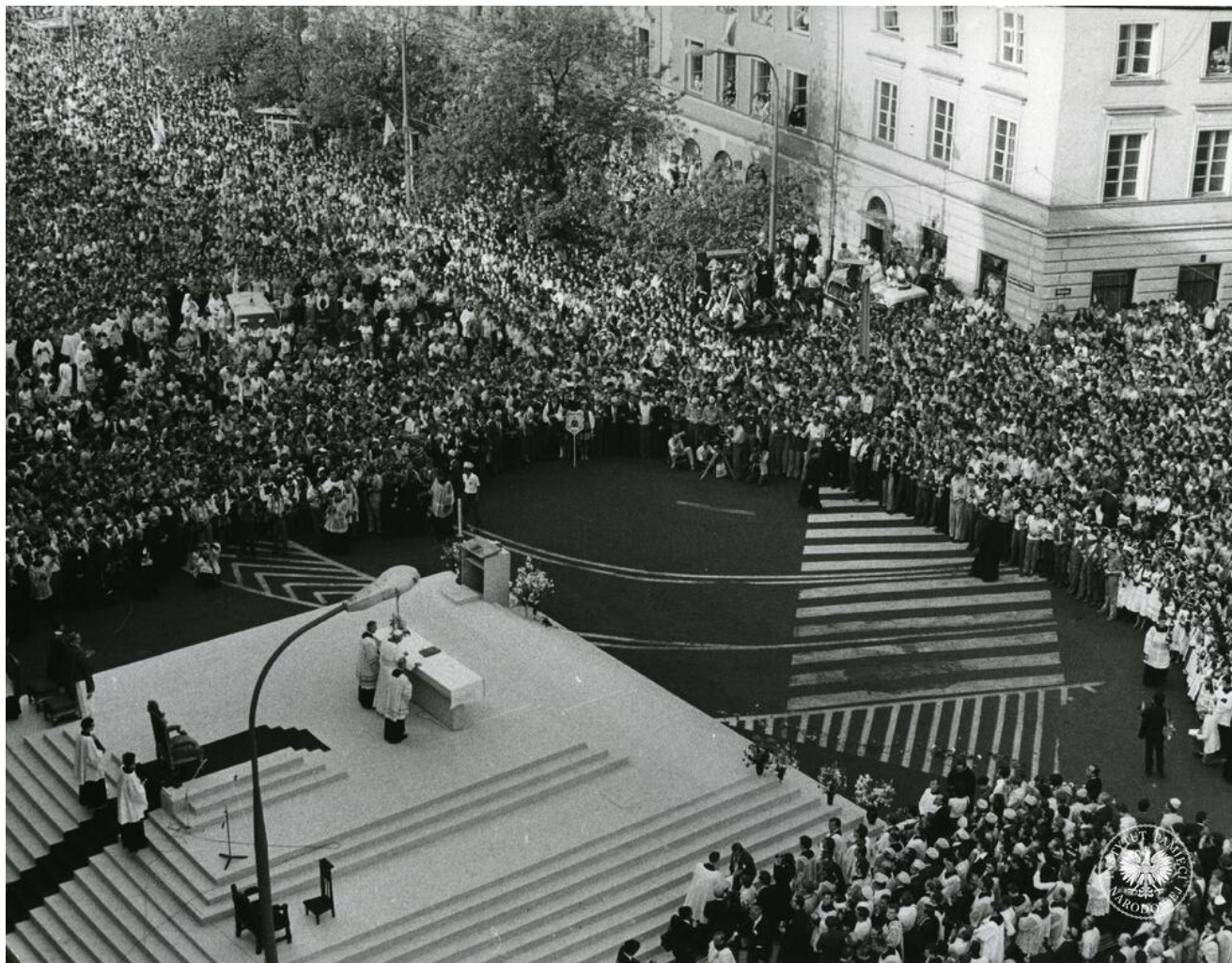
Pierwsza pielgrzymka Jana Pawła II do Ojczyzny. Spotkanie Ojca Świętego Jana Pawła II z liczną grupą młodzieży, podczas sprawowanej dla niej Mszy św. przed kościołem św. Anny w Warszawie