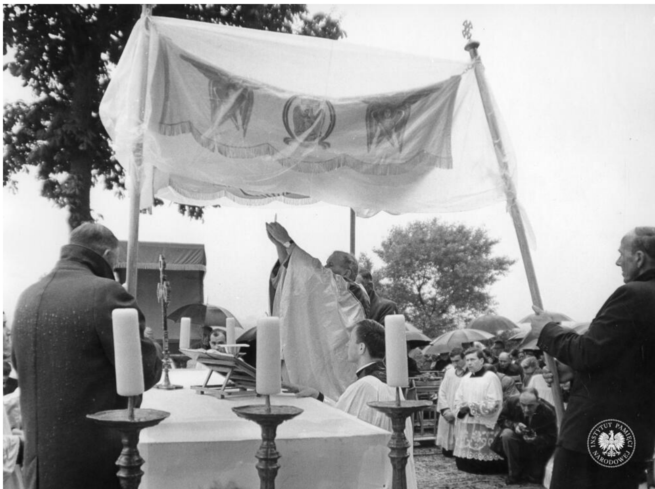
Uroczystości milenijne, które odbyły się w parafii Tum 11 czerwca 1967 r.