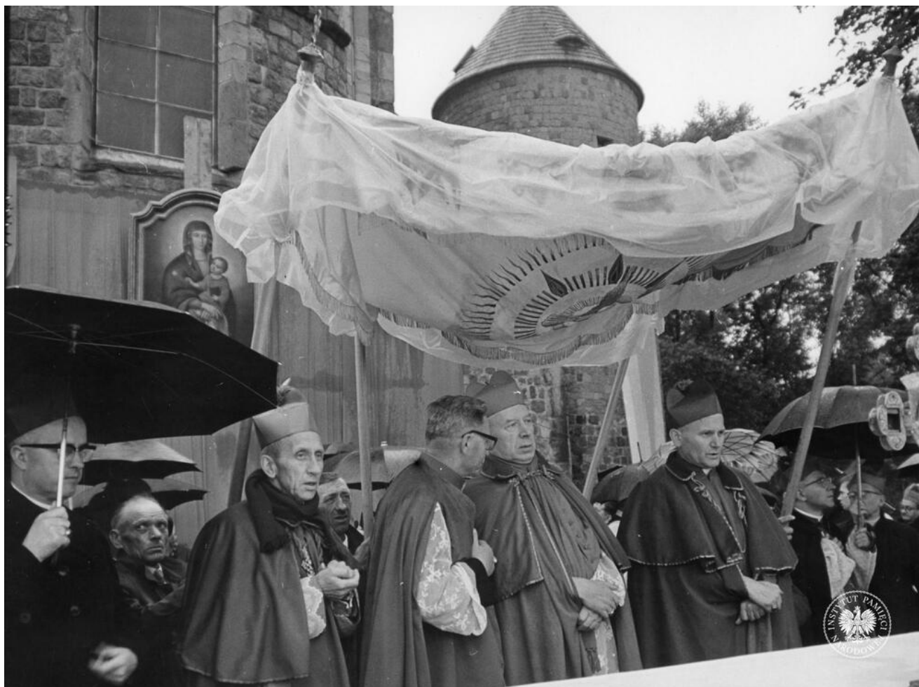
Uroczystości milenijne, które odbyły się w parafii Tum 11 czerwca 1967 r.