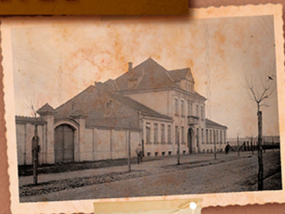
Gmach Polskiego Towarzystwa Radiotechnicznego przy ul. Narbutta 29. Pierwsza rozgłośnia i radiostacja w Polsce.

Pierwsza stacja radiofoniczna na świecie nadająca regularne programy do powszechnego odbioru (radio KDKA w Pittsburghu)