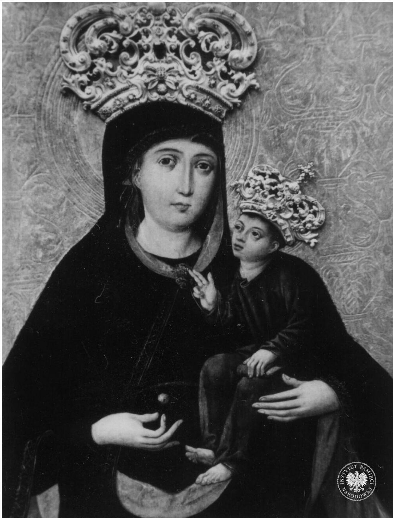
Ukoronowany 9 maja 1965 r. przez abpa Karola Wojtyłę koronami papieskimi obraz Matki Boskiej Świętojańskiej (MB od Wykupu Niewolników, nazwanej przez abpa Wojtyłę Matką Wolności) z kościoła św. Jana Chrzciciela i św. Jana Ewangelisty w Krakowie, 09.05.1965