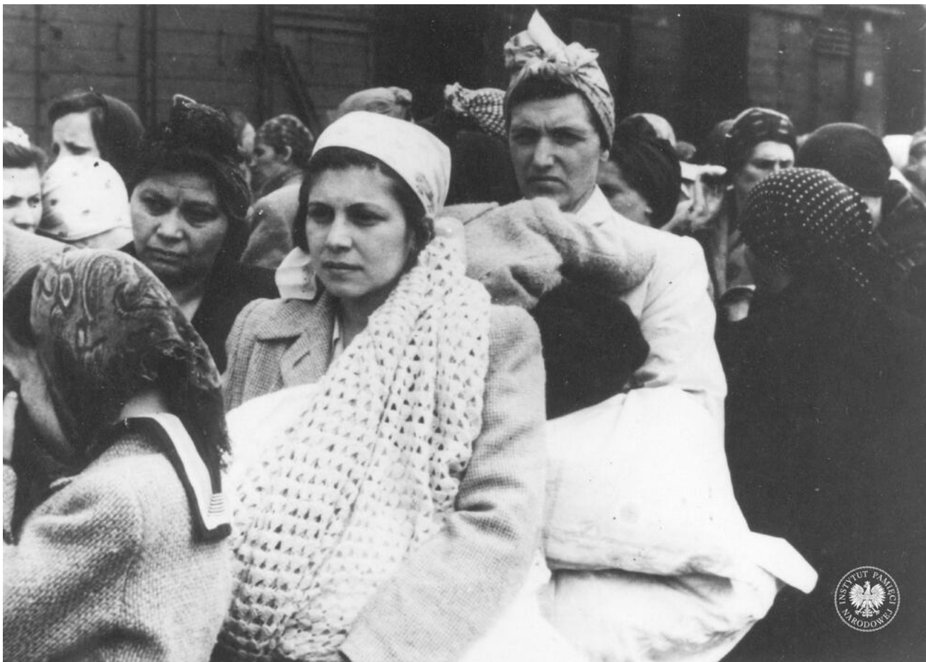
Grupa kobiet (w różnym wieku) stoi na rampie boczniczy kolejowej w obozie zagłady KL Auschwitz-Birkenau po przybyciu transportu Żydów z Węgier(?)