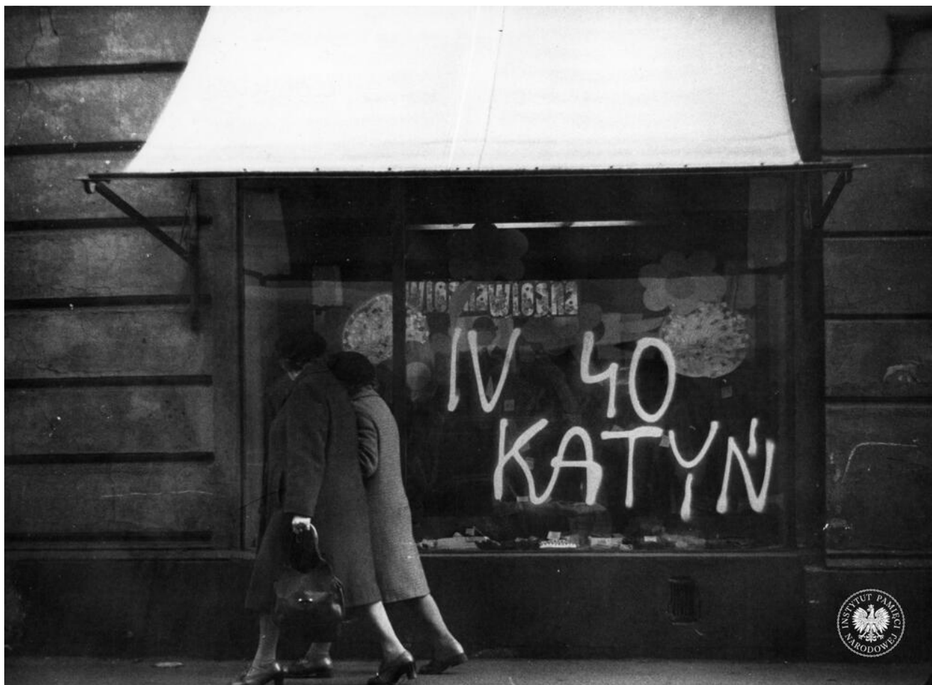
Napis na witrynie sklepowej: IV 40 KATYN (wystawie sklepowej przyglądają się dwie przechodzące obok kobiety). Materiały dokumentujące protest społeczny w Bydgoszczy w związku z wydarzeniami, jakie miały miejsce w lutym i marcu 1981 r., w związku z rejestracją rolniczej „Solidarności”