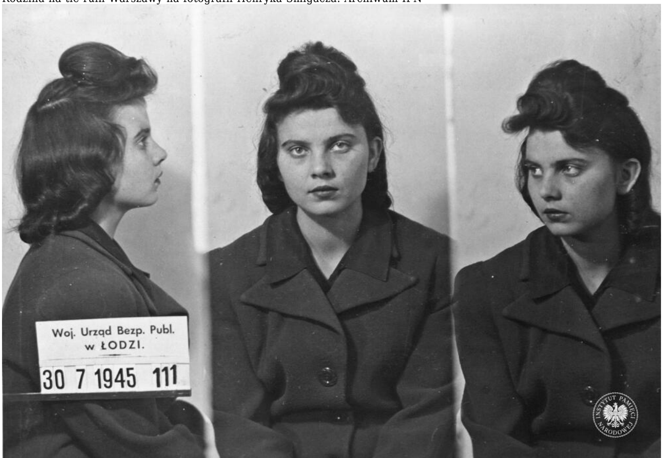
NN kobieta aresztowana 30 lipca 1945 r. przez Wojewódzki Urząd Bezpieczeństwa Publicznego w Łodzi