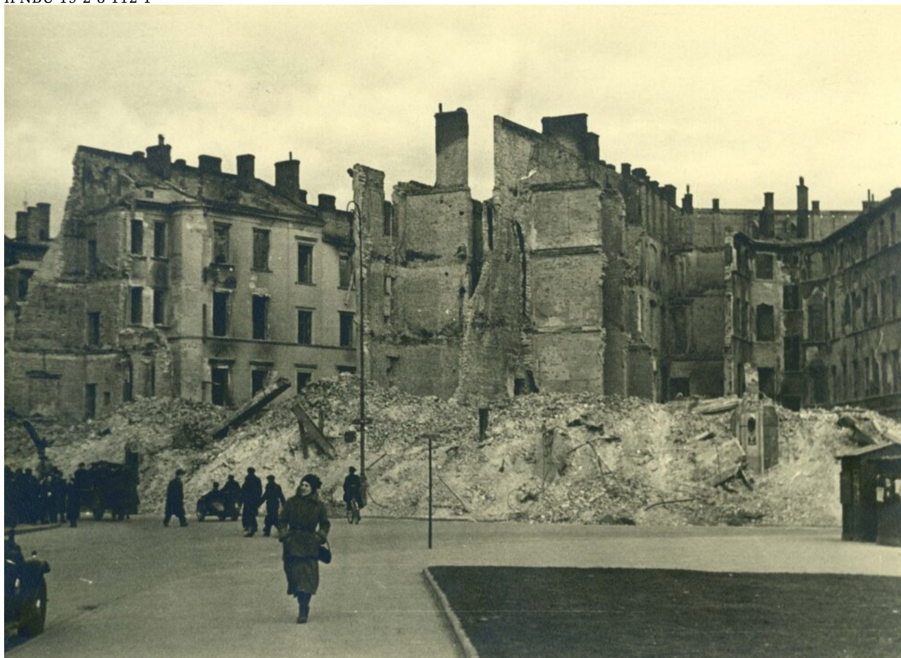
Zniszczona zabudowa północnej pierzei placu Piłsudskiego - widok w kierunku północnym. Widoczne ruiny kamienic przy ul. Wierzbowej 2 i ul. Ossolińskich, fot. Antoni Snawadzki, z zasobu AIPN.