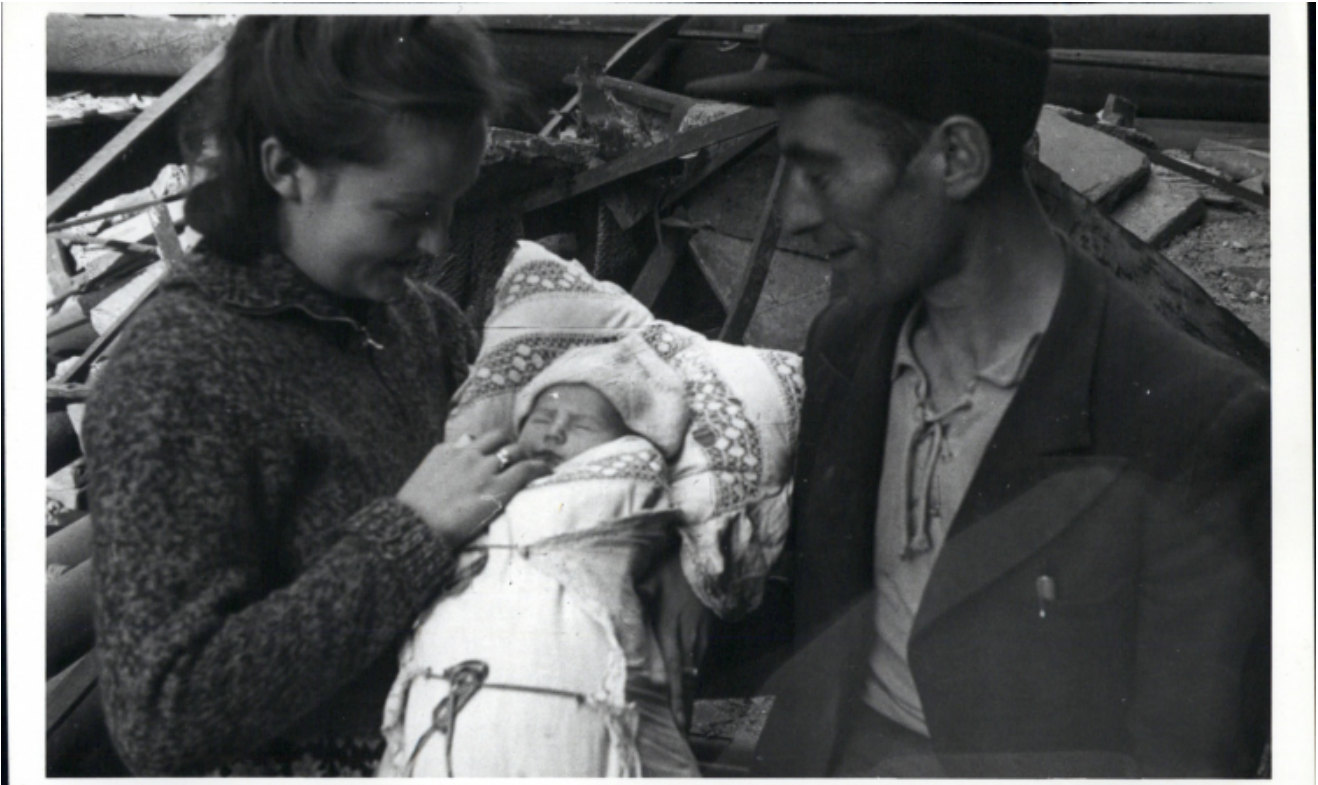
Rodzina na tle ruin Warszawy na fotografii Henryka Śmigacza. Archiwum IPN