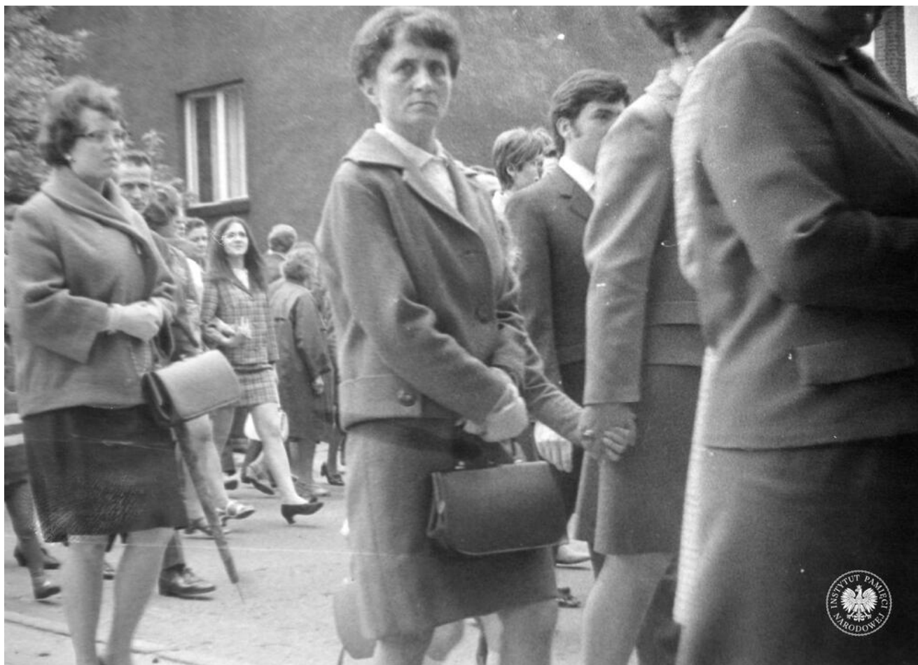
Procesja z okazji Bożego Ciała przechodzi w okolicach ul. Marchlewskiego (obecnie Misjonarzy Oblatów) w Katowicach. Fotografia została wykonana 28.5.1970 r.