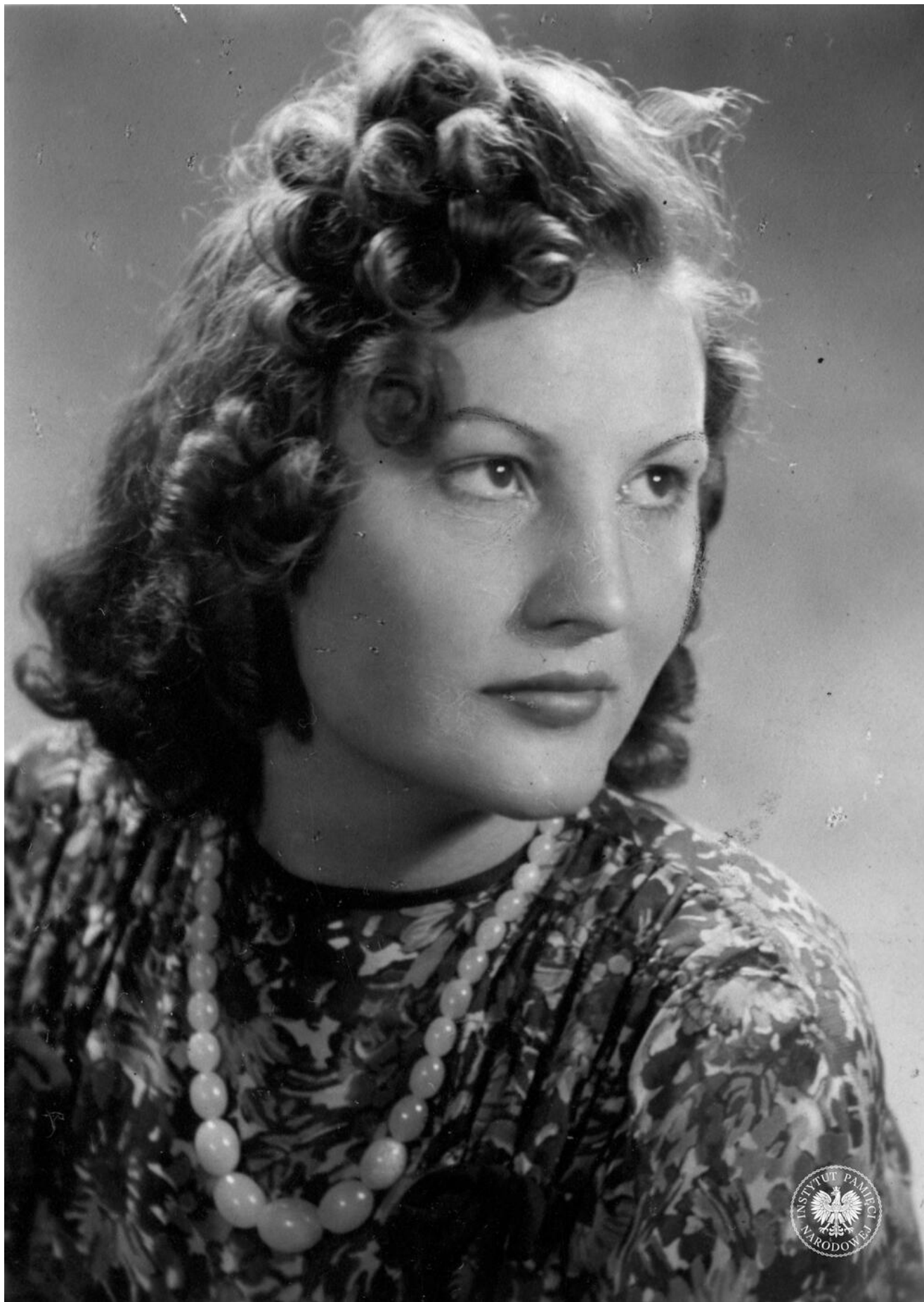
NN kobieta, fotografia portretowa