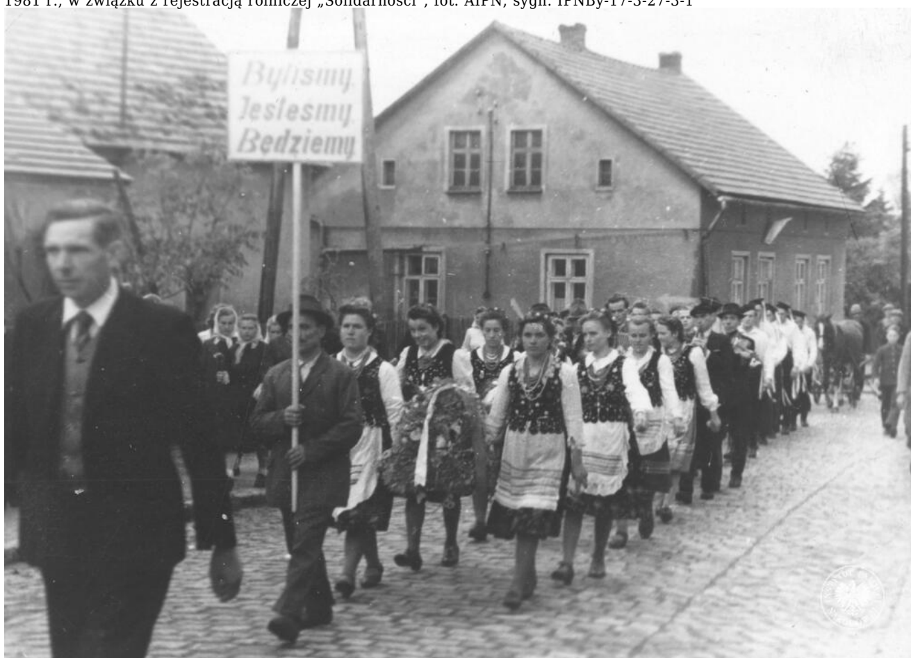
Fotografia z album Państwowego Urzędu Repatriacyjnego Oddział Katowice 1945-1946