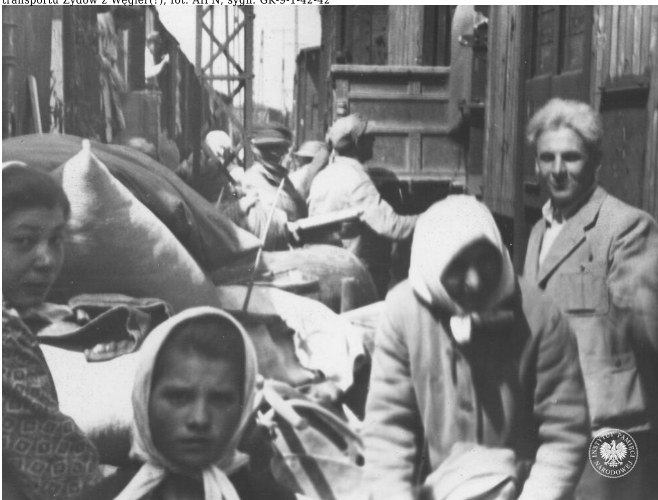
Repatrianci za Buga podczas wyładunku [?] na jednej ze stacji kolejowych