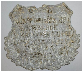
Tabliczka z grobu Józefa Orkisz, odnaleziona podczas prac poszukiwawczych, po konserwacji