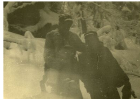
„Wiarusy” w zimowej scenerii, po utracie tzw. bunkra nad Harklową