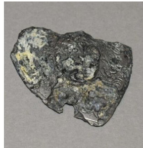
Fragmety ryngrafu odnalezionego przy szczątkach Józefa Orkisz „Lotnego”