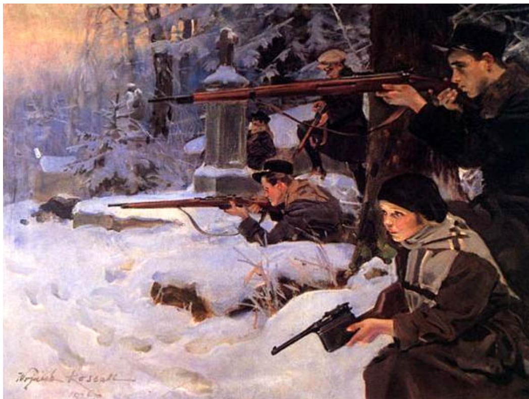
Wojciech Kossak - „Orlęta - obrona cmentarza”.

W okresie międzywojennym przebywał kilkakrotnie w Stanach Zjednoczonych. Z tego okresu pochodzi m.in. „Portret konny generała Johna Pershinga”. Od 1921 r. malował na zamówienie Muzeum Narodowego i nowopowstałego Muzeum Wojska Polskiego. Ponownie w motywach swoich twórczości sięgał do polskich zrywów narodowych - „Kościuszko pod Raclawicami”, „Sowiński na szanclach Woli”, „Orlęta - obrona cmentarza”, ale też głębiej - „Kircholm”, „Grunwald”.