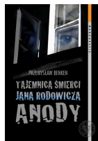
Okładka książki Przemysław Benke „Tajemnica śmierci Jana Rodowicza a »Anody«”