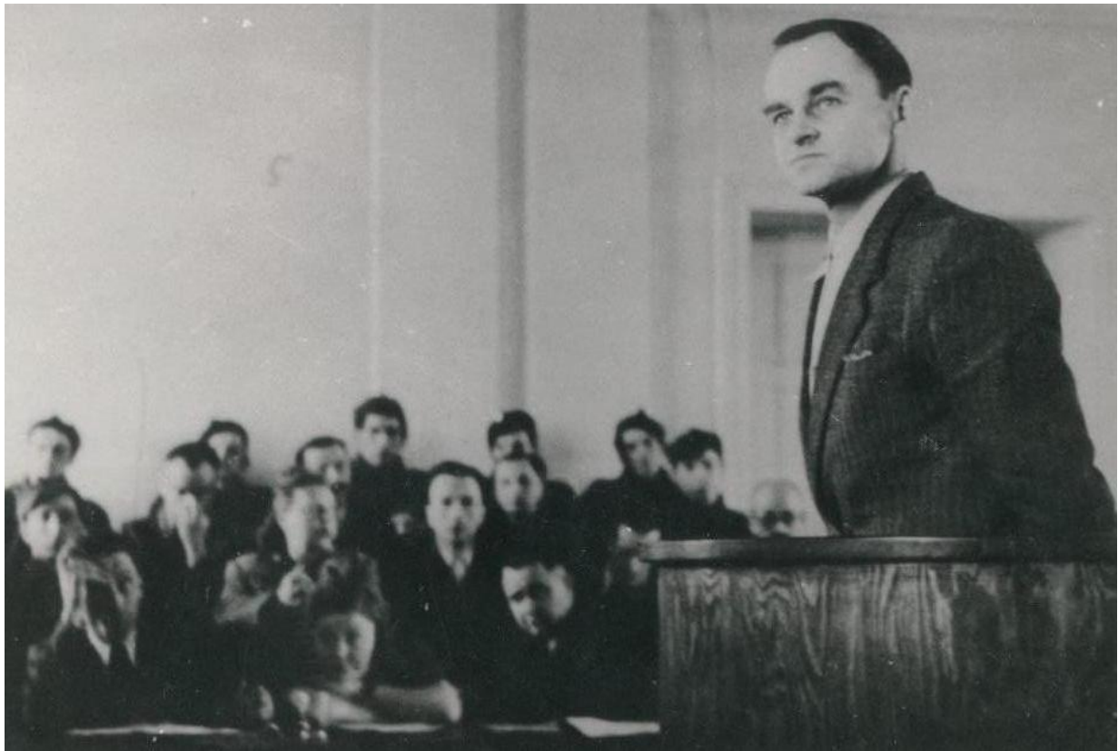
Witold Pilecki przed Wojskowym Sądem Rejonowym w Warszawie.

„Ja już żyć nie mogę, mnie wykończono, Oświęcim to była igraszka” - powiedział w przerwie rozprawy, po brutalnym śledztwie, w więzieniu mokotowskim Witold Pilecki, obrońca Polski z 1920 r., ochotnik do Auschwitz, uczestnik Powstania Warszawskiego i żołnierz 2. Korpusu Polskiego gen. Andersa.