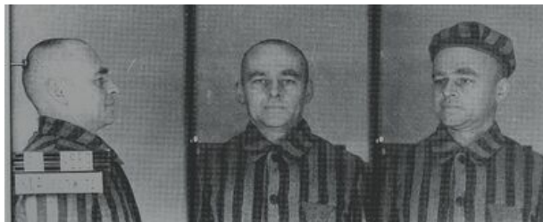
Witold Pilecki w KL Auschwitz

Pilecki zaangażował się w działalność niepodległościową we wczesnej młodości. W czasie II wojny światowej był współzałożycielem i aktywnym członkiem Tajnej Armii Polskiej. Z początkiem 1940 r. rozpoczęły się aresztowania członków TAP. Niemcy wywozili ich do nowo powstałego KL Auschwitz. Kierownictwo organizacji zdecydowało o skierowaniu kogoś do niemieckiego obozu w celu nawiązania kontaktu z uwięzionymi tam członkami TAP, zdobycia informacji wywiadowczych na temat tego miejsca i zorganizowania tam ruchu oporu. Na ochotnika zgłosił się Pilecki.