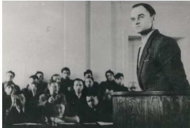
Witold Pilecki przed Wojskowym Sądem Rejonowym w Warszawie.

Człowiek – który jako żołnierz polskiej armii podziemnej podjął się specjalnej misji, polegającej na przeniknięciu do niemieckiego obozu w Auschwitz, by poznać prawdę o losie tysięcy osób przetrzymywanych za drutami kolczastymi – powiedział po latach o komunistycznych torturach: „Oświęcim przy nich to była igraszka”. Wypowiedziała te słowa osoba, która poznała nie tylko piekło niemieckiego obozu koncentracyjnego, ale też krwawą rzeczywistość dwóch wielkich wojen stoczonych przez Polaków: w latach 1919–1921 z bolszewikami i we wrześniu 1939 r. z niemieckim agresorem.