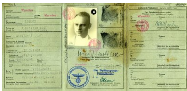
Kenkarta Witolda Pileckiego na nazwisko Smoliński.